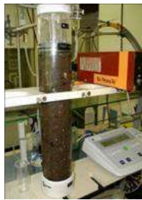
Exemple d'essai de lixiviation en colonne

La caractérisation fine des matières issues du recyclage (composition, spéciation, réactivité) est nécessaire pour l'évaluation du « terme source ». Outre les analyses physico-chimiques de compositions, la réactivité doit être étudiée par des essais de lixiviation, des essais thermogravimétriques, des essais de biodégradation, etc. Les essais écotoxicologiques permettent de compléter la caractérisation du terme source car ils sont intégrateurs et peuvent être plus sensibles que l'analyse chimique et détecter des effets synergiques ou antagonistes. Ils peuvent aussi être utilisés in situ pour évaluer l'exposition des cibles. Enfin le terme transfert rassemble les interactions possibles des polluants entre la source et les cibles. Son évaluation repose sur des essais à différentes échelles et sur la modélisation des phénomènes.