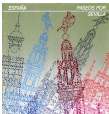
Fig. 4 : Remedios Molina, Paseos por Sevilla: España , 1994 Madrid, Ministerio de Comercio y Turismo, Turespaña