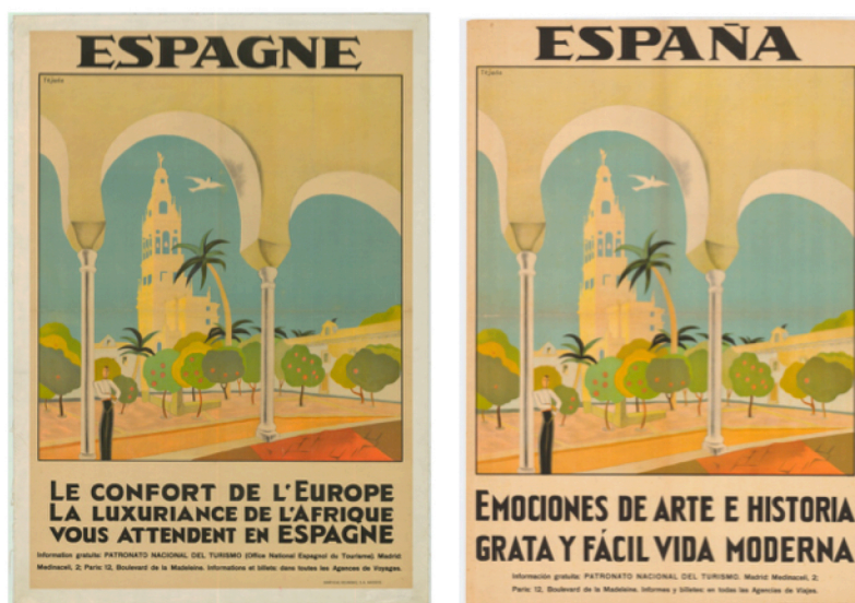
Fig. 7 : Patronato Nacional de Turismo (dibujo de Tejada), 1929 Madrid, PNT, col. Centro de Documentación Turística de España, Instituto de Turismo de España, www.tourspain.es

Ces images sont accompagnées de slogans qui font également partie de l'identité visuelle dans la mesure où ils se situent à côté du logo sur les affiches ou publications. Le premier slogan date du PNT et un recensement de ceux-ci, toutes institutions confondues, montre la modernité de l'Espagne en la matière avec un recours précoce au marketing émotionnel cherchant à faire du lien entre un produit et les émotions qu'il va procurer aux clients – contrairement au marketing pragmatique qui veut promouvoir un produit pour son aspect, utile, pratique, esthétique. Si certains slogans mettent en avant la différence espagnole, d'autres insistent sur la modernité ou l'émotion, par l'emploi récurrent de la deuxième personne du singulier. Il s'agit alors d'un tourisme centré sur son destinataire, un voyageur capable de s'appropriier les lieux qui se réinventent à leur tour en fonction des visiteurs.