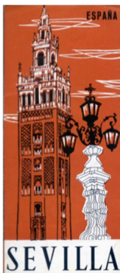
Fig. 3 : Ministerio de Información y Turismo, Sevilla: España , 1960 Madrid, Ministerio de Información y Turismo, Dirección General de Turismo

Malgré les discours para-textuels des publications institutionnelles qui mettent en avant la volonté de s'éloigner des discours étrangers chargés de clichés qui réduisent la ville à quelques repères, ceux-ci perdurent. Ils se transmettent par le texte mais aussi par les illustrations qui occupent une part importante des brochures et guides étudiés. Les images de la Giralda sont deux exemples qui permettent d'illustrer cette continuité :