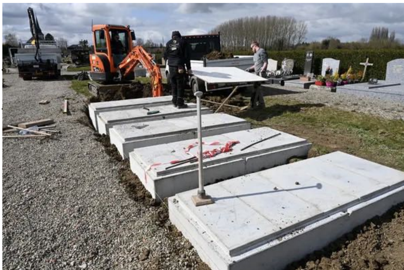
Les employés d'une entreprise de pompes funèbres installent le 30 mars 2020 quinze nouveaux caveaux dans un cimetière en France.

Si la famille est jointe, elle est invitée à se présenter à l'hôpital. Dès que le corps est décemment installé dans une chambre d'exposition, le responsable du dépositaire accueille les parents du défunt et leur transmet les documents afférents au décès ; il décrit l'usage de ces documents avec des informations complémentaires en vue de les orienter et de leur permettre de gérer au mieux la suite des événements. Si la housse mortuaire est restée ouverte à la tête, le linceul est retiré pour que la famille puisse voir le visage du défunt. Si la famille le demande, le contact est pris avec des pompes funèbres en vue d'organiser la mise en bière, l'inhumation ou de la crémation et le départ du cercueil.