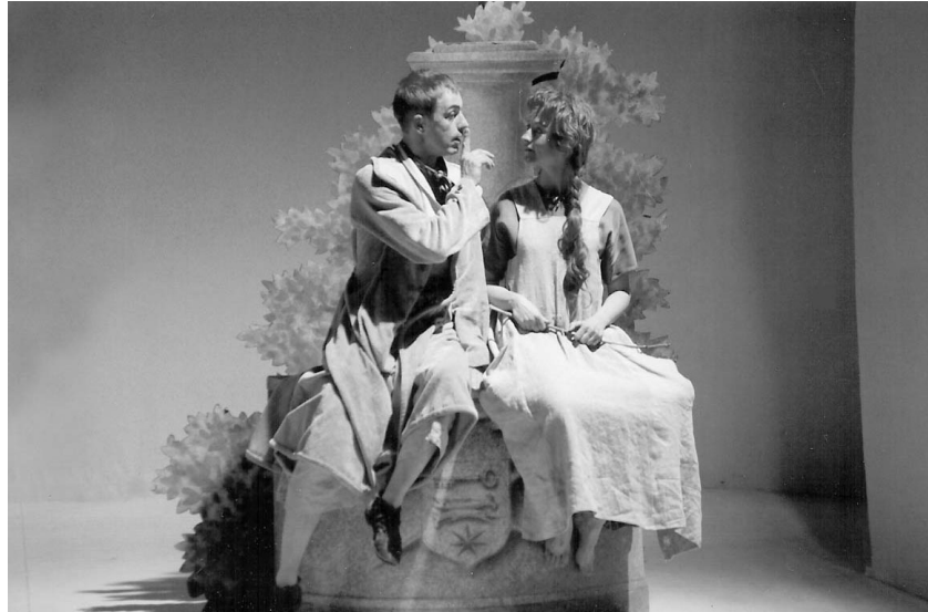
Der Talisman in der Inszenierung von Stéphane Verrue.