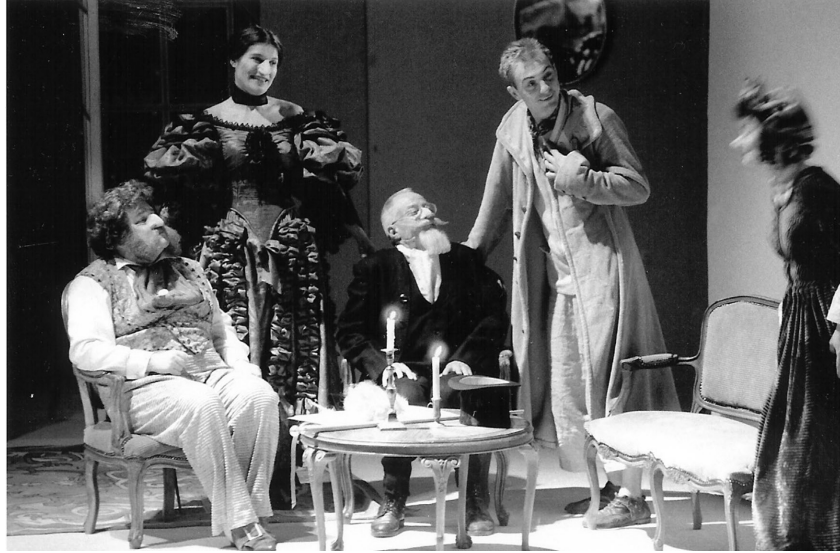
Der Talisman in der Inszenierung von Stéphane Verrue.