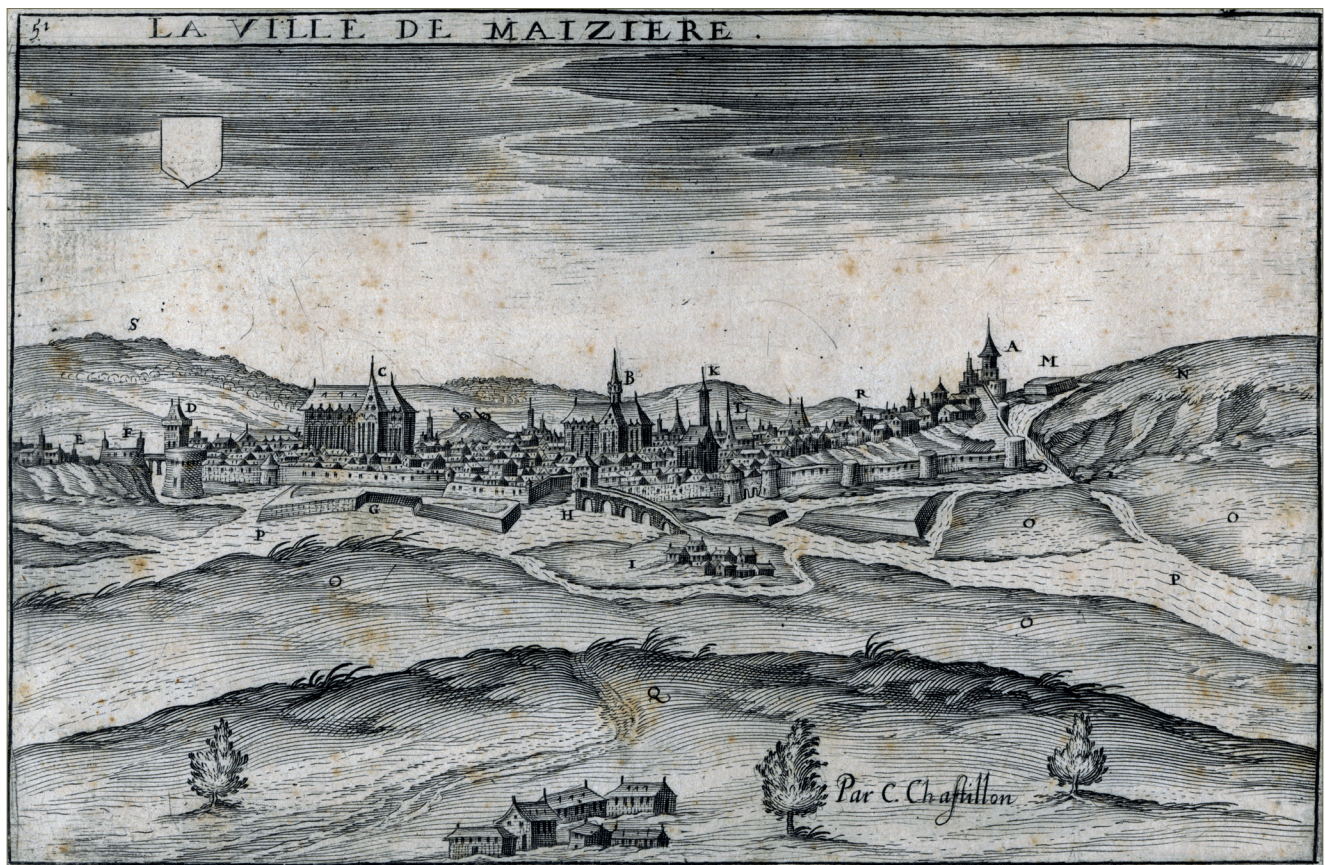
Fig. 1.10 – Gravure de Mézières par Claude Chastillon (1559-1616). On remarque l'ancienne motte castrale (à droite de la lettre C) qui est utilisée comme cavalier d'artillerie, notamment lors du siège de 1521 (Musée de l'Ardenne – INV 2010.00.035).

Jusqu'à présent, il n'a pas été question de Mézières qui a donné son nom au doyenné : la création de Mézières est tardive et son église Notre-Dame (citée dans le pouillé) n'est devenue paroissiale qu'au XII e siècle (fig. 1.9). Auparavant, il semble bien que l'église primitive de la boucle de Mézières était l'église Saint-Julien. On devrait pouvoir la relier à l'ensemble de cimetières découverts à proximité et dont la chronologie s'étend du Bas-Empire à l'époque mérovingienne. Devenue prieuré affilié à Mouzon au XII e siècle, l'enclos qui l'enfermait comportait encore au XVIII e siècle deux églises, ce que l'on pourrait considérer comme un signe supplémentaire d'ancienneté 10 .