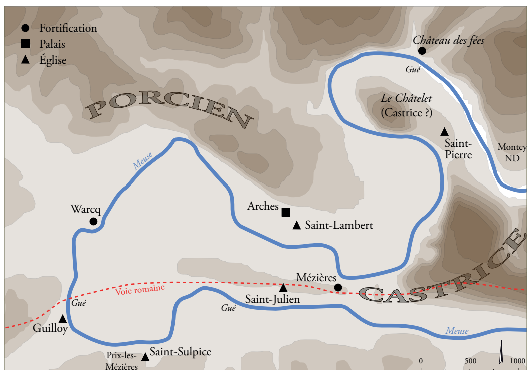
Fig. 1.9 – Le secteur d'Arches-Mézières au v siècle (d'après P. Bertrand – AtlasMed).

(ancien Castrice) s'imbriquent l'un dans l'autre, si l'on en croit le pouillé antérieur à 1312. Le Château des fées illustre la complexité des frontières religieuses de ce secteur. En effet, il n'a pas été possible de déterminer avec précision les liens entre ces doyennés. Toute la rive gauche en amont du château et l'intérieur de la boucle de la Meuse semble curieusement appartenir aux deux doyennés. Cet étrange état de fait a été établi à la lumière du pouillé antérieur à 1312.