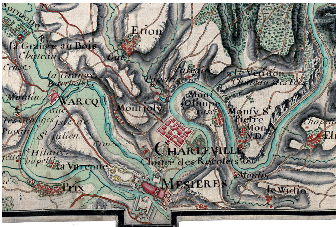
Fig. 1.16 – Extrait de la carte des frères Naudin : seconde partie de la carte particulière du cours de la rivière d'Aisne... de 1739 (BM Metz, dép. Patrimoines, RES ROL 014).

Liège possédaient encore des biens à Arches, vraisemblablement ceux qui avaient été restitués en 894.