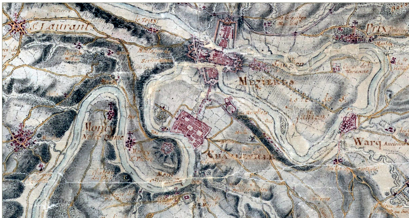
Fig. 1.17 – Extrait du plan de Claude Masse de 1734 (BnF, dép. Cartes et plans, GE AA-2053 (RES)).

(fig. 1.16). Les raisons de ce changement de nom ne sont pas connues. Mais de la légende, nous passons alors au mythe.