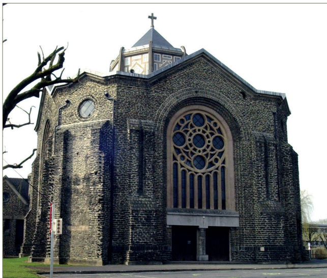
Fig. 1.22 – Église Sainte-Jeanne d'Arc de la Houillère, construite de 1929 à 1931 avec l'ardoise extraite au Waridon.