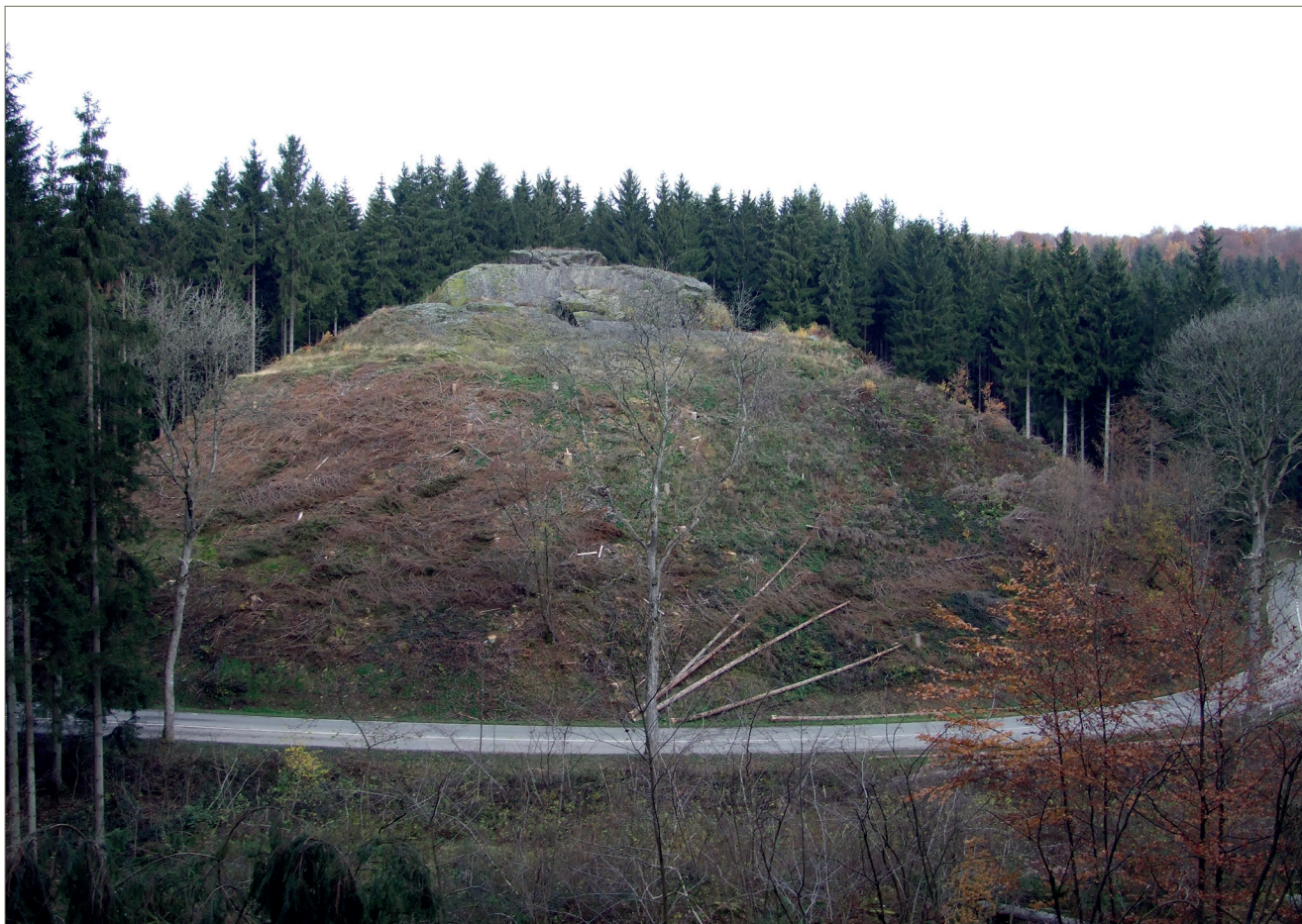
Fig. 1.13 – Le Tchesté de la Rotche à Sugny.

blement à la partie noble du site. Sept bâtiments en bois sont attestés dans la basse-cour. Ils témoignent d'activités artisanales sur le site et renseignent sur la vie quotidienne de ses occupants.