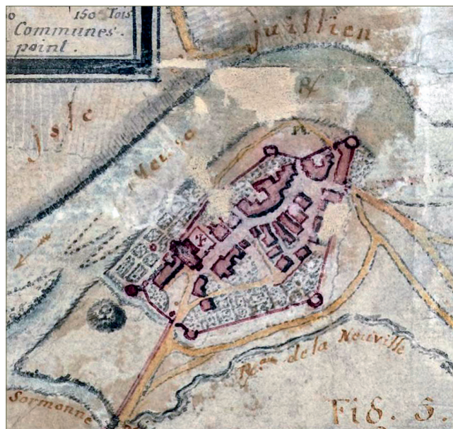
Fig. 1.11 – Représentation de Warcq et de sa motte castrale en bordure de Meuse sur le plan de Claude Masse de 1734 (BnF, dép. Cartes et plans, GE AA-2053 (RES)). Son usage militaire est ici déjà abandonné (la motte est au sud de la Sormonne).

Ce site est installé au nord de la commune de Thinle-Moutier, au creux de la vallée du Thin, au milieu des marais. Nous ne connaissons pas avec certitude la date d'apparition de cette motte. La lecture de la Chronique de Mouzon , rédigée vers 1040, permet toutefois de supposer qu'elle existe en 971, année où les moines du prieuré voisin de Thin sont transférés à l'abbaye de Mouzon, suite à la prise de Warcq par Adalbéron. Il fait mention du château de Cantarana (là où chantent les rainettes, allusion au biotope local). Ce château est la propriété d'un certain Goéran, peut-être le comte de Porcien du même nom. La configuration de ce site, et sa disparition des textes, invitent à penser qu'il eut une fonction très limitée dans le temps.