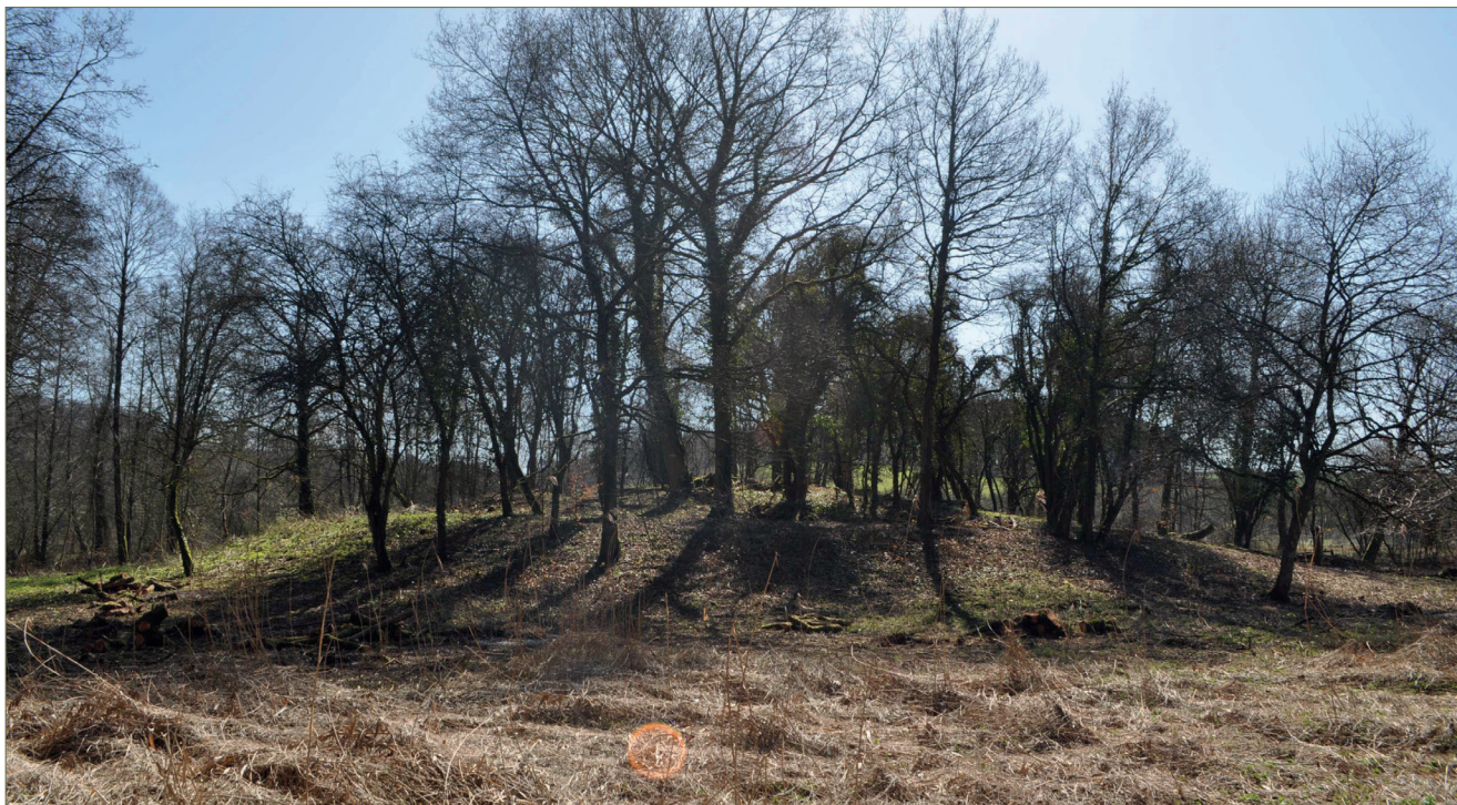
Fig. 1.12 – Motte de Chantereine.

Les fragments de céramique retrouvés sur la motte par prospection attestent d'une occupation autour de l'an Mil mais plusieurs artefacts d'inspiration gallo-romaine semblent montrer une anthropisation du secteur plus ancienne.