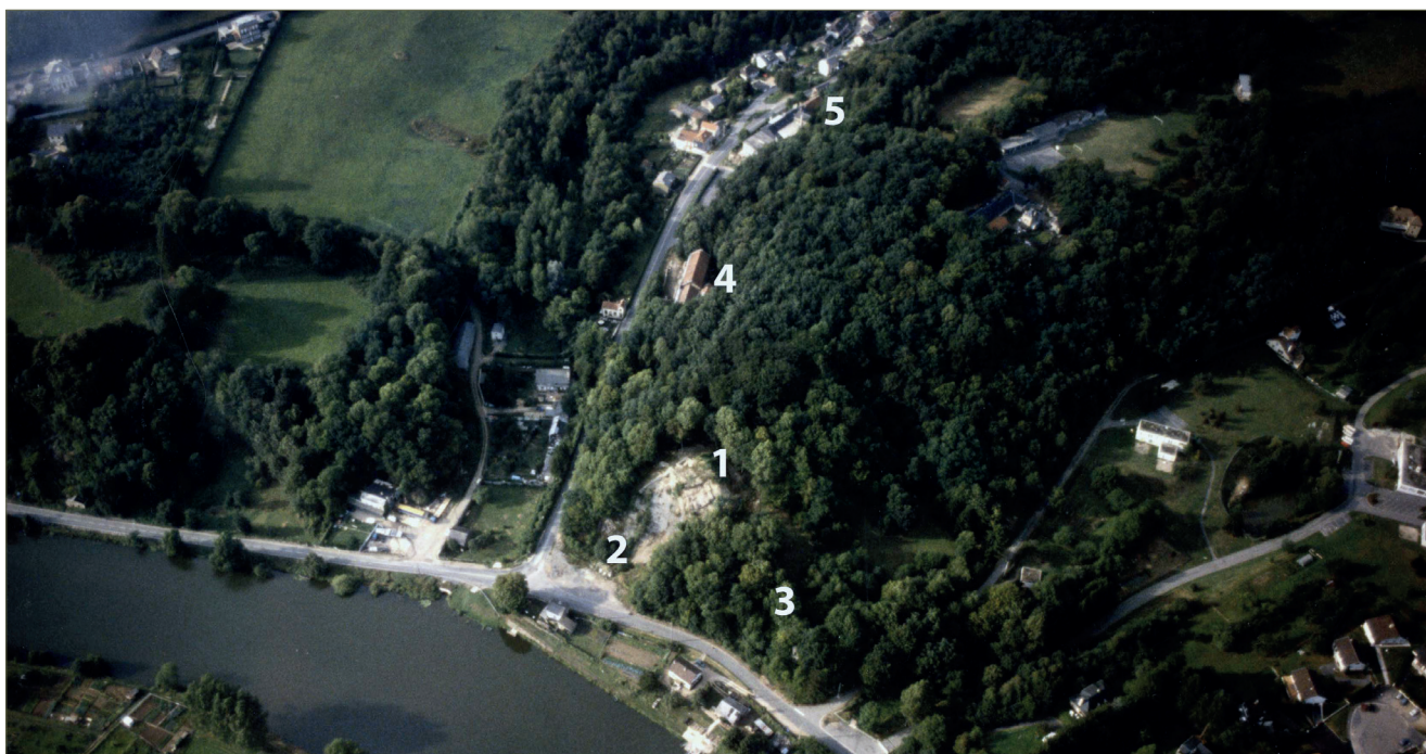
Fig. 1.23 – L'éperon du Waridon à la fin des années 1980. 1- Château des fées ; 2- ancienne carrière ; 3- parc romantique ; 4- ancien séminaire ; 5- hameau du Waridon.

Voici ainsi dans quelles conditions le site du Waridon est parvenu aux archéologues de 1984 (fig. 1.23).