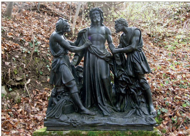
◀ Fig. 1.18 – Une des stations du chemin de croix du Waridon, coulé à Vaucouleurs.