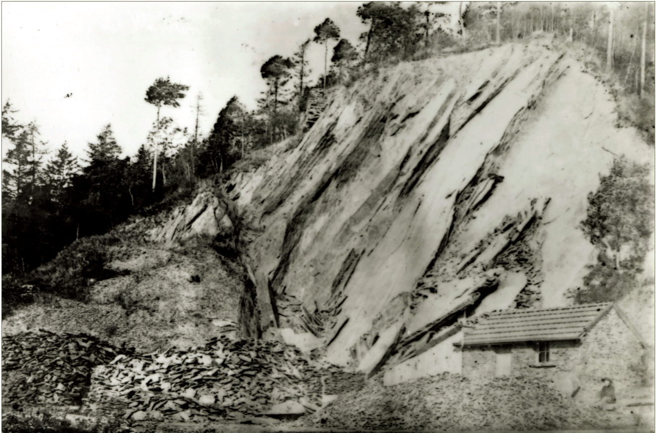
Fig. 1.21 – Photo réalisée vers 1900, montrant la carrière entaillant l'éperon rocheux du Waridon. On devine au sommet un morceau de maçonnerie du Château des fées (coll. particulière).