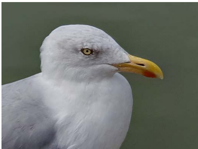
Deauville (11 septembre 2019)

Les travaux de groupe sont perçus, à ce stade, comme difficiles à gérer pour tout le monde. La distance est jugée trop limitante pour des interactions fluides et maîtrisées. Les consignes pour les travaux de groupe sont ressenties comme difficiles à présenter, on n'a pas comme en présentiel la facilité pour l'enseignant d'aller d'un groupe à l'autre. On ne voit pas ses camarades, les tensions