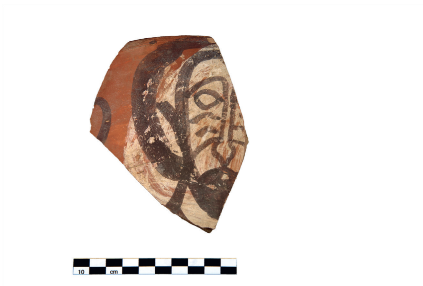
Fig. 3. Cerámica excepcional con decoración figurativa del monasterio de Qubbet el-Hawa.