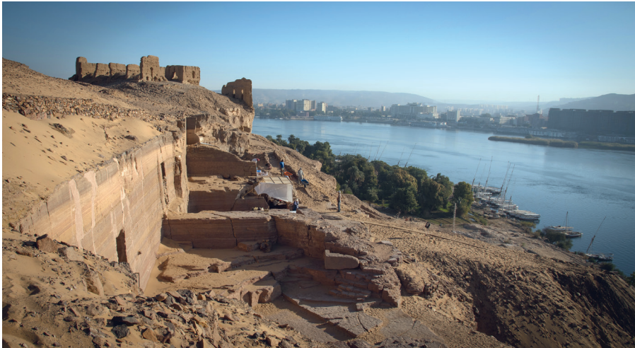
Fig. 1. Vista general del yacimiento de Qubbet el-Hawa con el monasterio bizantino en la parte alta de la colina.

M. Valenti Costales, «Diferentes periodos cronológicos detectados a partir del material cerámico hallado en la tumba 34 de Qubbet el-Hawa (Asuán)» in A. Agud, A. Cantera, A. Falero, R. El-Hour, M.A. Manzano, R. Muñoz, E. Yildiz (éd.), Séptimo centenario de los estudios orientales en Salamanca , Estudios filológicos 337, Salamanca, 2012, p. 71-78.