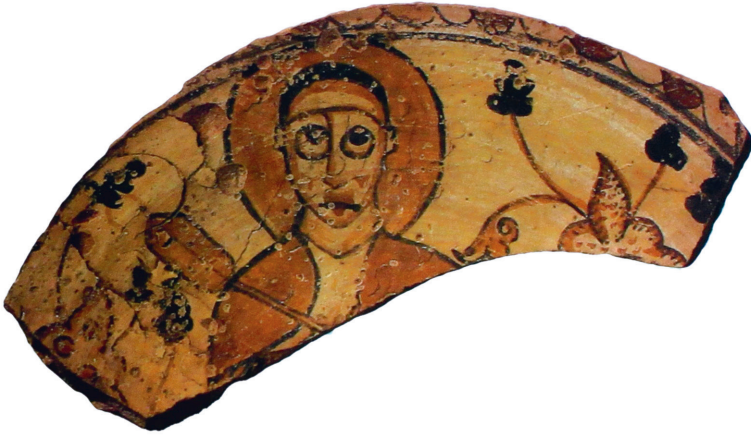
Fig. 4. Fragmento cerámico con decoración figurativa de la Isla de Elefantina (Gempeler 1992, p. 104, T-354).