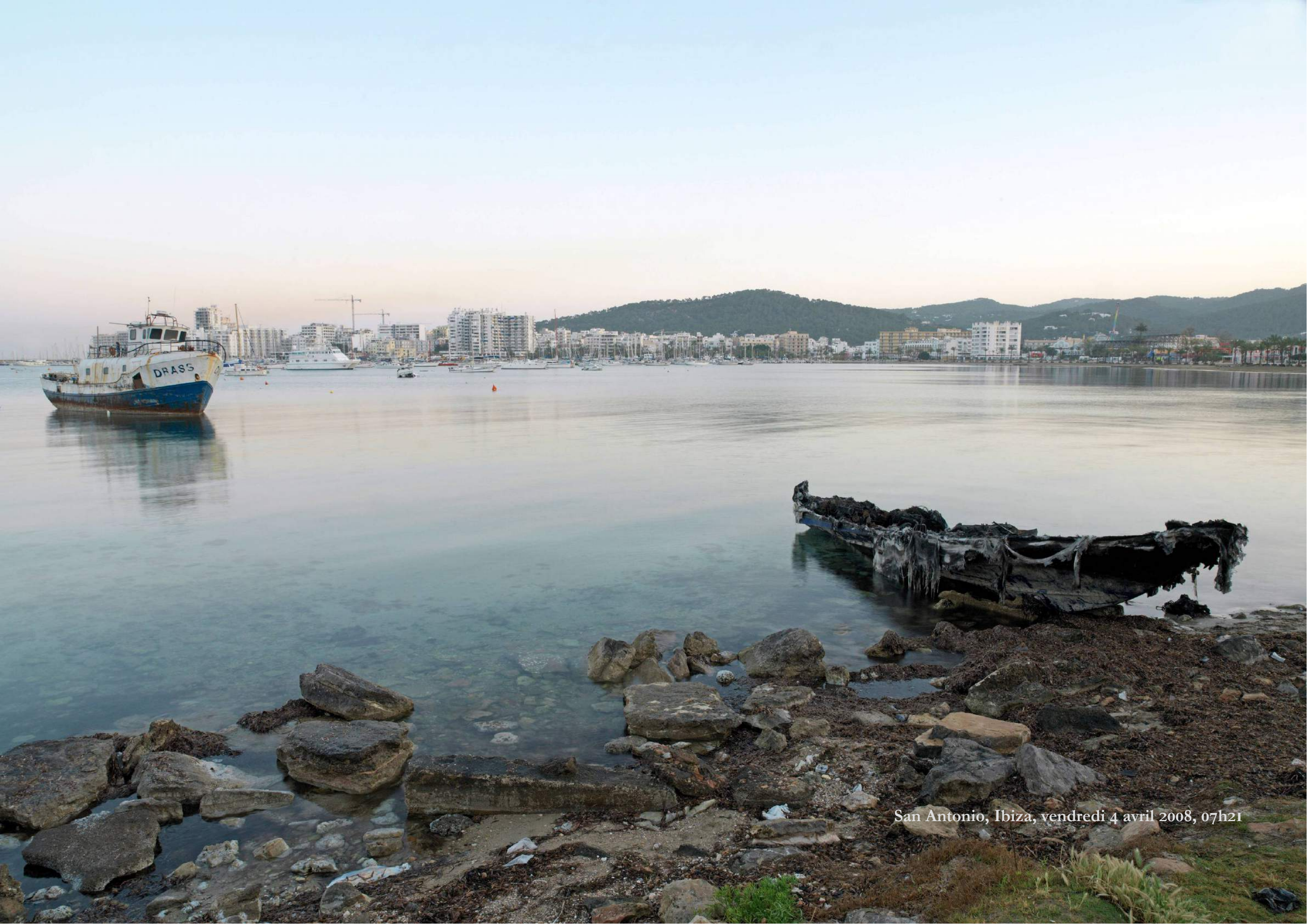
San Antonio, Ibiza, vendredi 4 avril 2008, 07h21