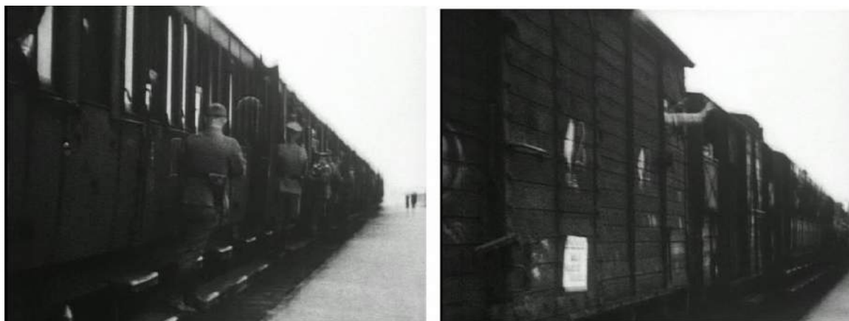
Deux captures d'écran issues de En Sursis (2007) d'Harun Farocki (time code : 38 : 05 à 38 : 18)

est qu'il s'agit d'Heydrich et que la séquence a été tournée en France. La narration se poursuit (« le voyage sans retour vers les chambres à gaz d'Auschwitz »), alors que l'on voit des déportés aux abords des wagons. La voix s'interrompt pendant quelques secondes. Un plan représentant des soldats fermant un wagon à bestiaux est monté. Il est bruité de manière tonitruante. Cinq secondes du plan du départ du train sont alors intégrées au film, puis un nouveau fondu au noir et l'image d'Auschwitz-Birkenau se succèdent. Pour résumer, les séquences ainsi montées ne sont pas contextualisées 1 . Si cette tendance à décontextualiser les images afin qu'elles servent d'illustration est critiquable du point de vue des pratiques historiennes des images animées, il faut bien comprendre que c'est, de fait, notre modalité principale d'accès aux images du passé. Les chercheurs insistent actuellement moins sur la nécessité de corriger ces erreurs, que sur l'importance de les prendre en compte dans nos interprétations des représentations présentes du passé 2 .