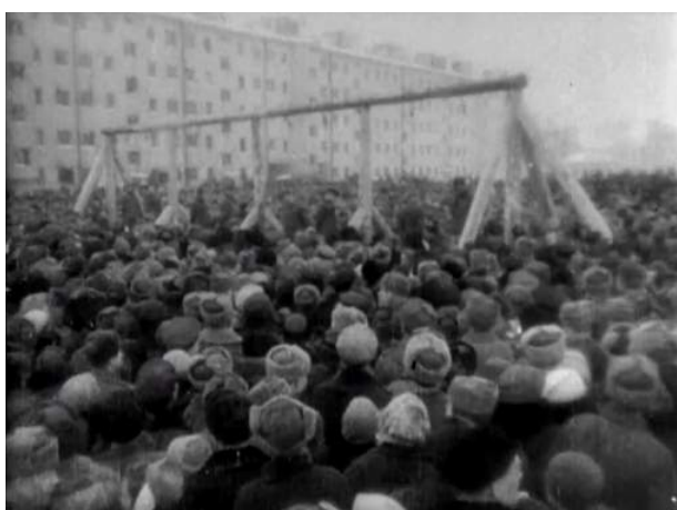
Blocus , 2006

neuf ans plus tard, L'Événement . Mon hypothèse est que les images du soulèvement de la population de Leningrad en 1991 sont devenues lisibles pour le cinéaste depuis le présent ukrainien, sur la place du Maïdan, devenue véritablement une scène politique tant s'y manifeste le désir des insurgés de se montrer et de se voir parmi les autres.