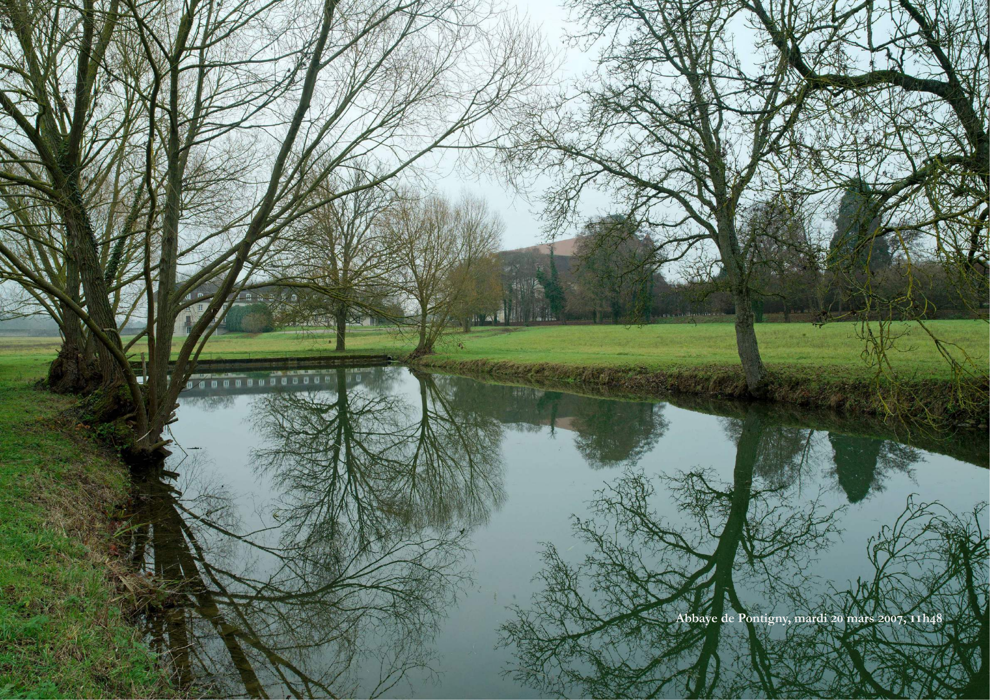
Abbaye de Pontigny, mardi 20 mars 2007, 11h48