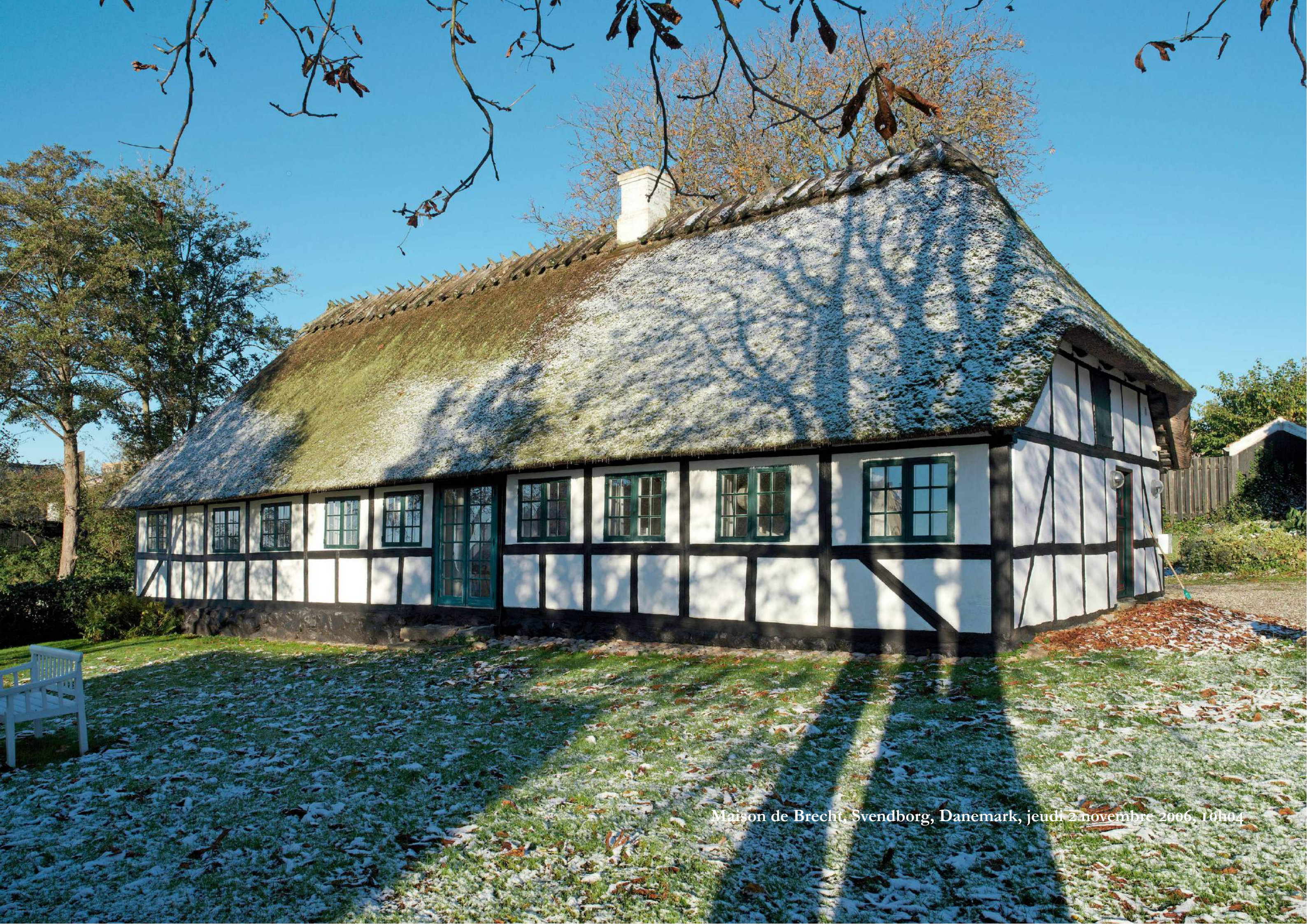
Maison de Brecht, Svendborg, Danemark, jeudi 2 novembre 2006, 10h04