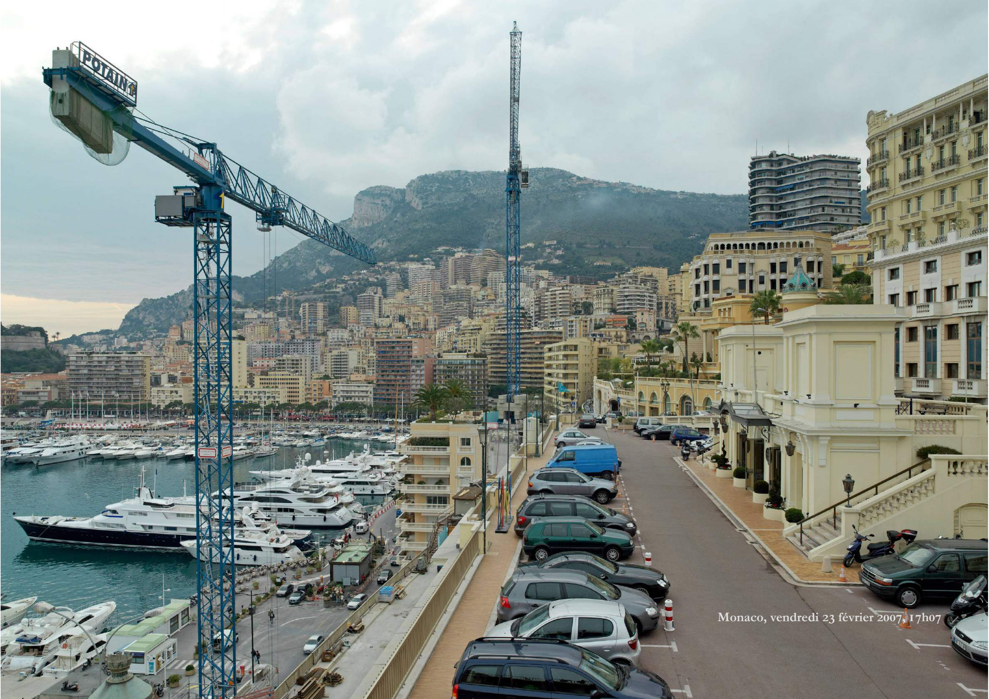
Monaco, vendredi 23 février 2007, 17h07