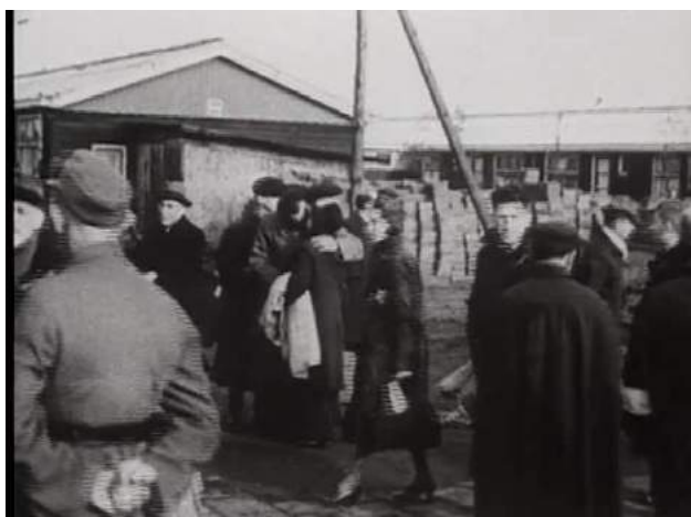
Capture d'écran de l'archive consultable au Musée Mémorial de l'Holocauste de Washington (cote : RG-60-2101, time code : 6 : 06)