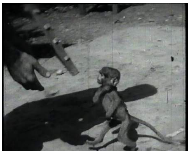
Natureza morta. Visages d'une dictature (2005) de Susana de Sousa Dias

sphère particulière dans laquelle l'œuvre tout entière nous plongera – la temporalité décélérée qui interrompt le flux du temps en déliant les photogrammes, l'étrange beauté des images vieillies qui invitent à la contemplation, ainsi que l'indétermination du sens qui en émane. D'autre part, cette scène diffère de toutes les autres, puisque c'est la seule qui suscite une lecture métaphorique au lieu de montrer des aspects de la vie sociale et politique sous le régime dictatorial de Salazar, offrant au spectateur une sorte de variation imaginaire et émotionnelle de l'état de dépendance et d'oppression de ses citoyens.