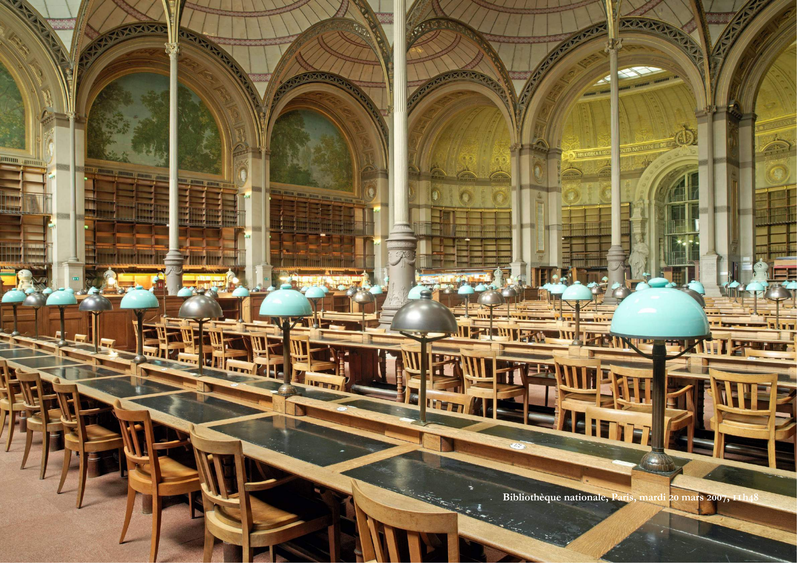
Bibliothèque nationale, Paris, mardi 20 mars 2007, 11h48