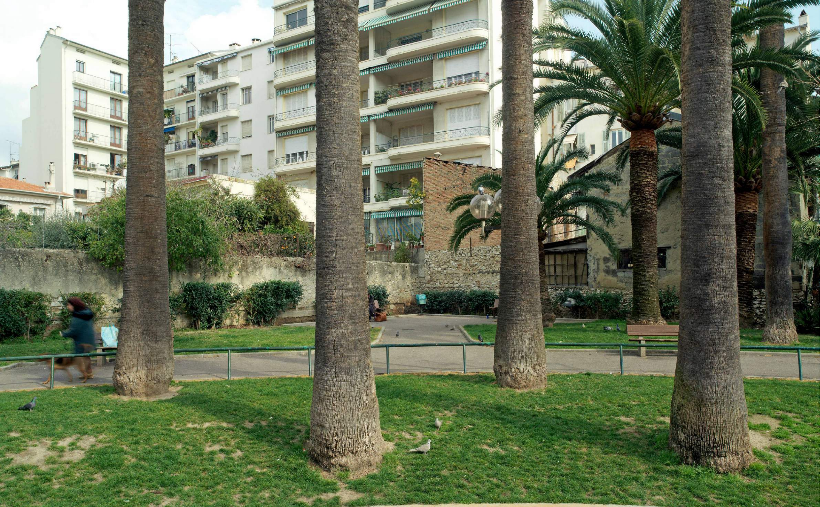
Impasse Villermont, ancien hôtel du Petit Parc, Nice, vendredi 23 février 2007, 12h42