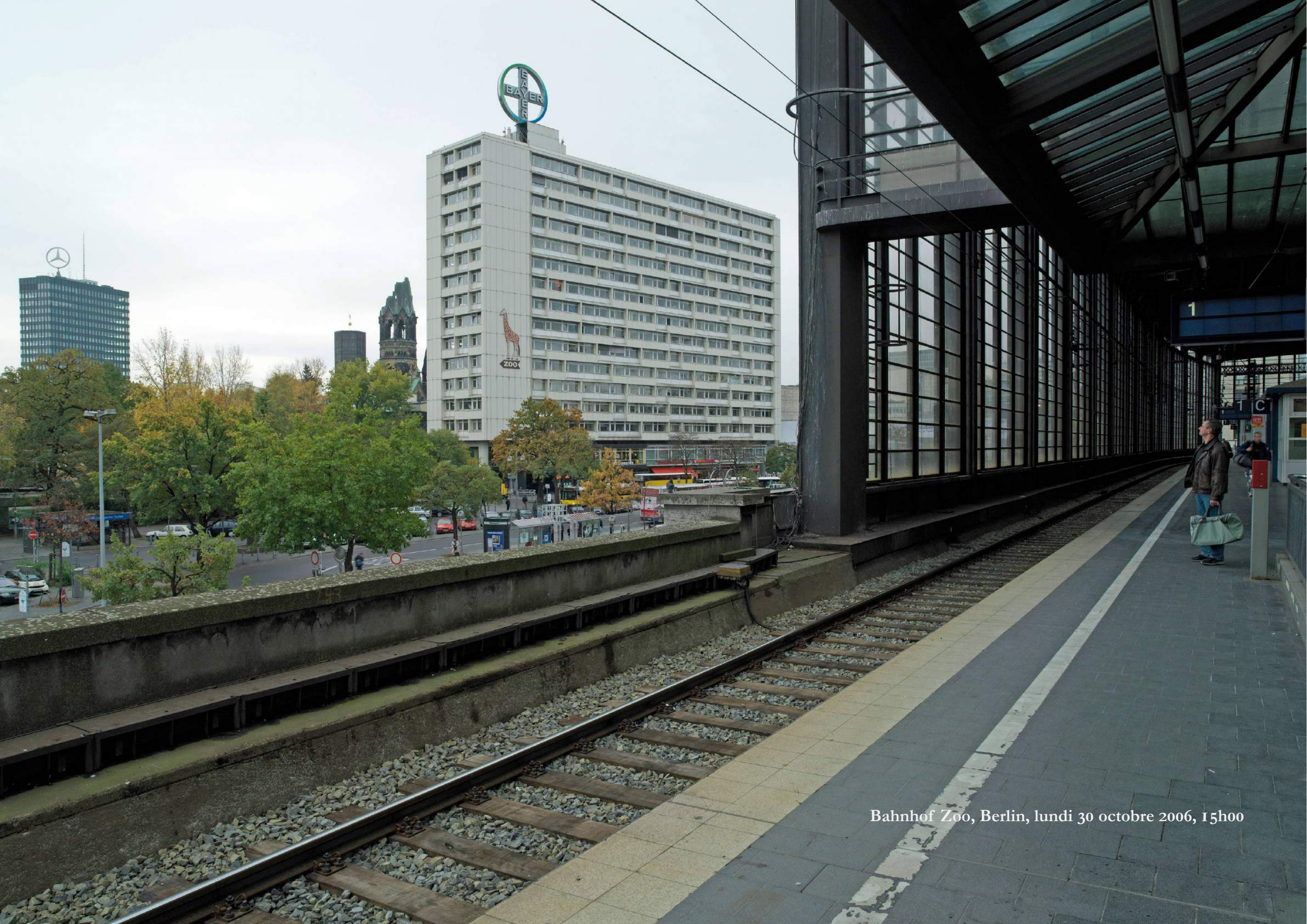
Bahnhof Zoo, Berlin, lundi 30 octobre 2006, 15h00