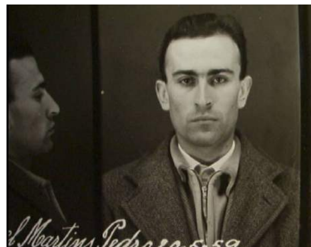
Natureza morta. Visages d'une dictature (2005) de Susana de Sousa Dias