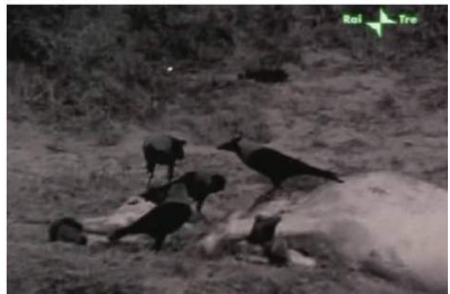
Notes pour un film sur l'Inde, 1968

des métaphores (celui du Maharaja) vient renforcer ce débat nécessaire, cette multi-dimensionnalité du temps où le passé (la légende, l'héritage historique indien) vient questionner la phase historique que traverse l'Inde avec son industrialisation par les puissances occidentales. Ainsi, l'industrialisation néocapitaliste est crûment représentée par les rapaces, les vautours qui tournent autour de la carcasse de la vache sacrée.