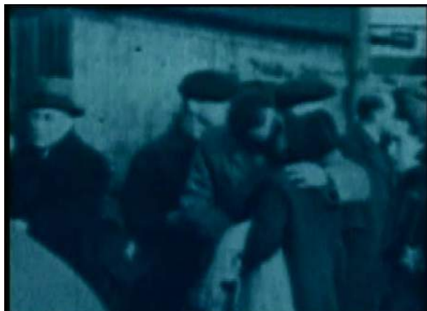
Trois captures d'écran issues du film de Forgács

du plan) est teintée en bleu 5 . Au début de cet autre extrait de Meanwhile somewhere... , la mention « Westerbork – Pays-Bas » est inscrite dans le coin supérieur droit de l'image. Par la suite, une voix off,