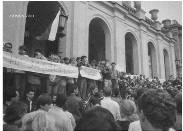
L'Événement , 2015

moments où, comme l'écrit Michel Foucault, nous pouvons apercevoir « un peu au-dessous de l'histoire, ce qui la rompt et l'agite ». C'est dans ces moments de soulèvement, ajoute-t-il, « que la subjectivité (pas celle des grands hommes, mais celle de n'importe qui) s'introduit dans l'histoire et lui donne son souffle. » Il suffit qu'existent ces voix confuses, « pour qu'il y ait un sens à les écouter et à chercher ce qu'elles veulent dire. [...] Tous les désenchantements de l'histoire n'y feront rien : c'est parce qu'il y a de telles voix que le temps des hommes n'a pas la forme de l'évolution, mais celle de l'"histoire", justement 1 . »