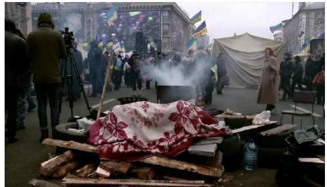
Maïdan , 2014