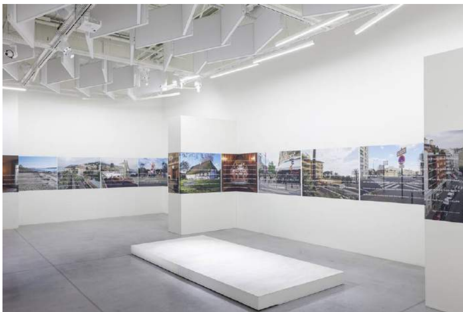
Konstellation Benjamin , Espace Tempo, Pau, 2017

Enfin, par l'ouverture de ses propres archives, en nous livrant douze photographies inédites de Konstellation Benjamin (2005-2009), Arno Gisinger intervient dans la version complète du numéro en essaïmant d'autres points de vue sur les lieux de sa série de trente-six arrêts sur images, découpés, en collaboration avec Nathalie Raoux, dans les