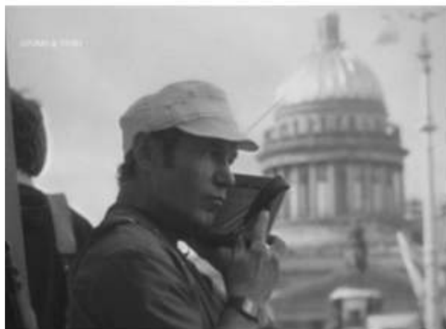
L'Événement , 2015

annonça sa démission du poste de président de l'URSS et l'Union soviétique elle-même cessa d'exister.