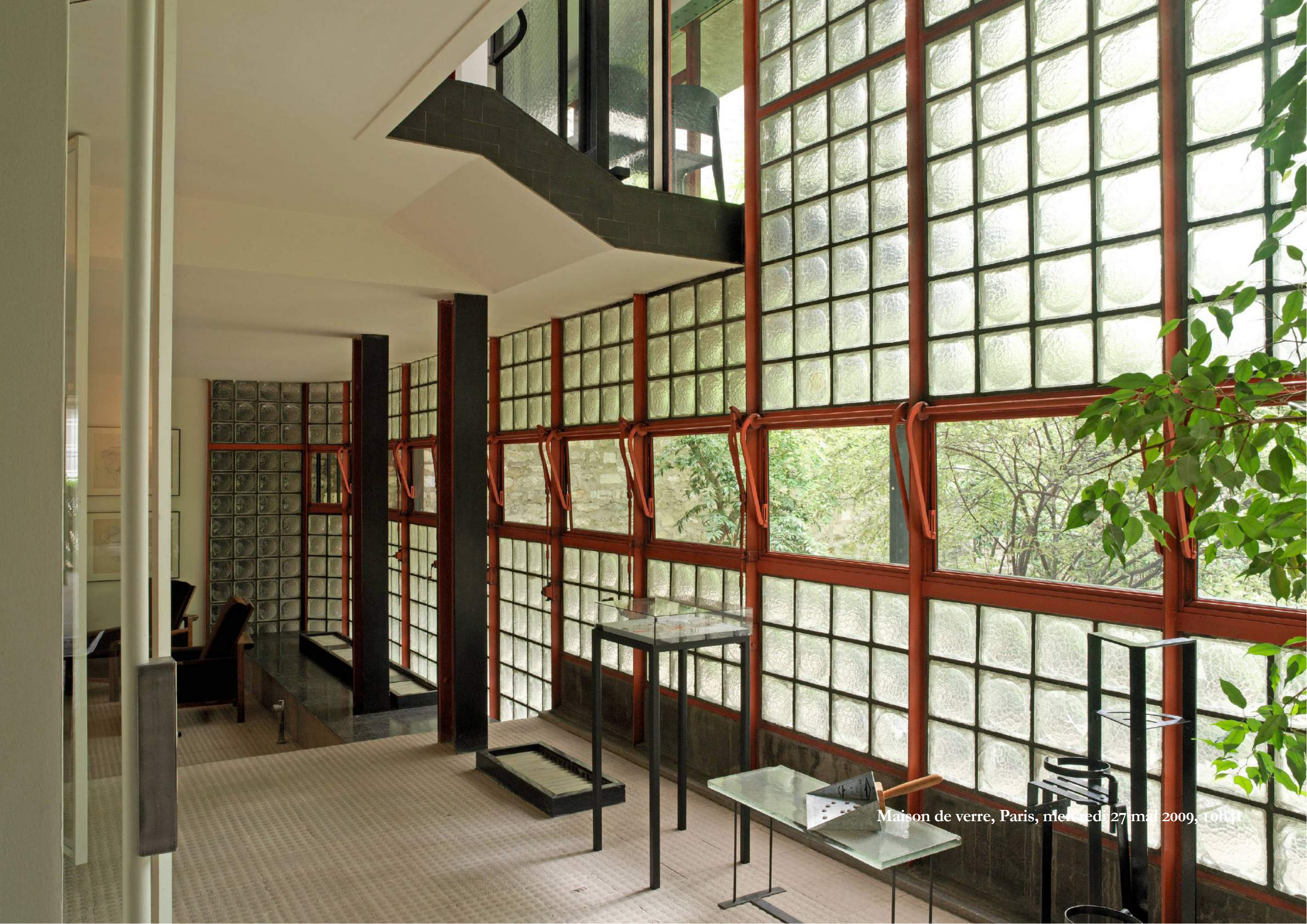
Maison de verre, Paris, mercredi 27 mai 2009, 10h21