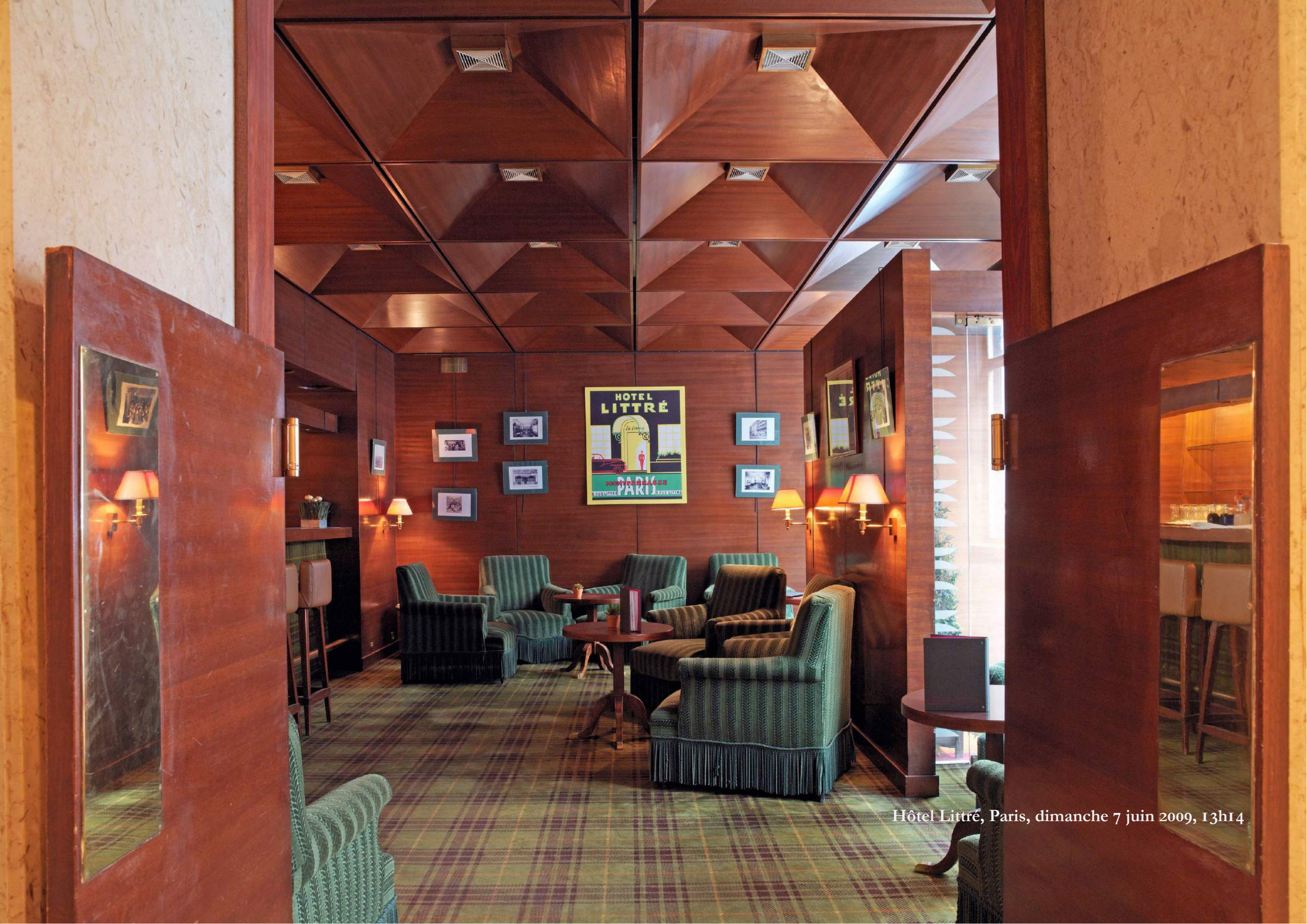
Hôtel Littré, Paris, dimanche 7 juin 2009, 13h14