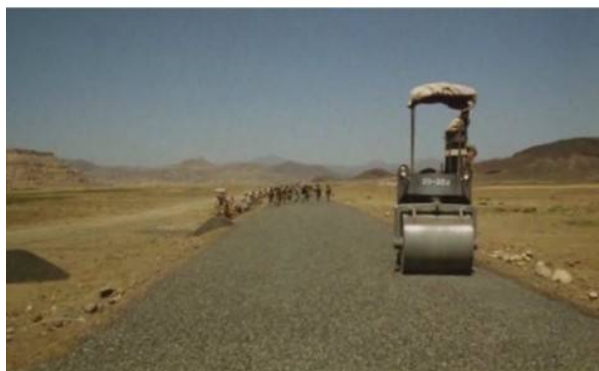
Les Murs de Sana'a, 1971