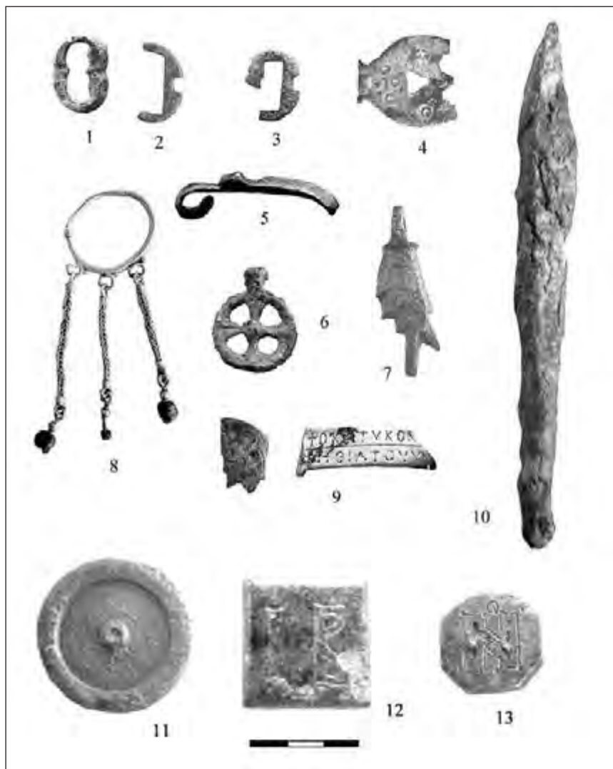
Рис. 1. Некоторые находки из сооружения VS 01