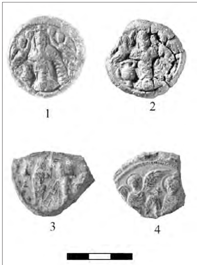
Рис. 3. Евлогии из раскопок на Via sacra