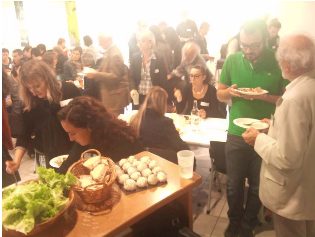
Pause déjeuner...un moment de détente : repas végétarien préparé par le LOUBATAS

Chargée de Mission Habitat (CR PACA) Ce sont les locataires qui sont à viser prioritairement. Le nerf de la guerre c'est l'amélioration de l'habitat grâce à des moyens incitatifs et coercitifs afin de favoriser la mise en place de travaux pour les propriétaires bailleurs. Quels liens alors établir avec le réseau des propriétaires bailleurs ?