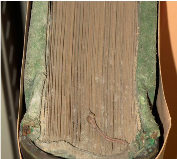
▲ Figure 2. Tranche d'un registre contaminé par des moisissures.

besoins importants en eau pour se développer (activité en eau A_w > 0,90 ) et leur présence peut être expliquée par une hygrométrie élevée dans les archives.