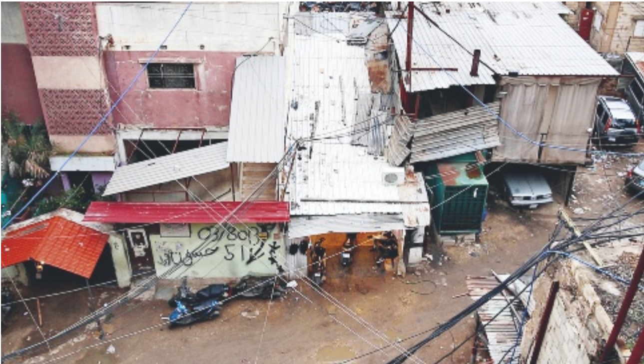
Camp Palestinien de Burj Al Barajneh, Beyrouth, septembre 2017 © Justin de Gonzague.