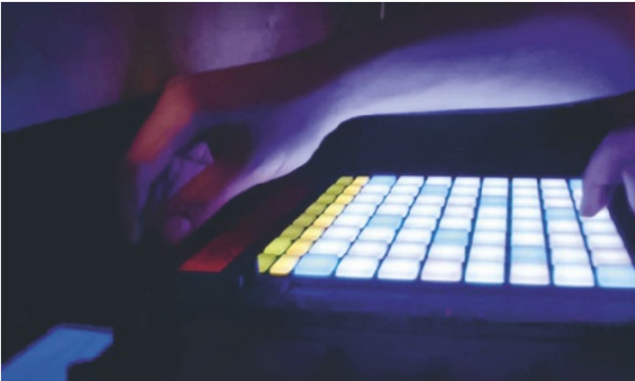
Studio Katibeh Khamseh . Banlieue sud de Beyrouth, Al Dahieh, mai 2013 © Justin de Gonzague.