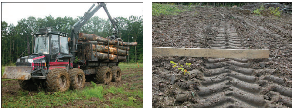
Photo 2 Site expérimental de la forêt domaniale des Haut-Bois (Azerailles, Meurthe-et-Moselle), sur lequel un tassement contrôlé du sol a été réalisé au moyen d'un porteur Valmet chargé de bois (PTC 25t) (photo 2a à gauche) laissant des zones compactées et des bourrelets (photo 2b à droite). Il s'agit d'un site pilote instrumenté labellisé dans le SOERE F-ORE-T mis en place en 2007, avec l'appui financier de l'ONF.

d'abattage, de débusquage et de débardage, a donc potentiellement un effet négatif sur la consommation de méthane. Le site expérimental de la forêt des Haut-Bois à Azerailles a été mis en place en 2007 pour suivre les effets à court et long terme de l'impact de la circulation d'un porteur chargé de bois (photo 2a, ci-dessous) sur un sol forestier sensible (forte teneur en limon en surface, engorgement temporaire dû à une rupture texturale vers 50 cm de profondeur) (Goutal et al. , 2013).