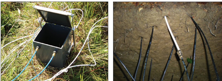
Photo 1 Chambre de mesure à fermeture automatique du flux net de méthane échangé entre le sol et l'atmosphère (photo 1a à gauche) et tubes hydrophobes perméables aux gaz insérés horizontalement dans le sol à différentes profondeurs (photo 1b à droite). Les deux dispositifs, installés en forêt domaniale des Haut-Bois (Azerailles, Meurthe-et-Moselle), sont couplés à un spectrophotomètre à diode laser permettant de mesurer plusieurs fois par jour le flux net à l'interface sol-atmosphère et le profil vertical de concentration de méthane dans l'air du sol.

lorsque la consommation domine. La concentration de méthane dans l'air de la chambre était jusqu'à très récemment mesurée par chromatographie en phase gazeuse, soit de manière statique (un échantillon d'air de la chambre est prélevé régulièrement pour être injecté dans un chromatographe), soit de manière dynamique (une pompe permet à l'air de circuler entre la chambre et le chromatographe). Dans ce dernier cas, l'ouverture et la fermeture du couvercle de la chambre sont souvent automatisées (photo 1a, ci-dessous), permettant des mesures régulières du flux au cours d'une journée. Les progrès récents en spectrophotométrie à diode laser ont permis de remplacer les chromatographes en phase gazeuse par des analyseurs à source infrarouge dans les systèmes dynamiques. Une des limites majeures des systèmes dynamiques reste la surface réduite sur laquelle ils peuvent être déployés, qui dépend de la longueur des tuyaux permettant à l'air de circuler entre les chambres et le chromatographe ou l'analyseur. D'autre part, la consommation d'énergie des pompes et de l'analyseur limite leur emploi sur des sites disposant d'une source d'électricité. Néanmoins, cette approche permet d'avoir une résolution temporelle suffisamment fine (plusieurs mesures par jour) pour établir des bilans fiables, ce que ne permettait pas l'approche statique avec des mesures ponctuelles prises avec une fréquence rarement meilleure que mensuelle.