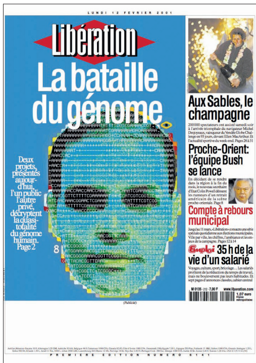
Imagen 5. Primera página de Libération (12 de febrero de 2001).

Por su parte, Libération apenas modifica su posición, como lo confirma su editorial, proponiendo siempre una visión biológica del hombre: “Es la calidad, y sobre todo la complejidad de las combinaciones entre nuestros genes y las proteínas ligadas a ellos lo que hacen de los seres humanos lo que son” ( Libération , 12 de febrero de 2001). Es interesante comparar el título de su artículo principal del 12 de febrero de 2001 12 : “Esta combinación de 30.000 genes que hace al hombre”, con el de La Croix : “El hombre no puede resumirse a sus genes”, o con el de Le Figaro : “Un andamiaje que no explica al hombre”.