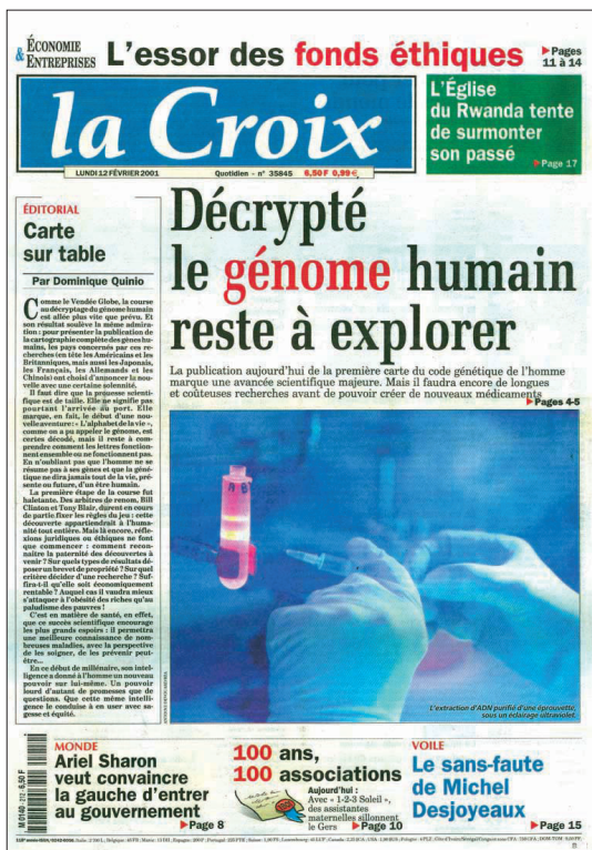
Imagen 6. Primera página de La Croix (12 de febrero de 2001).