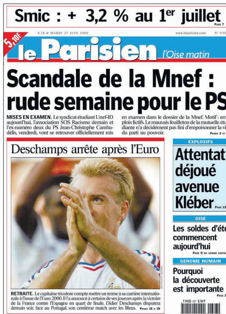
Imagen 2. Primera página de Le Parisien (27 de junio de 2000).

Se decía que la cartografía de los genes, con sus localizaciones en los cromosomas, bastaría para diagnosticar un buen número de enfermedades. ¿Justificaba esa expectativa la enorme inversión financiera? Descifrar la secuencia de las bases no permitiría siquiera identificar los genes dispersos a lo largo de la molécula de ADN, tampoco permitiría comprender cómo se expresan, ni mucho menos se captaría el papel que desempeña el entorno. Por pura curiosidad científica esta empresa resultaba tentadora y también sustentada por un modelo geneticista del ser humano hecho patente cuando, principalmente en Estados Unidos, se creyó descubrir el “gen de la inteligencia” o el “de la homosexualidad”, algunas décadas después de haber anunciado el descubrimiento del “cromosoma de la criminalidad” (Nelkin & Lindee, 1996). Si se pensaba que los genes iban a explicar la fisiología, la psicología y la vida social del hombre, había, en efecto, que apresurarse a decodificar su secreto.