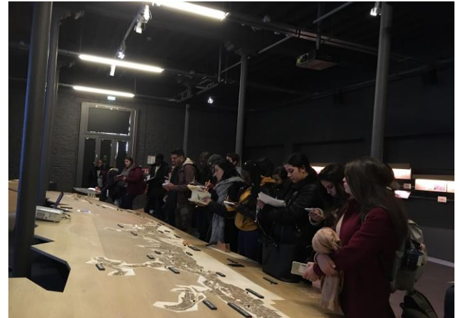
Figure 2 : Etudiant.e.s découvrant la maquette cartographique, en réalité augmentée, des climats le long des vignobles AOC

La notion appliquée de « Climat » a ainsi été abordée à la Maison des Climats de Beaune (Figure 2). Celle-ci reste centrale dans les paysages viticoles bourguignons ainsi que dans l'organisation spatiale de la Route des Vins (aménagement, mesures de protection du patrimoine naturel et culturel, etc...), leur labellisation et leur attractivité touristique et économique.