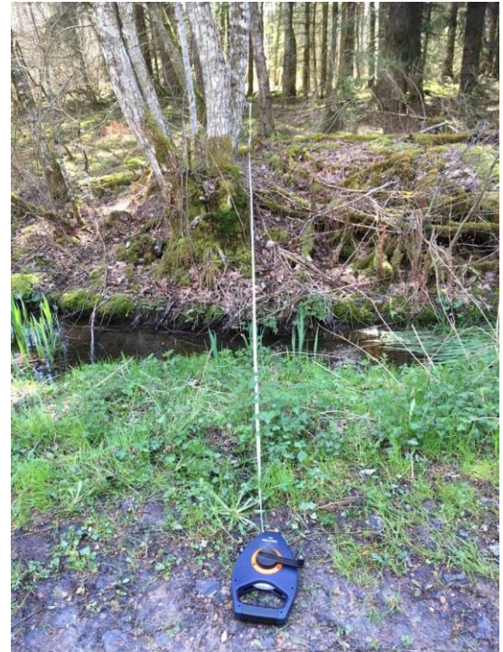
Figure 4 : Exemple de transect forestier pour la réalisation de relevés de physiognomie de la végétation dans les tourbières du PNR du Morvan Crédit : S. Piñeros, 18 avril 2019

Les croquis paysagers ont amené les étudiant.e.s à tenter de sectoriser graphiquement la portion d'espace qu'ils percevaient (premier plan, deuxième, arrière-plan notamment), à hiérarchiser les éléments paysagers, et à les nommer/catégoriser (voir annexe 4).