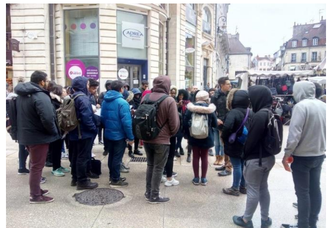
Figure 3 : Etudiant.e.s et accompagnateur.e.s bravant les éléments en milieu urbain (Crédits : R. Courault, 16 avril 2019)

La partie urbanistique fût abordée à Dijon, grâce au responsable du Service Urbanisme de Dijon-Métropole, qui nous a fait la gentillesse d'une visite guidée insistant sur le palimpseste géographique et architectural du centre-ville (Figure 3). Cette journée, se concentrant sur la thématique urbaine, a été l'occasion de répartir les groupes d'étudiants dans différents quartiers et « hauts-lieux » de la ville de Dijon pour s'exercer à l'observation participante et à la technique du questionnaire via smartphone (voir Annexe 4).