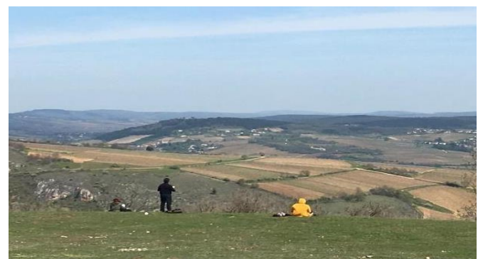
Figure 6 : Étudiants en train de réaliser un croquis paysager sur la face NE de la Roche de Solutré. prise le 18 avril 2019