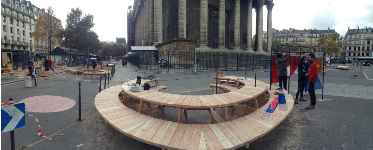
1. Réinventons nos places, chantier de préfiguration de la place de la Madeleine à Paris.

influencé le dessin, par les réactions et discussions suscitées lors des phases de conception et de chantier (voir l'illustration 1). Il était cependant dans l'incapacité de dire exactement à quelle étape ou sur quels détails cela avait joué. Lui-même utilisait l'idée d'infusion pour décrire cette influence, présente, sans être totalement palpable (entretien avec C. Bouteiller, novembre 2017).