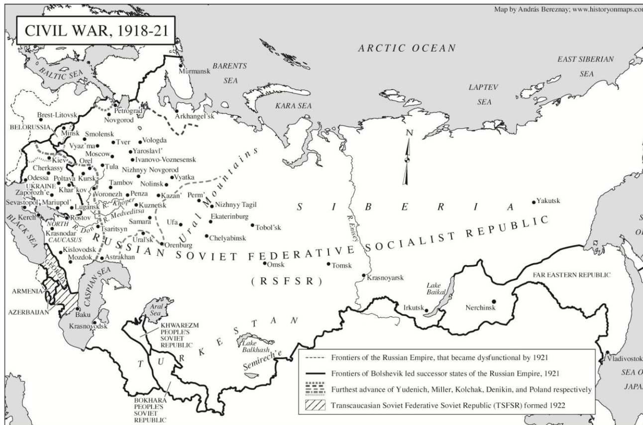
Carte d'András Bereznay, insérée avec son aimable autorisation

soufflait sur l'Empire des Habsbourg durant la seconde moitié du XIXe siècle aurait conduit le gouvernement à créer un État fédéral accordant aux différentes ethnies l'autogestion désirée. C'est, du moins, ce qu'entendait réaliser Charles I er , le dernier empereur des habsbourgeois. 33