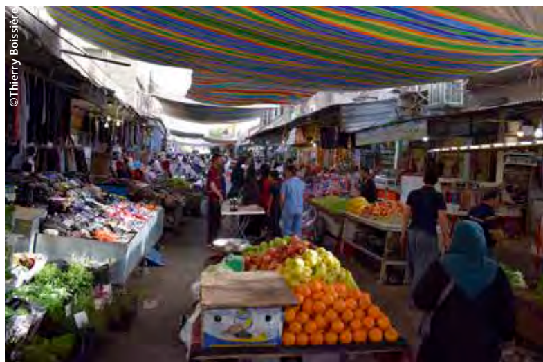
Marché couvert dans le centre-ville

■ ■ ■ mall et le commerce de rue. Enfin, certains centres commerciaux, en partie désaffectés comme le Nishtiman Bazaar construit entre 2002 et 2007, ou laissés inachevés comme certains bâtiments de la périphérie, accueillent des familles de réfugiés qui transforment les locaux vacants en habitats précaires.