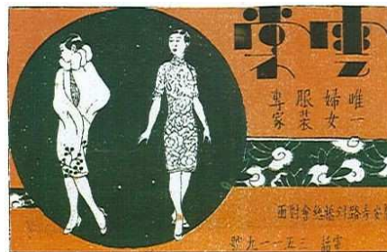
Fig. 4 : Shanghai Sketch , n°90, 15 mars 1930, p.4, publicité pour la marque de vêtements Yunshang (雲裳) dessinée par Ye Qianyu.

Enfin, les pages de la revue sont remplies d'encarts publicitaires, notamment pour des marques de cigarettes. Le régime de Chiang Kai-shek encourage la consommation, perçue comme critère de modernité. La contribution du commerce et de l'industrie à la puissance des nations, l'attrait des biens matériels lui confèrent une valeur positive. « Ces publicités qui façonnent la sensibilité collective représentent une véritable sémiotique de la culture matérielle. Même si les objets et les modèles qu'elles proposent restent inaccessibles à la l'immense majorité des Shanghaiens, ils font partie d'un imaginaire qui fascine et inspire. » 13 Le culte de l'apparence physique comme critère de modernité favorise le développement de la mode. Comme Zhang Guangyu, Ye Qianyu travaille pour la compagnie de mode Yunshang (雲裳), croquant sous tous les angles de jeunes élégantes avec une verve qui annonce son goût futur pour les danseuses aux costumes bariolés 14 . La frontière entre caricature artistique et publicitaire tend à s'estomper : auteurs et styles graphiques apparaissent comme identiques 15 [Fig. 4].