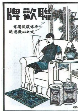
Fig. 7: Shanghai Sketch n°28, 27 octobre 1928, p. 4, publicité pour les cigarettes United Club (聯歡) .

Emoustillé par le vin, je la dévisageai. « Ne me regarde pas comme ça. », dit-elle en souriant malgré elle. « Tu n'as pas une cigarette ? » Je lui tendis une cigarette de la marque 555. Au lieu de la prendre, elle se pencha sur la table et m'offrit ses lèvres. [...] Devant ces deux pétales rouges et pleins, j'éprouvai un désir incontrôlable qui brûla au fond de moi-même.