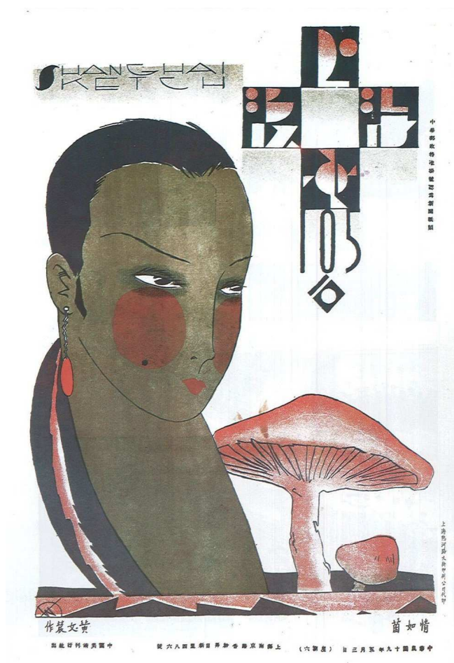
Fig. 2 : Shanghai Sketch n°105, 3 mai 1930, Les sentiments poussent comme des champignons (情如菌), illustration de couverture par Huang Wennong.

Même le Bifur du graphiste Cassandre, style typographique sans empattement qui tente de donner à la page la sévère apparence de l'architecture, retient l'attention des artistes chinois collaborant à la revue : « Il est la capitale comme instinctivement ramassée dans les seuls éléments forts qui dominent sa masse visible : horizontales, obliques, fragments de cercle. La lettre trouée par la vitesse de quelque voiture de course lancée à toute allure ou d'une locomotive brûlant les rails. Efficace et foudroyante. » 6 Une version chinoise de cette police d'écriture apparaît dans les numéros du 22 mars 1930 et du 3 mai 1930 [Fig. 2]. Le caractère est réduit à ses éléments essentiels, déformé, mais toujours lisible, les espaces fermés étant remplis de la même manière que les lettres de Bifur.