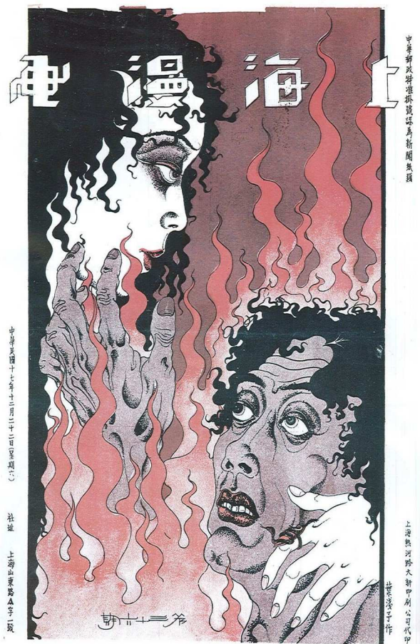
Fig. 8 : Shanghai Sketch n°36, 12 décembre 1928, Désir (慾火) de Ye Qianyu.

Visible dans nombre de revues illustrées chinoises des années 1920 et 1930, la marque d'Aubrey Beardsley est ici évidente : les références à certaines illustrations de Le Morte d'Arthur de Thomas Malory, réalisées en 1892, sont transparentes. La propension à imiter ce style si singulier qui fit scandale en son temps se décèle dans les cadrages inattendus, les effets dissymétriques, les jeux d'arabesque, ou encore les contrastes de détails groupés et de vastes réserves de blanc, mais aussi l'atmosphère à la fois érotique, sarcastique et raffinée. Cet artiste anglais mort à l'âge de 25 ans fut l'inventeur d'un langage graphique qui s'affirma avec force dès 1892 : « Le scandale tient d'abord à la nouveauté formelle, absolument fracassante, de ce style qui sait tirer de la relation des blancs et noirs des effets étonnants. Il tient ensuite au fait que, s'inscrivant de la sorte dans la tradition fort récente issue de Swinburne, le jeune artiste a décidé de jouer la carte de la provocation érotique. » 26 Il n'est donc guère surprenant que ce personnage haut en couleur qu'était Shao Xunmei, sponsor de la revue, ait encouragé une telle esthétique et insufflé ses goûts décadents à la revue Shanghai Sketch , lui-même émule de Swinburne et auteur d'une poésie qui ne cesse de dépeindre la dualité féminine, ce mélange de séduction et de répulsion, dans une quête éperdue de raffinement et de sensualité.