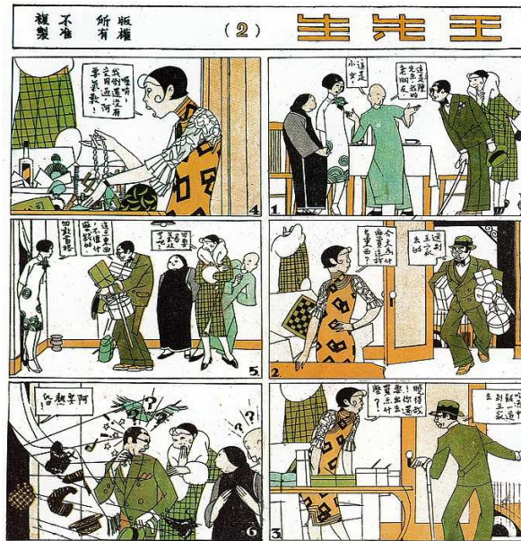
Fig. 5 : Shanghai Sketch n°2, 28 avril 1928, p. 5, Monsieur Wang (王先生) de Ye Qianyu.