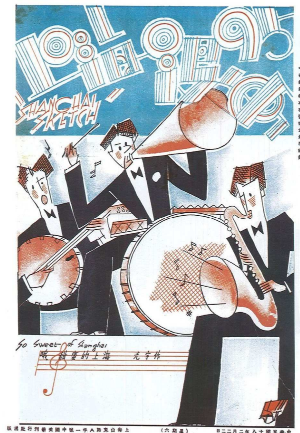
Fig. 1 : Shanghai Sketch n°87, 22 février 1929, So Sweet Shanghai (哦 甜蜜的上海), illustration de couverture par Zhang Guangyu.

Modèle archétypal de l'Art déco, le style Broadway, créé par Morris Fuller Benton, est transposé en chinois sans que la lisibilité en soit compromise pour autant : on y retrouve les contrastes importants entre principaux traits larges et lignes très fines. La couverture du n°95 du 22 février 1929, signée par Zhang Guangyu 張光宇 (1902-1965), s'inscrit dans la même veine par ses caractères formés de parallèles rouges et bleues, pareils à des notes de musique échappées des trompettes de l'orchestre de jazz traité par simplifications géométriques cubistes et aplats de couleurs. La tension créée par le contraste entre lignes droites et courbes des caractères d'écriture se prolonge dans le dessin [Fig.1].