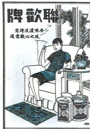
Fig. 7: Shanghai Sketch n°28, 27 octobre 1928, p. 4, publicité pour les cigarettes United Club (聯歡) .

Emoustillé par le vin, je la dévisageai. « Ne me regarde pas comme ça. », dit-elle en souriant malgré elle. « Tu n'as pas une cigarette ? » Je lui tendis une cigarette de la marque 555. Au lieu de la prendre, elle se pencha sur la table et m'offrit ses lèvres. [...] Devant ces deux pétales rouges et pleins, j'éprouvai un désir incontrôlable qui brûla au fond de moi-même.