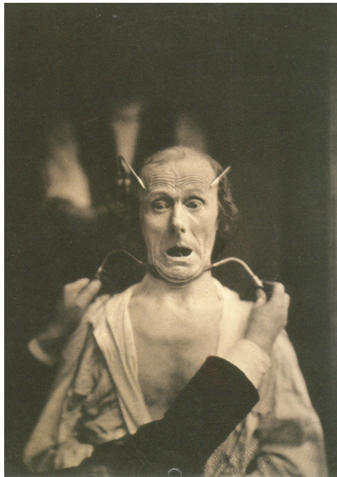
Stimulation électrophysiologique par Duchenne de Boulogne (droits réservés).

différentes phases et poses de la « grande attaque hystérique », distinguant multitude de gestes, parfois à peine esquissés ou empêchés (Didi-Huberman, 1982). Ces gestes involontaires avaient déjà attiré l'attention d'un autre scientifique français, Duchenne de Boulogne, qui, dans les Mécanismes de la physionomie humaine ou analyse électrophysiologique des passions (1862), prétendait cerner le geste de chaque émotion ou de chaque maladie, notamment en mobilisant des dispositifs de stimulation électrique des muscles. Le procédé (le plus moderne qui soit alors) permet de commander à distance un geste mais reste encombrant (électrodes, fils, etc.) : le physiologiste russe Ivan Pavlov va le simplifier. Par une longue série d'expériences sur la digestion conduites à partir de 1889, il établit la notion de réflexe conditionné. Découverte capitale pour la physiologie, le geste peut être provoqué par un stimulus (visuel, sonore ou autre).