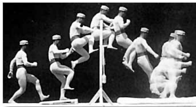
Décomposition du geste par Marey (droits réservés).

de pouvoir réaliser ses expériences scientifiques, met au point différents appareils enregistreurs dont son célèbre fusil photographique (1882), capable de prendre douze clichés par seconde (Marey, 1894). Nourri des dispositifs développés au même moment par l'Anglo-américain Eadweard Muybridge, spécialiste de la photographie du mouvement, le travail de Marey s'impose pour ses performances exceptionnelles (Mannoni, 1994). Parallèlement, Charles Hacks élabore une monographie consacrée au geste humain, qui doit être doublement comprise comme « anatomie » et « physiologie ». Le Geste paraît en 1892 : c'est une histoire du geste à visée anthropologique, adossée à un relevé systématique des gestes de l'époque, présentés en quatre catégories (les gestes naturel, appris, cultivé et malade).