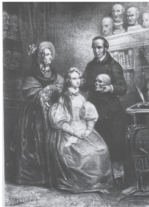
Analyse phrénologique.

Science, médecine, ordre public : les gestes intéressent toutes les catégories du savoir. L'esthétique va elle aussi s'en emparer. François Delsarte, par exemple, fonde une poétique à partir des rapports entre les gestes et l'affect et crée une sténographie très précise des