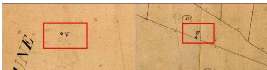
Figure 3. Identification de vignes « V » sur un extrait du cadastre napoléonien de Saint-Jouan-des-Guérets, 3P5509 Section B2 de Launay Guinard, parcelles 456 à 761 (1834, échelle 1/2500)