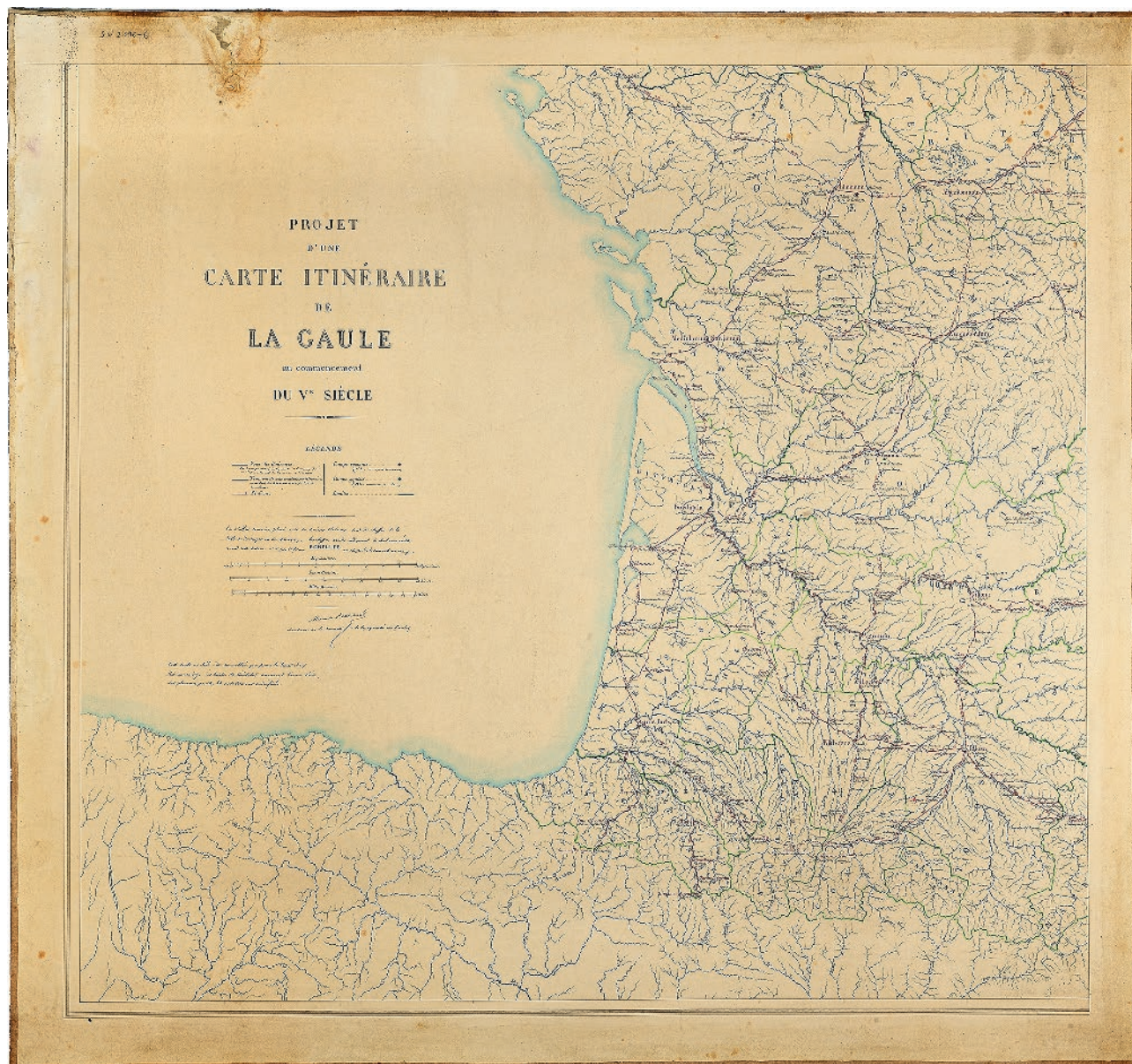
Fig. 3 : Quart sud-ouest du projet d'une carte itinéraire de la Gaule au V e siècle par Alexandre Bertrand (Saint-Germain-en-Laye, MAN, centre des archives, SN 2016-6.).

reprend le fond de carte oro-hydrographique que l'on doit aux travaux de la CTG et destiné à servir à l'ensemble de la communauté savante 27 . Le registre conservé au centre des archives du MAN sous le titre Carte des Gaules – détail d'exécution rend compte de la composition des fonds de carte utilisés par la CTG et montre que l'élaboration de ces fonds servait ensuite à la réalisation d'un grand nombre de cartes différentes. Sont ainsi reproduits l'emplacement des cités et des voies romaines au début du V e s., ainsi que les délimitations des différentes cités, toujours dans une perspective de géographie historique visant à remonter aux origines des toponymes modernes et à établir la