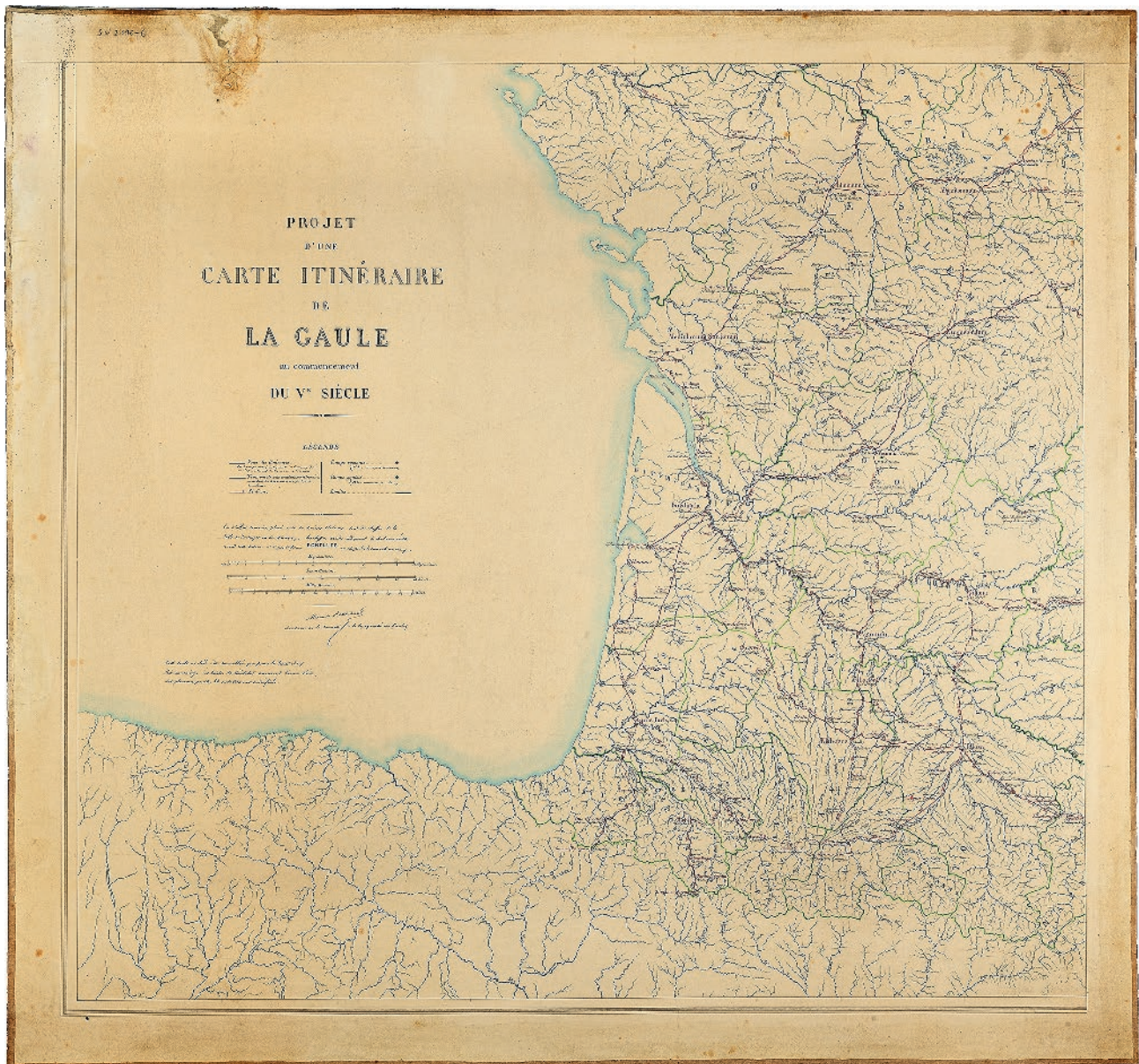
Fig. 3 : Quart sud-ouest du projet d'une carte itinéraire de la Gaule au V e siècle par Alexandre Bertrand (Saint-Germain-en-Laye, MAN, centre des archives, SN 2016-6. © MAN/Valorie Gô).

reprend le fond de carte oro-hydrographique que l'on doit aux travaux de la CTG et destiné à servir à l'ensemble de la communauté savante 27 . Le registre conservé au centre des archives du MAN sous le titre Carte des Gaules – détail d'exécution rend compte de la composition des fonds de carte utilisés par la CTG et montre que l'élaboration de ces fonds servait ensuite à la réalisation d'un grand nombre de cartes différentes. Sont ainsi reproduits l'emplacement des cités et des voies romaines au début du V e s., ainsi que les délimitations des différentes cités, toujours dans une perspective de géographie historique visant à remonter aux origines des toponymes modernes et à établir la