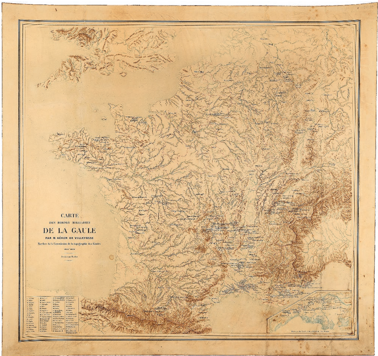
Fig. 1 : Carte des bornes milliaires, réalisée par Antoine-Marie Héron de Villefosse, mai 1878 (Saint-Germain-en-Laye, MAN, centre des archives, SN 154. © MAN/Valorie Gô).

La carte, intitulée Carte des bornes milliaires de la Gaule , présente, sous forme de points rouges accompagnés de leur localisation géographique (toponyme), l'emplacement des bornes milliaires connues en 1878, pour le territoire français, mais aussi pour les territoires allemand, belge et néerlandais. Chaque borne est accompagnée d'un chiffre qui renvoie à une légende située dans le coin inférieur gauche du document et donne la datation par règne de chaque monument. Dans le coin inférieur droit, un agrandissement de la bande littorale du Gard et des Bouches-du-Rhône permet la mise en évidence des bornes pour cette région. La carte inclut les délimitations administratives des départements