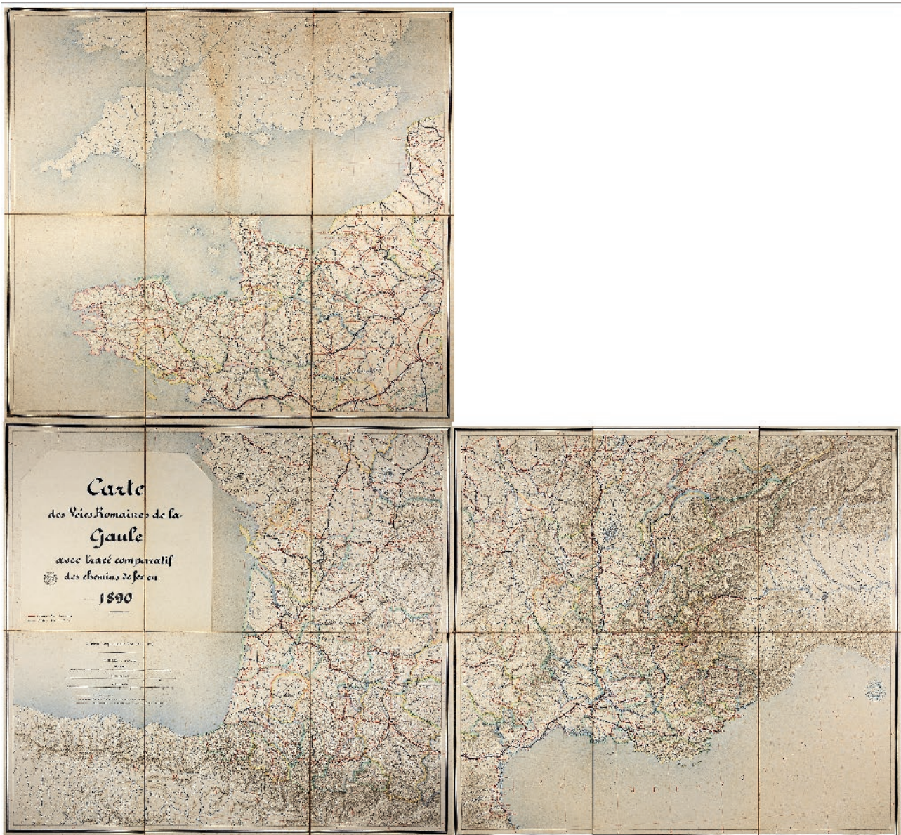
Fig. 6 : Carte des voies romaines de la Gaule avec tracé comparatif des chemins de fer, 1890 (seuls trois des quatre quarts de la carte sont conservés) (Saint-Germain-en-Laye, MAN, centre des archives, inv. BIB 8079.).

2 février 1880 qui arrête sa création, la perspective est clairement définie : « Cette Commission aura pour mission d'achever les travaux commencés par la Commission de la Topographie des Gaules : les cartes de la Gaule indépendante, de la Gaule soit sous la domination romaine, soit à l'époque franque et féodale, les cartes spéciales indiquant la position des monuments mégalithiques, les découvertes de monnaies gauloises, les bornes milliaires, les diverses couches ethniques qui ont contribué à la formation de la nationalité française. Elle devra aussi terminer le catalogue général des monnaies gauloises et donner, d'après les nombreux documents recueillis, une édition de la Notice des provinces et des cités de la Gaule . [...] Elle devra, en un mot, centraliser tout ce qui peut toucher