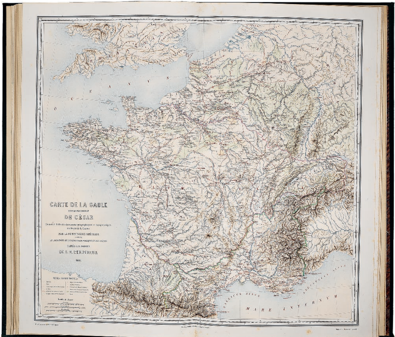
Fig. 2 : Carte de la Gaule sous le proconsulat de César, 1861, présentant les tracés des itinéraires principaux et des mesures de distances (Saint-Germain-en-Laye, MAN, centre des archives, inv. BIB 4233. © MAN/Valorie Gô).

un premier temps au général Casimir Creuly entré dans la Commission en 1859, puis à Pierre-Charles Robert à partir de 1873. L'enquête menée sur l'ensemble du territoire est orientée, dans un premier temps, dans cette perspective topographique. Ainsi, pour le territoire de Feurs, l'enquête, portée notamment par Creuly et par l'envoi d'estampages, semble se concentrer sur la localisation et la copie des bornes milliaires. C'est ainsi que, sur la trentaine d'inscriptions connues avant 1879, on ne compte que six inscriptions dont quatre bornes milliaires 24 parmi les copies ou estampages dans les fonds conservés au musée d'Archéologie nationale.