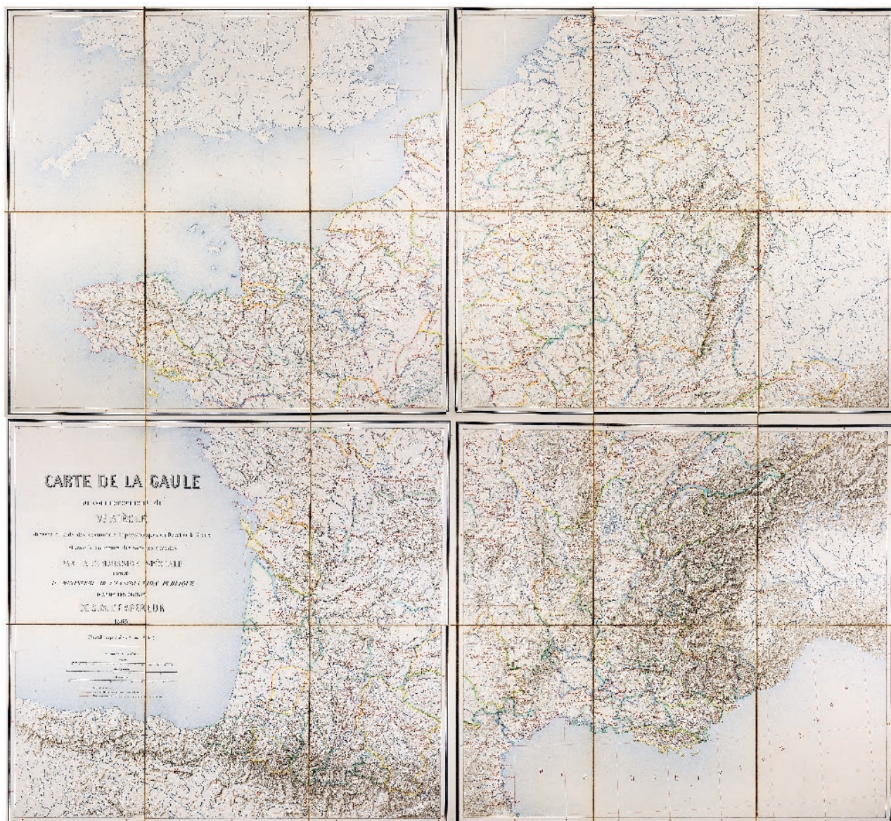
Fig. 4 : Carte de la Gaule au commencement du V e siècle (travail préparatoire : voies et cités), 1865, en quatre parties (Saint-Germain-en-Laye, MAN, centre des archives.).

reconstitution des systèmes de circulation s'inscrit dans une tendance plus large de la recherche qui s'établit au milieu du XIX e s. L'importance de la démarche archéologique dans ce domaine est soulignée par A. Bertrand dans son cours donné à l'École du Louvre : il s'agit de confronter « les documents écrits (cartes antiques ou itinéraires – bornes milliaires) » à la « reconnaissance matérielle » et dirait-on, archéologique, des vestiges des voies dont la topographie moderne peut encore rendre compte 30 . Cette perspective de recherche passe donc par un double mouvement que nous avons déjà constaté dans les travaux de la Commission et qui explique la production de la carte d'Héron de Villefosse dont il est question ici.