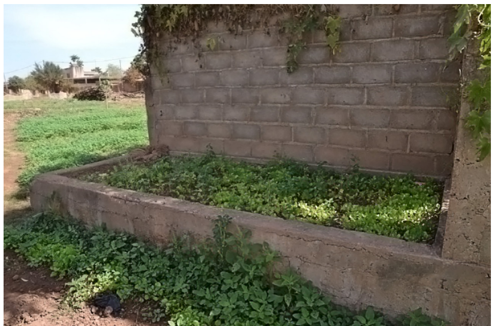
Figure 1: Mise en culture de la moindre surface disponible.