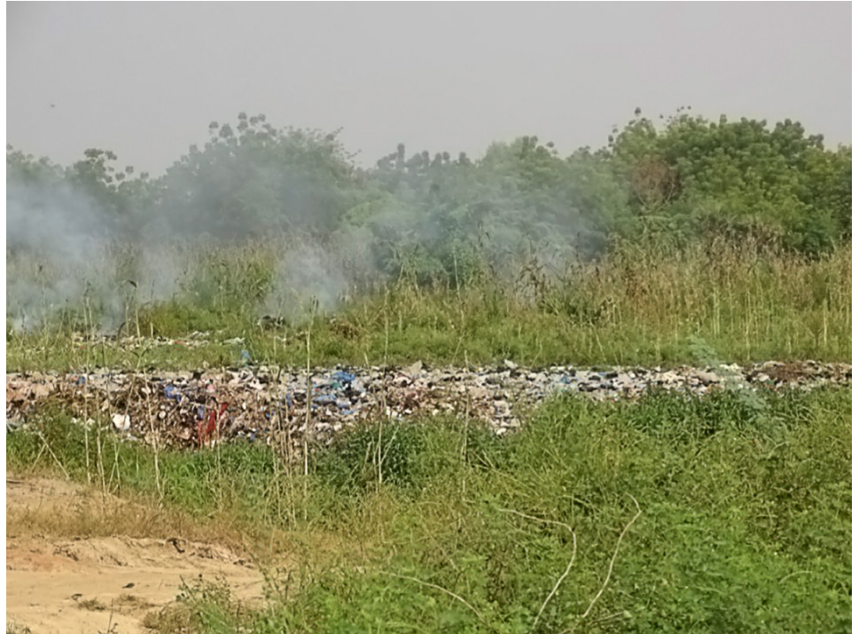
Figure 2: Des cultures pratiquées sur des décharges sauvages.

5 Moustier, P. et Danso, G., 2006, "Local Economic Development and Marketing of Urban Produced Food", dans Van Veenhuizen, R.(dir.), Cities Farming for the Future – Urban Agriculture for Green and Productive Cities , RUAF Foundation, IDRC and IIRR, 474 p.