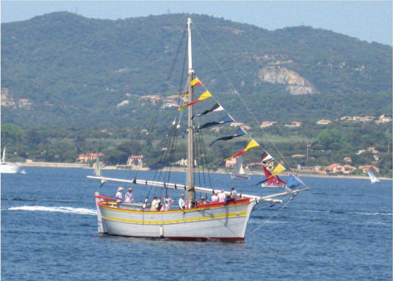
Tartane de tradition à Saint-Tropez.

(1678) voyait la marine royale en situation difficile puisqu'elle devait faire face simultanément aux forces hollandaises et espagnoles ; le recours à la guerre de course était donc bienvenu.