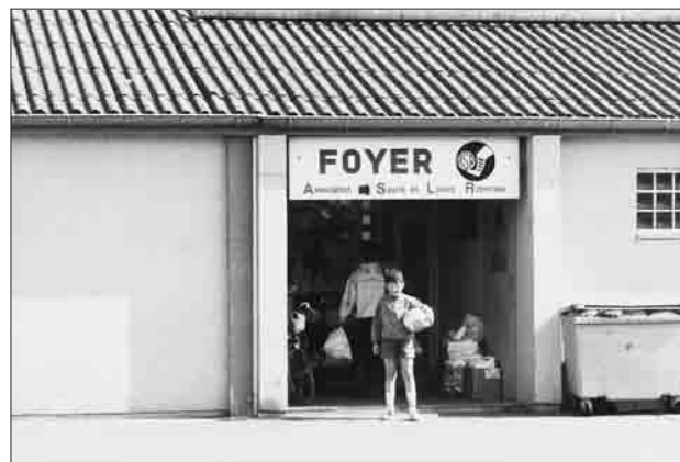
Des sièges d'associations modestes en communes périurbaines.

Dresser la liste exhaustive des associations dans une aire géographique aussi importante que la Communauté Urbaine de Strasbourg (27 communes réparties sur plus de 300 km 2 avec une population représentant 45 % de celle du Bas-Rhin) n'est pas une opération aisée. En effet, outre le fait qu'il n'existe aucune donnée statistique réalisée par les services de la Communauté Urbaine ou l'INSEE Alsace, les différents fichiers d'associations