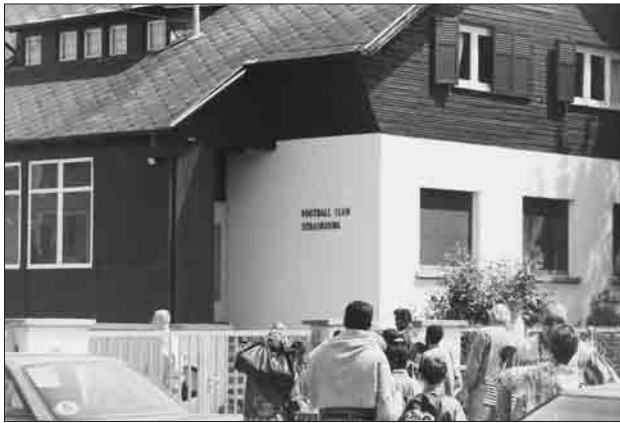
Le club sportif, un nouvel équipement collectif.

Les résultats de l'enquête qualitative auprès de l'échantillon d'associations nous révèlent quelques logiques de déplacement vers les clubs extérieurs. La majorité des adhérents non résidents sont issus d'une commune faisant partie de la même unité urbaine ou de la même agglomération multicommunale. C'est le cas