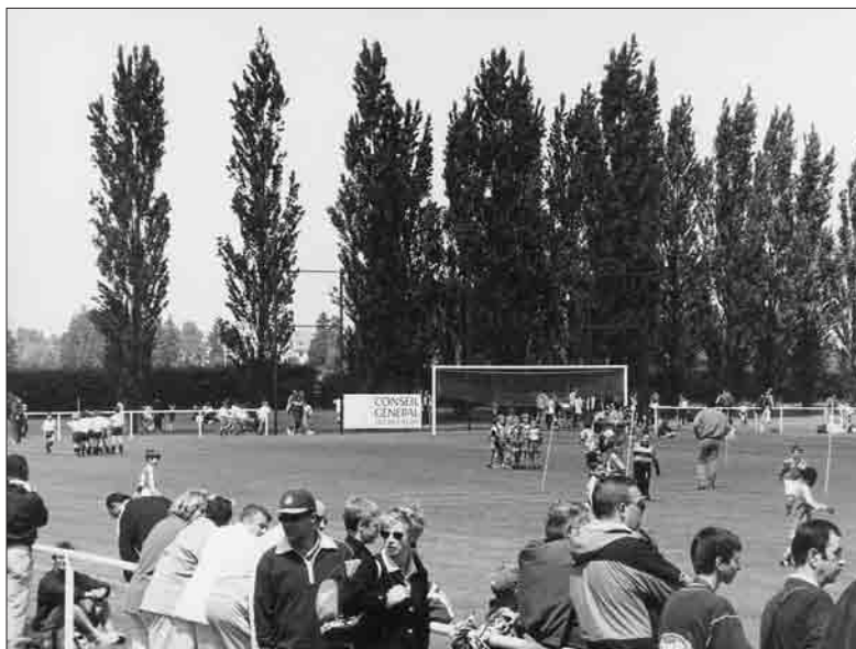
Au stade, les parents.

Les associations nécessitant un équipement spécialisé (et coûteux) et jouissant d'une bonne notoriété