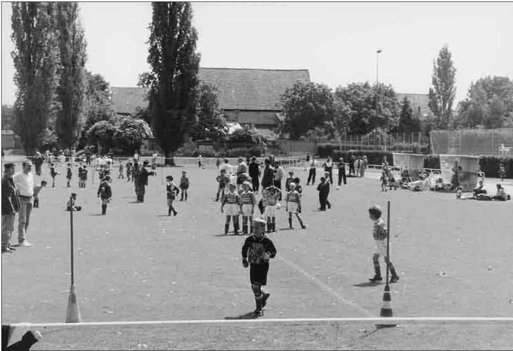
Jeunes et moins jeunes sur le terrain.

tenu les clubs de haut niveau proposant des sports plutôt « populaires » comme la lutte ou le football. Or, suite à la baisse du nombre d'ouvriers dans les années 70 26 et face à la demande de nouveaux usagers (cadres, employés et professions intermédiaires), elle a dû diversifier ses efforts afin de répondre aux besoins d'associations de plus en plus nombreuses et variées.