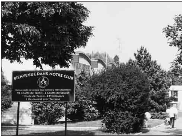
Club de tennis et de loisirs dans la verdure.

strasbourgeoise qui sont mentionnées au moins une fois par an dans la presse locale 2 , enquêtes sociologiques qualitatives sur les propriétés des associations sportives et de leurs membres 3 ).