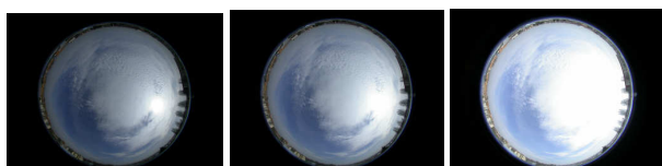
Figure 2 : Dynamique d'un ciel de printemps

Dans une scène réelle, si il n'y a pas éclairage artificiel, la source de lumière unique est le soleil. Si l'on cherche à résoudre l'équation du rendu 1 à cette échelle il faut considérer la diffusion de la lumière dans l'atmosphère. Le calcul des inter-réflexions en milieu participatif (ciel nuageux par exemple) est un calcul complexe et qui ne peut rendre compte de l'état réel instantané de la luminance provenant du ciel. D'autre part l'origine de la participation du ciel à l'équilibre lumineux d'une scène est suffisamment éloigné pour; Un, considérer que les inter-réflexions scène locale/ciel sont nulles. Deux, que l'éclairage direct d'un objet de la scène ne dépend pas de la position de cet objet dans l'espace local. Considérant cela on peut estimer que la voûte du ciel est une source lumineuse dans son ensemble.