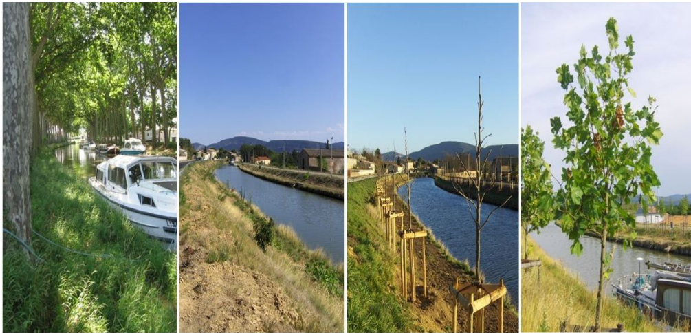
Figure 6 : Un nouveau paysage pour l'écluse de Trèbes, 2008, 2010, 2011, 2013

de l'alignement des arbres, définir des sites remarquables afin d'y replanter le vallis clausa (le Platanor résistant au chancre – espèce hybride) et diversifier des essences venant notamment d'Amérique. Dans la vallée de l'Aude où le canal serpente de Carcassonne à Homps, le chancre se déclare en une quinzaine d'endroits. Carcassonne est pour l'heure épargnée, mais le parasite est à ses portes puisqu'il sévit un peu au-dessus de l'écluse du Fresquel et celle de Trèbes, c'est-à-dire à une halte très prisée juste avant Carcassonne.