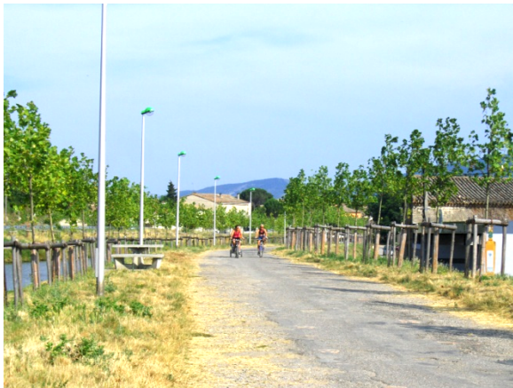
Figure n°8 : VTT et nécessaire de camping pour une pratique récréative (2012, VV Trèbes-Marseillette)

39 Des semi-marathons (Narbonne, Lourdes-Tarbes, Bagnères-Tarbes) peuvent aussi emprunter une partie du canal du Midi ou du trajet du Tour de France en longeant le canal pour profiter du paysage typique 2008/2013. Clubs sportifs et associations sont nombreux pour revendiquer une partie du parcours comme lieu de sports au contact de la nature. Cette voie verte commence au cœur de Toulouse, à l'écluse Bayard, en face de la gare Matabiau et permet de sortir de la ville en toute sécurité, même si les passages sous les premiers ponts sont étroits. Au port fluvial (port Saint-Sauveur), le quai a été élargi en 2006 pour justement rétablir la continuité. À partir du pont des Demoiselles, on retrouve la configuration du canal, avec une piste en site propre réalisée sur le talus, sous les grands platanes prodiguant de l'ombre. Réalisée en bitume lisse et régulièrement entretenue, cette voie verte de 3 m de large est dite roulante et praticable pour les rollers. Depuis 2006, les tronçons refaits tous les ans sont réalisés en grave émulsion à froid, type d'enrobé de couleur claire s'intégrant mieux au paysage.