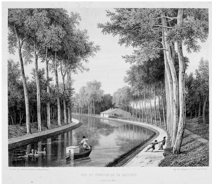
Figure 4 : Vue du contour de la Redorte, un cadre agréable à la navigation et à la contemplation, 1820. Archives du canal du Midi, 258-74

Source : Archives du canal du Midi, 260-03 VNF©, 2008