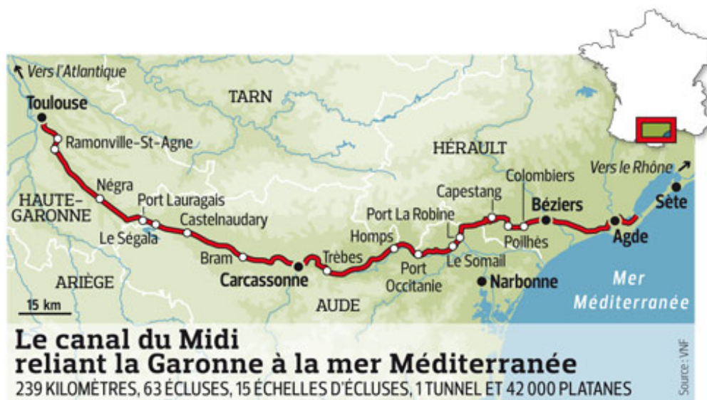
Figure 1 : Trajet du canal du Midi