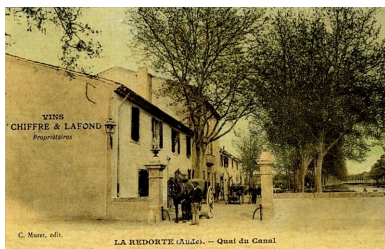
Figure 7 : Halte nautique de Port la Fabrique, La Redorte, 1919/ 2012