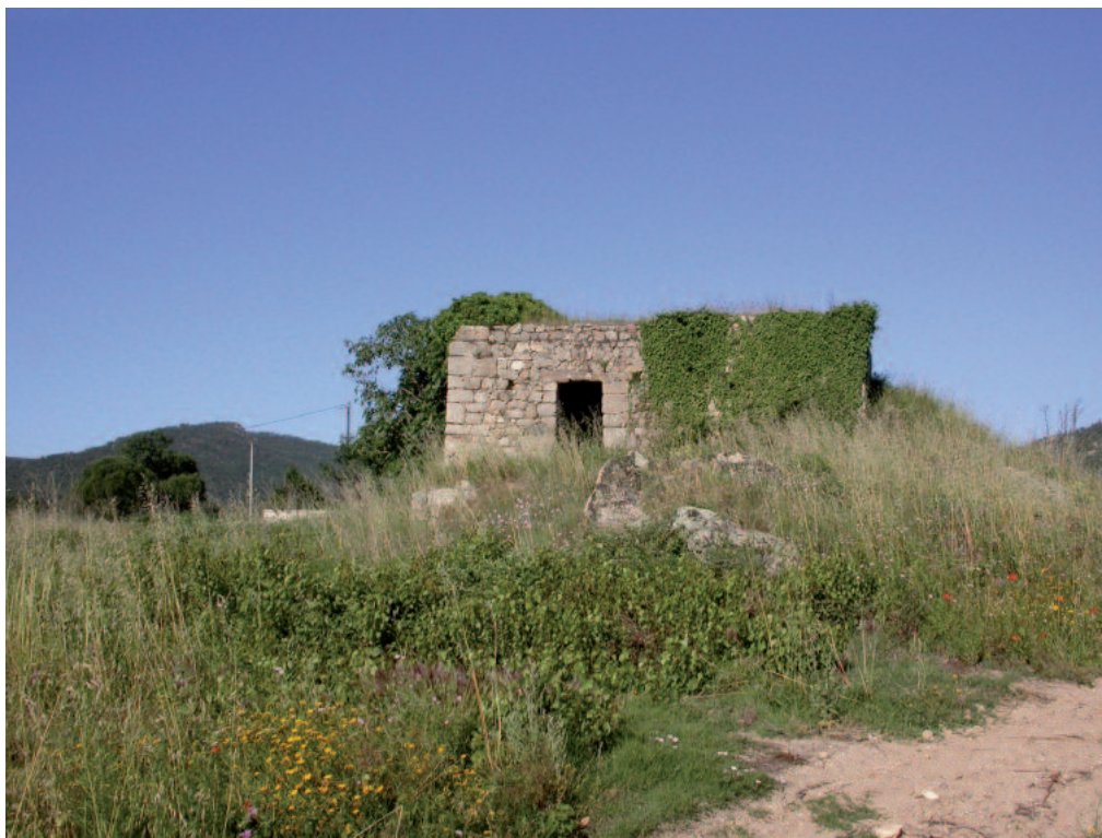
Photos 1, ci-contre. Ce qui reste de la tour du Plan.