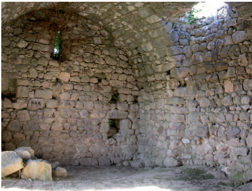
Photos 3 et 3. Salle du rez-de-chaussée de la tour, ses fenêtres à ébrasement et ses placards muraux.