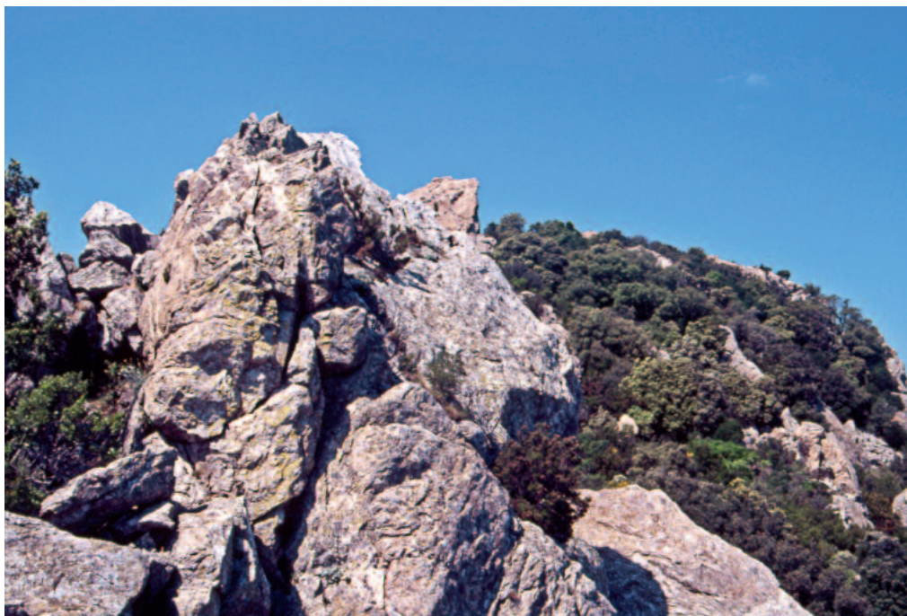
La montagne San-Peïre.

L'église est souvent l'élément le plus durable d'un habitat disparu. J'ai constaté ce fait en nombre d'autres points du département, où le vocable et parfois même l'édifice cultuel ont survécu jusqu'à nos jours dans les ruines d'un village déserté 22 . Ici encore l'ancienne paroisse nous fournit un indice. L'église de la Bastide de Miramas, siège d'un prieuré, apparaît dans le compte des décimes (imposition levée sur les établissements religieux) perçues dans le diocèse de Fréjus en 1274 23 et sa dédicace à saint Pierre est connue par la sentence arbitrale du 24 novembre 1292 qui partagea entre le prieur et l'abbé du Thoronet les dîmes des produits du ressort paroissial 24 . Plusieurs documents ultérieurs confirment le vocable et le statut de l'église de la Bastide de Miramas : la transaction de 1310 déjà citée appelle le village castrum Sancti Petri de Miramars , un acte de 1337 exempté de procuration (taxe levée par l'évêque lors de ses tournées de visites pastorales) l'abbé du Thoronet pour l'église Saint-Pierre 25 . Il existe bien, à la sortie sud du village du Plan-de-la-Tour, une chapelle ruinée dédiée au prince des apôtres, mais cette petite construction du XVII e siècle ne peut évidemment correspondre à ce que nous cherchons. En levant les yeux dans la même direction, nous voyons en revanche la montagne qui borne l'horizon méridional et qui porte toujours le nom de San-Peïre : là était la Bastide de Miramas.