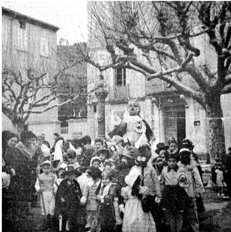
Février 1966 : sa Majesté Carnaval marchant au supplice devant la place de la Mairie. à la Garde-Freinet ( Bulletin gardois , 9 juillet 1966).