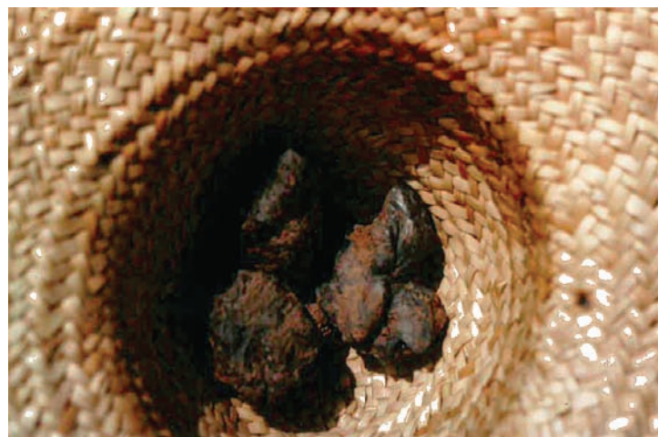
Fig. 3 Pierres de limonite riches en oxydes de fer

influence de la composition chimique de l'eau sur les propriétés rhéologiques, mécaniques et de sensibilité à l'eau des matériaux stabilisés. Ces pistes de réflexion peuvent être élargies à d'autres polymères que l'amidon anionique, comme l'alginate, molécule naturellement chargée négativement présente dans la colle d'algue par exemple. Cela permet d'imaginer des méthodes spécifiques d'amélioration des recettes traditionnelles de stabilisation. Par exemple, dans le cas du mélange d'une terre ne contenant pas d'oxydes de fer avec un biopolymère chargé négativement à pH basique, les argiles et le biopolymère seraient dispersées pendant la mise en œuvre favorisant une meilleure cohésion du liant sec (Moevus et al., 2015). Après séchage, l'adhésion et la floculation entre molécules et argiles pourraient être provoquées par immersion de l'échantillon (ou imprégnation d'un enduit) dans une solution de sel multivalent ( \text{CaCl}_2 , solution de métal trivalent, etc.) : la cohésion du matériau et son insensibilité à l'eau serait sans doute encore améliorés.