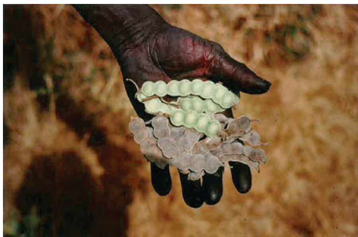
Fig. 2 Cosses d'acacia riches en tanins, photo : Hugo Houben/CRAterre-ENSAG