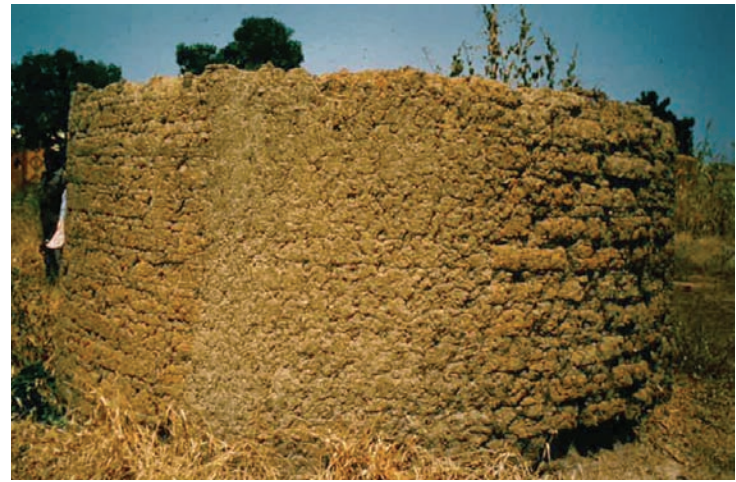
Fig. 6 Au centre, l'enduit terre/tanin/fer a résisté pendant 5 ans à la pluie

les enduits en terre directement exposés aux intempéries pendant toutes ces années (fig. 6). L'enduit stabilisé à l'aide des cosses d'acacia et les pierres de limonites est toujours là (au centre), tandis que les autres enduits ont disparu (terre et jus de banane à droite), laissant les briques de terre apparentes et soumises à l'érosion.