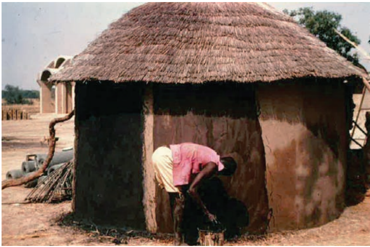
Fig. 5 À gauche, enduit noir foncé terre/cosses d'acacia (tanin)/limonite (fer)