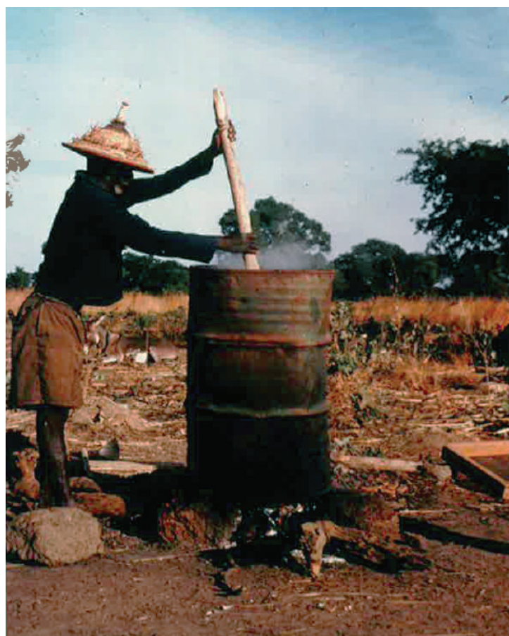
Fig. 4 Préparation du liquide noir : eau, cosses d'acacia et pierres de limonite, photo : Hugo Houben/CRAterre-ENSAG

Cette couleur noire est caractéristique de la formation de tannate de fer : elle indique que les molécules de tanin ont réagi avec du fer ( \text{Fe}^{2+} ou \text{Fe}^{3+} ) issu des pierres de limonites et passées en solution. Neuf ans plus tard, Thierry Joffroy revient sur le site d'observation de Hugo Houben. Le toit de la case a disparu depuis 5 ans, laissant