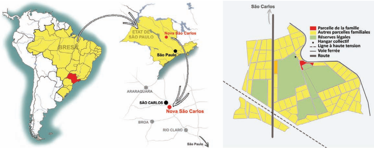
Fig.1 Localisation de la Communauté Nova São Carlos, de l'échelle nationale à l'échelle locale