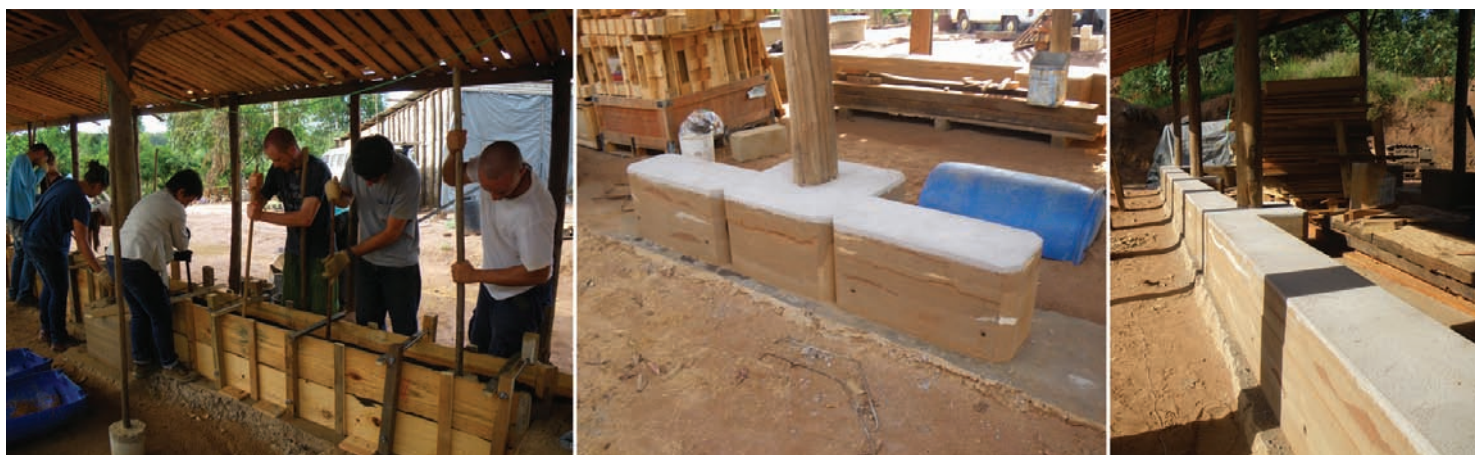
Fig.4 Activités de construction de la base des murs en pisé stabilisé

nels et au grand public. Il a permis aux participants de s'immerger dans le développement des technologies projetées via la manipulation et la transformation des matériaux naturels et de récupération disponibles localement. Les principales techniques employées furent le pisé stabilisé pour la base des murs, des panneaux de couverture préfabriqués en palettes et des panneaux de murs en palettes remplis de terre en vrac et enduits de terre, côté intérieur.