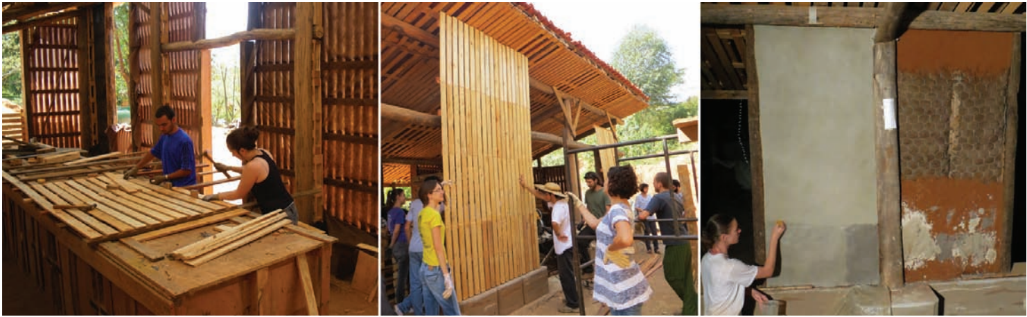
Fig.5 Construction des murs en palettes avec remplissage et enduits de finition en terre