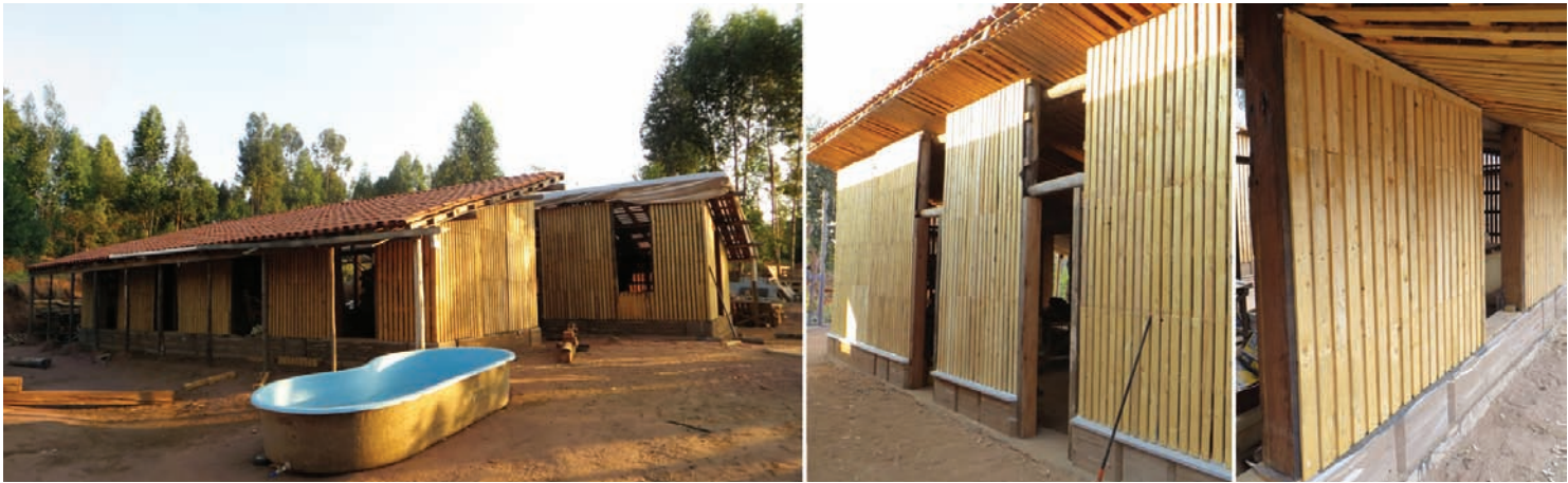
Fig.6 Vues générales de la maison Suindara à la fin du Chantier-École

et de sa répercussion sur la parcelle familiale, sont autant de paramètres non contrôlables mais avec un fort potentiel de répercussion sur la viabilité et la pérennité du projet.