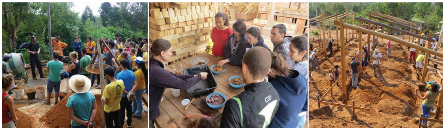
Fig.3 Activités théoriques réalisées simultanément aux activités pratiques