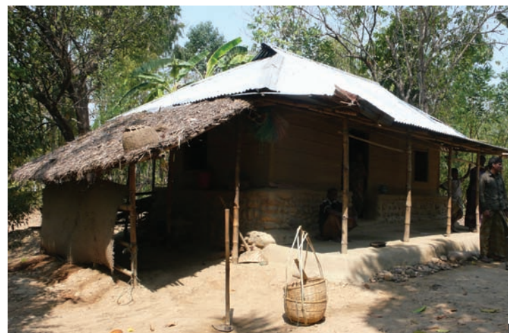
Fig. 7 Prototype habitat avec une base en galets

Sur certains sites de la région de Chittagong, la mise en place de notre approche a mis en évidence que plusieurs communautés vivaient ensemble dans les mêmes villages. En lien avec leurs cultures, ces communautés ont développé des modèles architecturaux aux caractéristiques très différentes. Fort de ce constat, le projet a développé