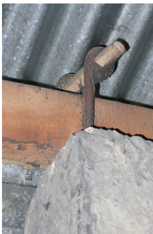
Fig. 3 connexions pour un démontage rapide

Le kit méthodologique comprend une partie à l'attention des responsables de programmes et de projets de terrain. L'objectif est de leur permettre d'appréhender les besoins en temps, en ressources humaines et matérielles, nécessaires pour mettre en place les activités d'analyse de terrain.