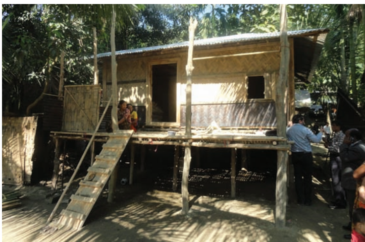
Fig. 5 Habitat groupe 1