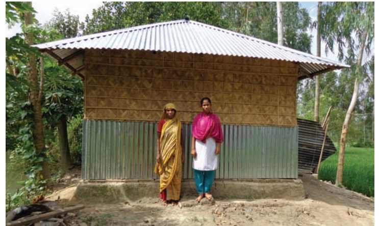
Fig. 6 Habitat groupe 2

lorsque les digues menacent de rompre. Les villages enquêtés ont déjà été relocalisés plusieurs fois. Et à chaque fois, pour des raisons d'accès à la terre et de proximité avec les sites où ces populations ont leurs activités économiques (le fleuve), ces villages se réinstallent sur la berge du fleuve, en zone à risque.