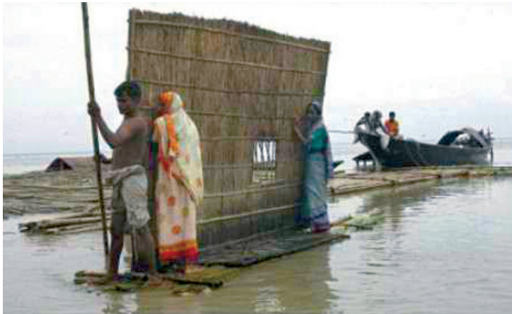
Fig. 4 Transport de l'habitation

Cette partie comporte aussi des éléments permettant de développer les grandes lignes stratégiques du projet en s'appuyant sur les résultats obtenus lors de l'analyse des forces et faiblesses des cultures constructives existantes dans un territoire donné.