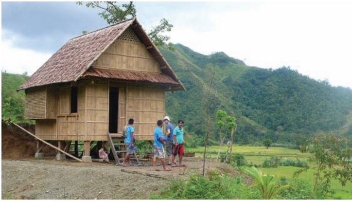
Fig. 8 Projet de reconstruction post-Haiyan

deux modèles d'habitat d'urgence (fig. 5 – 6), chacun pouvant évoluer vers l'habitat définitif souhaité par l'une ou l'autre des communautés concernées. En cas de crises, ces deux modèles seront proposés à la population, et les personnes affectées pourront choisir le modèle qui leur convient le mieux.