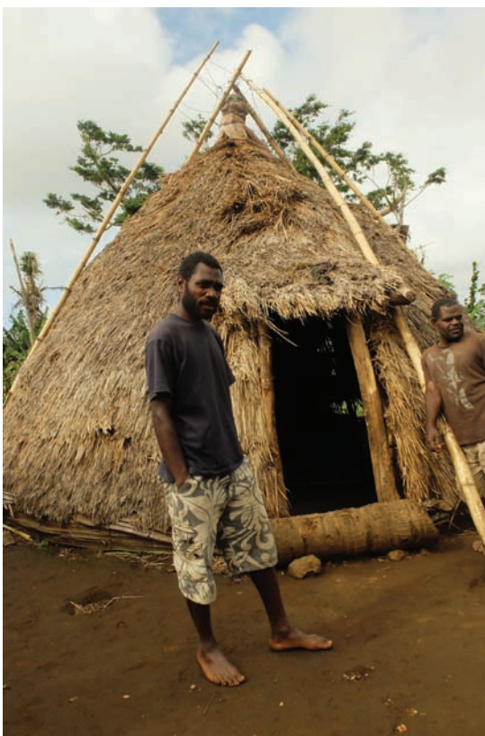
Fig.9 Nimatkiskis. Abri cyclonique local

Le typhon Haiyan a détruit les toitures ainsi que l'Ambulang, arbre dont la feuille sert à la confection des éléments de toiture. La mise en place de la méthodologie proposée a entériné le fait que la population locale ne pouvait pas, dans l'immédiat, réparer les toitures abîmées avec les ressources disponibles localement, mais qu'elle ne pourrait pas non plus, dans l'avenir à moyen terme, disposer des moyens pour entretenir ou réparer des toitures construites avec d'autres matériaux que ceux disponibles localement. Afin de préserver les savoirs liés à l'Ambulang (qui sera de nouveau disponible localement environs trois ans après le typhon), le projet a privilégié l'importation de ce