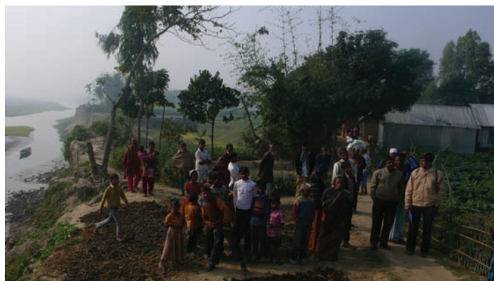
Fig. 2 Habitat à Dinājpur