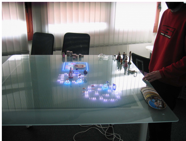
Figure 1 : la table Tangisense ici dans une configuration de création musicale. Des zones lumineuses (leds dans la table) sont activées par des « personnages » tangibles. Un cube en premier plan représente un instrument de musique, un CD en deuxième plan représente un base de données de sons que l'on peut « déverser » sur la table. La table se présente comme une matrice carrée de « pixels » magnétiques (40 x 40).

Avec la technologie employée, il est possible de reconnaître des objets superposés les uns sur les autres ou leur position dans l'espace de travail. On peut donc détecter qu'un objet est caché sous un autre plus grand que lui, déterminer sa position ou son contenu si nécessaire grâce au stockage d'informations dans les mémoires RFID. Le temps de réponse obtenu grâce à la communication Ethernet et la lecture RFID offre des performances de vitesse compatibles avec la vitesse d'un geste humain. Le déplacement simultané d'un pavé de 64 étiquettes RFID est détecté en moins d'une seconde, impliquant une détection possible de plus de 60 objets en mouvement à la fois. La capacité à faire cohabiter des antennes très proches sans interaction est également nouvelle. Enfin, les algorithmes enfouis dans les dalles offrent des stratégies de recherche, d'agrégation et d'échange entre les étiquettes RFID permettant des temps de traitement en temps réel.