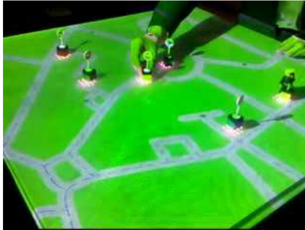
Figure 2 : la table Tangisense utilisée dans une application de simulation de trafic routier. On y distingue les objets tangibles (panneaux routiers par exemple) et les objets virtuels vidéo-projetés (routes par exemple).

Plusieurs applications ont été programmées pour la table. Outre une simulation pour le trafic routier (Fig. 2) deux applications ont été orientées vers la production musicale : (a) Music Automaton : il s'agit d'une activité permettant d'interagir avec des instruments (tambourin, batterie, klaxon, etc.). Pour cela suffit au préalable de poser sur la table un personnage correspondant à un rythme particulier, lorsqu'il est posé, des leds vont s'allumer sur la table. Lorsqu'un instrument est posé au même moment que la led s'illumine alors on entend le son correspondant : tambourin, batterie ou autre. Dans cette application, le rythme a été programmé en faisant référence au jeu de la vie de Gardner et métaphoriquement aux lois génétiques des cellules (une led = une cellule). La programmation a ainsi été faite en simulant la vie des cellules. (b) CD Judbox : ici le principe est similaire au précédent, la différence est qu'il ne s'agit plus d'instruments mais de textures sonores. L'application consiste à déposer un CD audio sur la table et on peut alors en extraire différentes textures sonores puis on peut récupérer ces dernières grâce à des petits cubes transparents et les rejouer à volonté. Comme indiqué précédemment il faut au préalable déposer un personnage pour le rythme afin que les leds s'allument et que le son soit joué en conséquence.