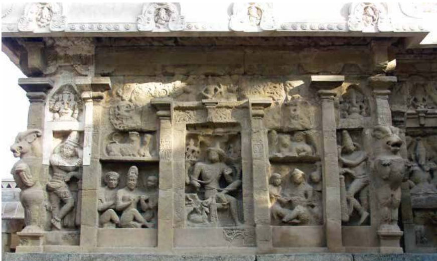
Fig. 4. Kanchipuram, temple d'Iṛavāttāṇeśvara, VIII e -IX e siècle, vue de l'est.

Si l'on examine les corpus liés d'inscriptions et de monuments du royaume des Pallava tardifs (VII e -IX e siècles), l'on constate donc, pour certaines pratiques, l'antériorité du royal sur le local et l'adoption et adaptation du modèle royal par les élites locales. L'architecture durable, en pierre, d'abord sous la forme de grottes excavées et ensuite sous la forme de temples construits, est l'œuvre de commanditaires royaux, pour autant que ces derniers soient connus. Il s'agit donc d'une invention royale. Elle s'accompagne de l'usage d'afficher, via l'épigraphie, l'identité du commanditaire. Cette pratique de l'architecture durable et de l'affichage public des commanditaires et surtout des donateurs, est reprise au niveau local, quand bien même elle se distingue par l'emploi d'une pierre plus dure et une épigraphie en tamoul plutôt qu'en