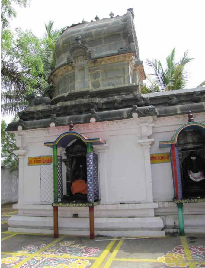
Fig. 5. Tiruttani, temple de Virattāneśvara, IX e siècle, vue du sud (cliché Valérie Gillet, 2013).

sanskrit. Le local a aussi ses usages propres (pierre de héros). Les donateurs non royaux – souvent des propriétaires terriens ou plus précisément des ayants droit sur la terre et ses récoltes – sont, tout comme les rois, friands de gloire et de prestige. Une pratique royale d’affichage est ainsi appropriée au niveau local, où elle est adaptée, accommodée à des usages propres et nouveaux. Un autre cas illustratif est celui des chartes sur cuivre sous les Cōḷa, comme on le verra ci-dessous.