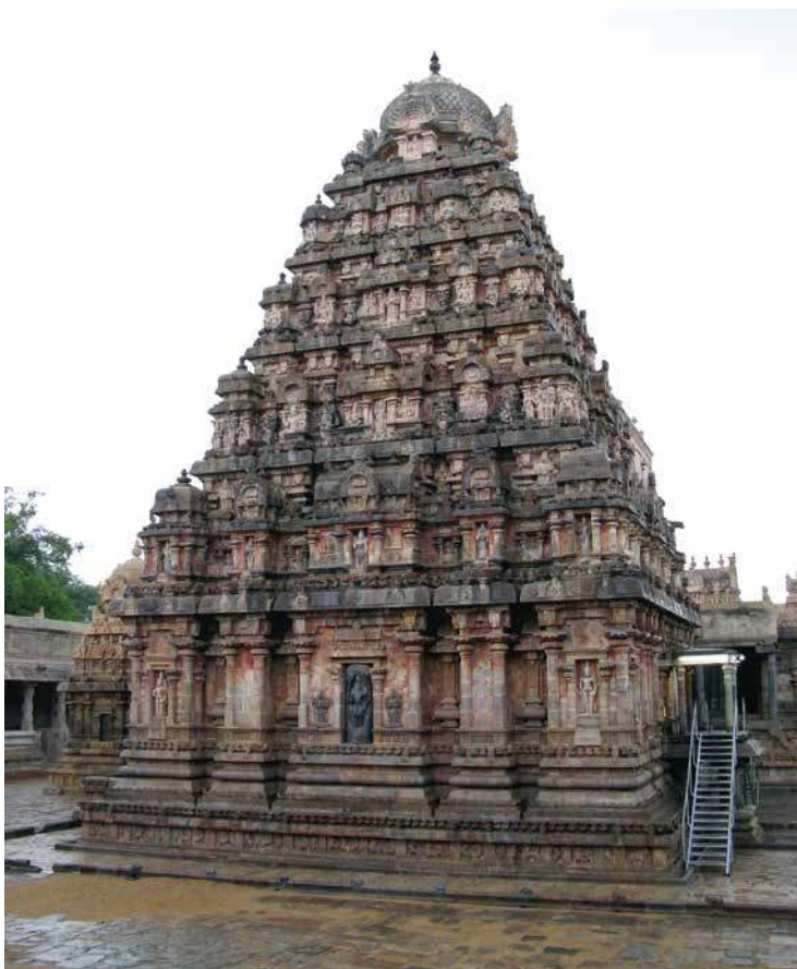
Fig. 7. Darasuram, temple d'Airāvateśvara, seconde moitié du XII e siècle, vue de l'ouest.

Dans le même temps, l'émission d'inscriptions sur cuivre, initialement une prérogative royale, est adoptée localement, ce qui illustre une fois de plus le statut de modèle du royal. Ainsi, les plaques de Tirukkaḷar sont émises par une autorité de temple et enregistrent des transactions (inventaire des biens du dieu, en terre, en bijoux) concernant le temple de Tirukkaḷar (Francis à paraître b). Ce ne sont donc pas des chartes stricto sensu , mais le support, durable, est adopté. En outre, ces inscriptions locales sur plaques