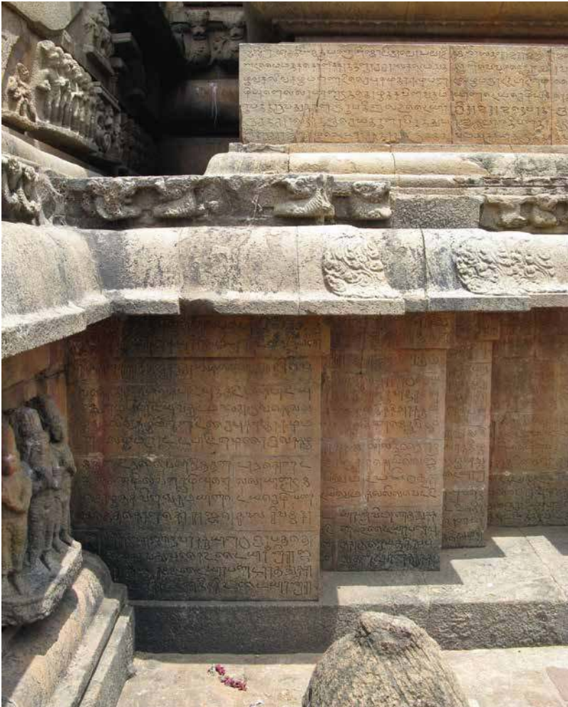
Fig. 9. Tanjore, temple de Rājarājeśvara, soubassement du vimāna (en-haut : l'inscription programmatique), début du XI e s., vue du nord.

palme dans les localités (Francis 2018 : 405). Ainsi transmis et diffusé, le texte d'une meykkīrtti devenait accessible à divers acteurs sur le terrain local. La diffusion massive de ces éloges royaux ne fut donc pas le seul fait du patronage royal, telle l'inscription programmatique de Rājarāja Ier (fig. 8-9) au temple de Tanjore (sorte de version finale de sa meykkīrtti ), ou de l'administration royale. Le texte d'une meykkīrtti , exactement comme dans le cas de l'inscription du Mucukuṇḍeśvara, fut approprié et utilisé en dehors de la communication officielle, par des acteurs locaux. Comment et pourquoi ?