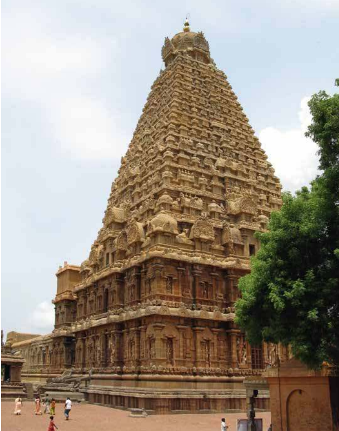
Fig. 6. Tanjore, temple de Rājarājeśvara (aujourd'hui Brhadiśvara), début du XI e siècle, vue du nord-ouest.

En ce qui concerne la production épigraphique de la période cōla , on peut poser le même constat de changement et continuité par rapport à la période pallava . Continuité, d'une part, en ce qui concerne les chartes royales sur cuivre : celles des Cōla suivent clairement un modèle établi par les Pallava (bilingues, sanskrit et tamoul, et diglossiques). Si différence il y a, elle est