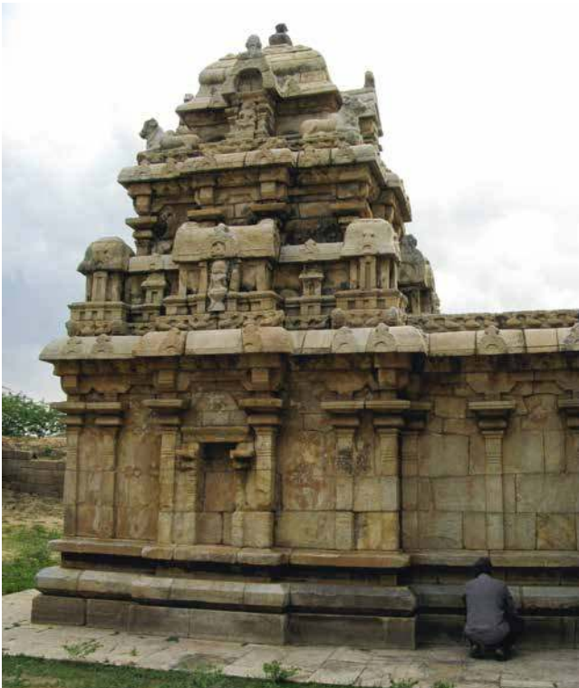
Fig. 2. Koṭūmpāḷur, Mucukuṅḍeśvara, X e siècle, vimāna et ardhamāṇḍapa , vue du sud (cliché E. Francis, 2017).

Le contenu des trois dernières lignes ne fait pas non plus grand mystère. Même si nous n'avons pas de parallèles aussi exacts que pour l'éloge du roi, le corpus épigraphique tamoul de cette période abonde en donations