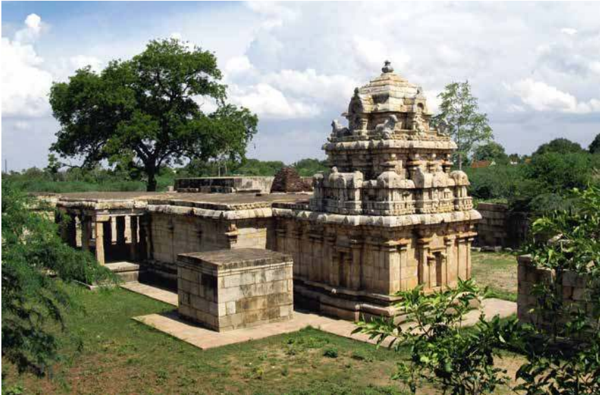
Fig. 1. Koṭumpālūr, Mucukuṇḍeśvara, X e siècle, vue du nord-ouest (cliché E. Francis, 2017).

Lignes 4-6 , à propos de la donation : « Pour le Mahādeva (Śiva) de Tirumutukunram (à) Koṭumpālūr, un barde (pāṇan 7 ) de ce village, Arumolideva Cāk{{kai}} alias Viḷuppēraiyaṅ Vikramakesarin ... prélevant la moitié du beurre/huile (ney), les sept chèvres qu'il a données, ... le kaḷaṅcu d'or qui provient