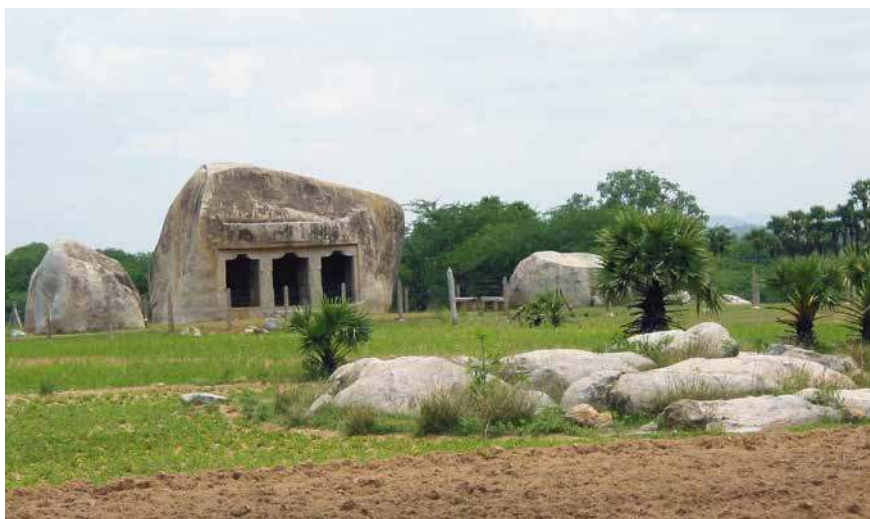
Fig. 3. Mahendravadi, grotte de Mahendravarman I er Pallava, début du VIII e siècle, vue de l'est.

Voici quelques exemples illustratifs de ces deux types de monuments dont j'ai parlé ailleurs. La grotte de Mahendravadi ( Makēntiravāṭi ) (fig. 3) est un exemple de fondation royale avec inscription (dédicace) en sanskrit.