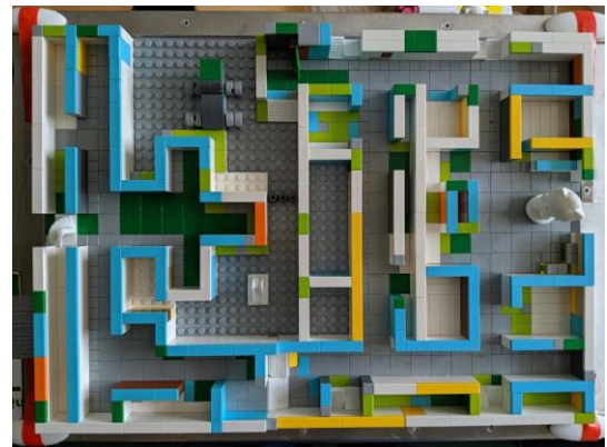
Figure 2: Photo du TangiSpace en Lego représentant le bâtiment exploré et le personnage manipulé (à droite)

TangiSpace est une application spécifique co-conçue avec une instructrice de locomotion. Elle intègre un plateau en Lego représentant un bâtiment et un pion représentant un personnage permettant de figurer la personne qui s'y déplace. La position du pion déclenche des retours sonores verbaux (par exemple, la voix d'une personne lorsque le pion entre dans l'espace représentant son bureau) ou non verbaux (par exemple le bruit de l'ascenseur). Ces sons ont été enregistrés lors de l'exploration réelle du bâtiment