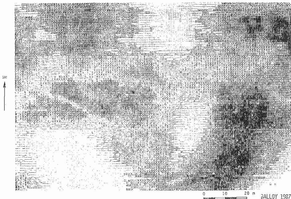
Figure 2 : Cartographie de la variation de la résistivité. Map of electrical resistivity.

La deuxième prospection montre les variations de la résistivité sur une parcelle expérimentale du CRG de Garchy pour un sol développé sur un plateau oxfordien (calcaire micritique à joints marneux). La prospection, beaucoup moins détaillée que la précédente a été réalisée en mesures manuelles sur un réseau à mailles de 10 m de côté (quadripôle Wenner a : 1 m ; profondeur maximale d'investigation de l'ordre de 0,75 m). La carte fait apparaître deux zones de fortes résistivités (en pointillé) séparées par une zone moins résistante (en hachures), le tout étant structuré grossièrement dans un axe nord-sud. Les sondages électriques réalisés sur ces zones ainsi que l'observation de la surface font apparaître que les fortes valeurs sont dues à l'ouest à une remontée du calcaire à proximité de la surface, à l'est à une augmentation du pourcentage de la fraction sableuse du sol plus épais à cet endroit (figure 3). Sur cette zone, les sondages électriques, réalisés par ailleurs, montrent que le toit du calcaire passe d'une profondeur d'un peu plus de 1 m à l'est, à 25 cm à l'ouest qui correspondent à l'épaisseur de la couche arable.