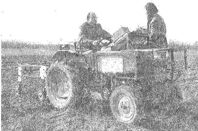
Figure 1 : Système Rateau. Rateau system.

Dans le système RATEAU développé au CRG Garchy, les électrodes sont remplacées par quatre roues, avec ou sans pointes, disposées en carré et entraînées par un tracteur. Les roues sont montées sur des bras articulés qui permettent de suivre les ondulations du terrain. Le résistivimètre utilisé est un RMCA3-Septa (licence CNRS-ANVAR) qui présente un temps de réponse très court, une bonne tolérance aux fortes résistances de contact, jusqu'à 1,2 \text{ M}\Omega et une très large gamme de mesures (de quelques ohms à 20 \text{ k}\Omega ). Le rythme d'acquisition, commandé par un codeur est actuellement d'une mesure tous les 10 cm. Ce suréchantillonnage permet, par le biais de traitements numériques ultérieurs, d'assurer des résultats cohérents, même dans le cas de mesures très perturbées (fig. 1).