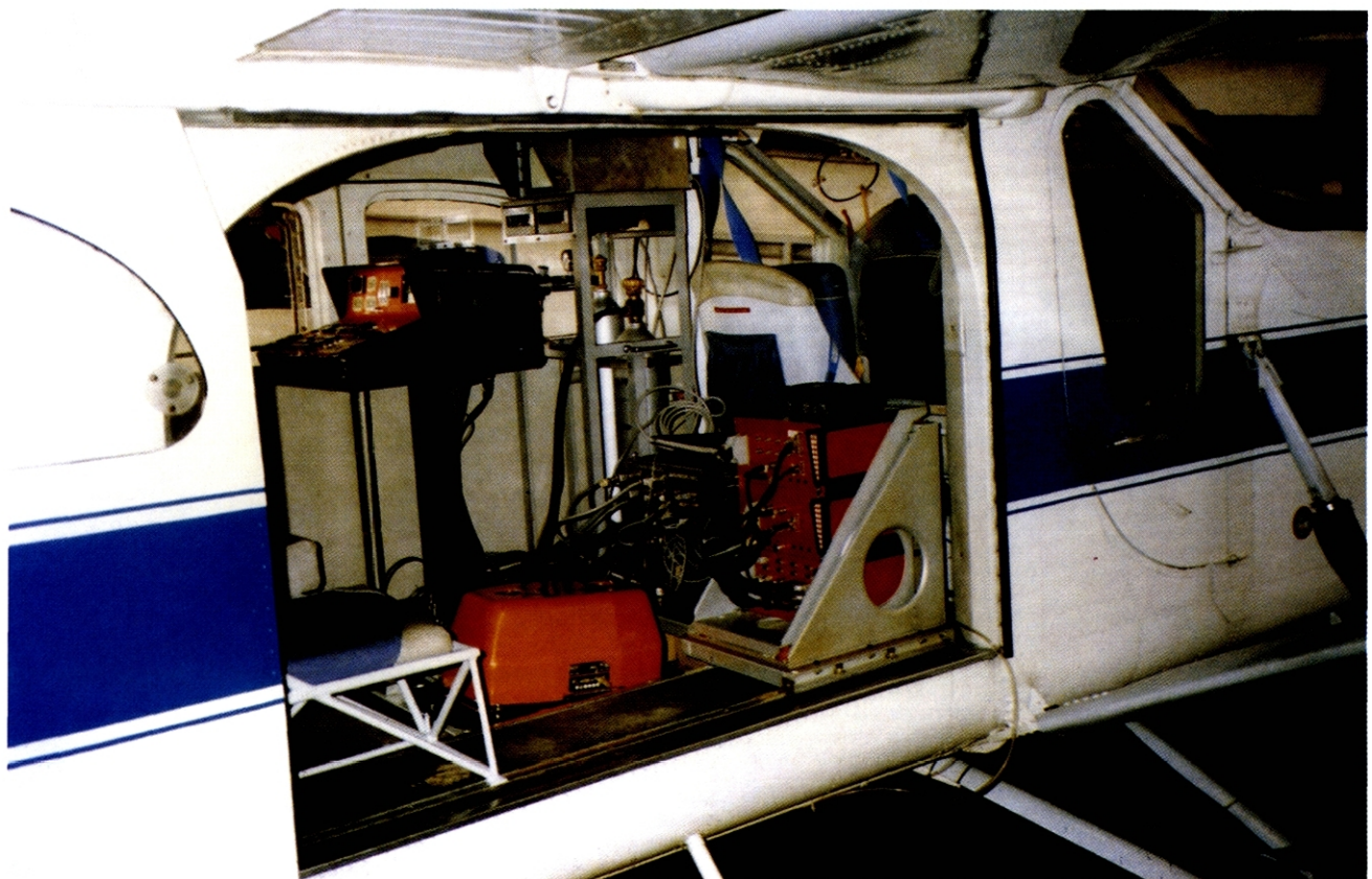
Fig. 2 : l'avion Pilatus et le matériel embarqué. Pilatus aircraft and on board apparatus.