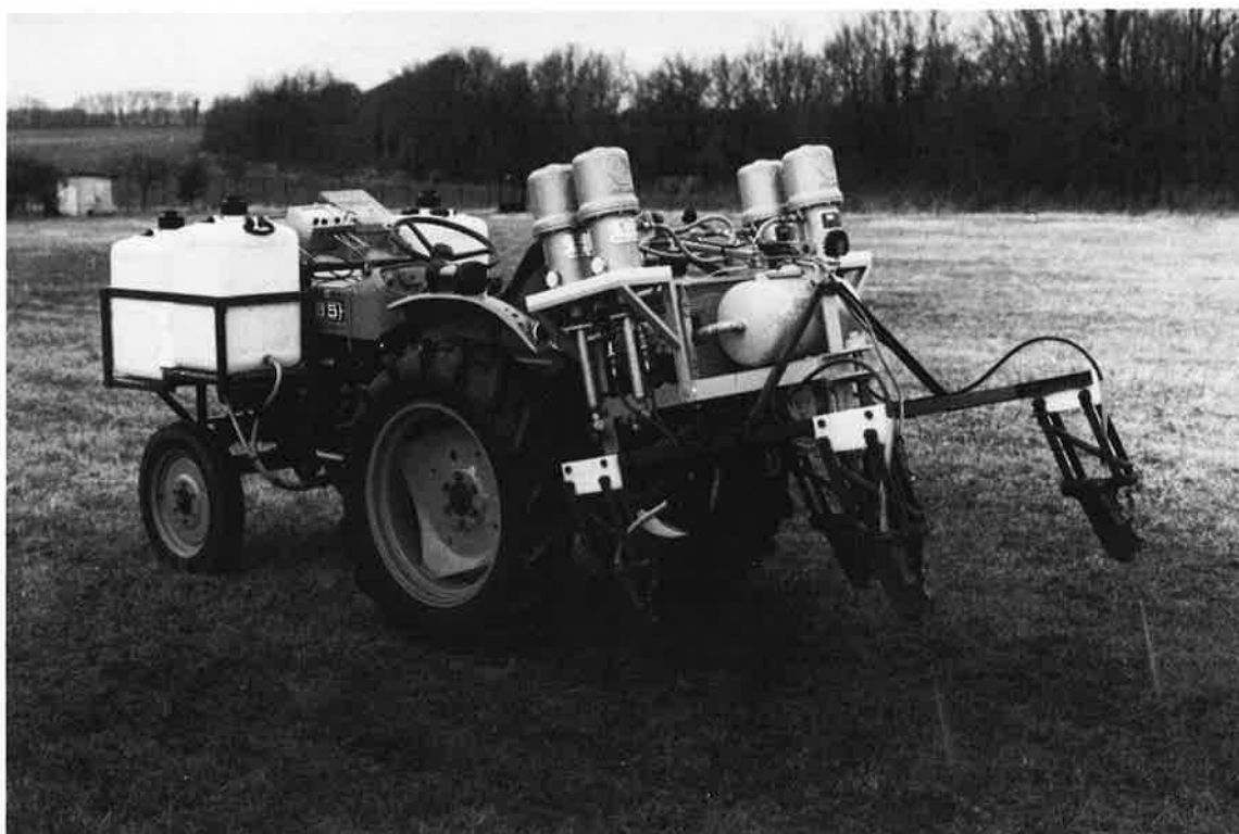
Fig. 1 - RATEAU à jets liquides en position relevée.

Chaque jet est produit par pression de 150 bars sur un liquide conducteur (eau et nitrate d'ammonium) à travers un ajustage très fin (0,2 mm) maintenu à 1 cm au-dessus du sol. Il constitue une électrode indépendante, isolée électriquement des trois autres, dont le contact avec le sol est excellent en assurant, éventuellement, par ses propriétés mécaniques, une découpe de la végétation superficielle. Cette réalisation du Centre de Recherches Géophysiques a montré son efficacité: elle convient bien à l'exploration des terrains à surface de contact défavorable. Toutefois, la réalisation industrielle de cet équipement, assez complexe, aurait été trop coûteuse. Il a paru plus opportun de perfectionner d'abord l'appareil de mesure pour l'utilisation avec des quadripôles plus simples. La seconde version du RATEAU est donc purement mécanique et plus facile à réaliser (fig. 2). Elle comprend: