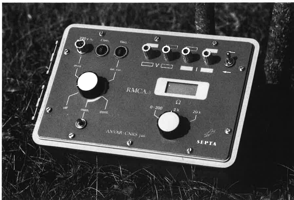
Fig. 3 - Face avant du résistivimètre RMCA-3.

acceptés entre électrodes et sol. Elles ont permis de réduire le quadripôle à de simples disques roulants sur herbe presque sèche (site de Minot) ou sur terre nue et d'obtenir, grâce à une version encore plus récente de roues à pointes, d'excellents résultats sur des sols relativement durs et secs (sites d'Alba et du Mont Beuvray).