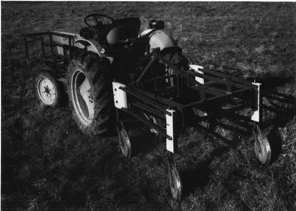
Fig. 2 - Porte-électrodes RATEAU à roues.