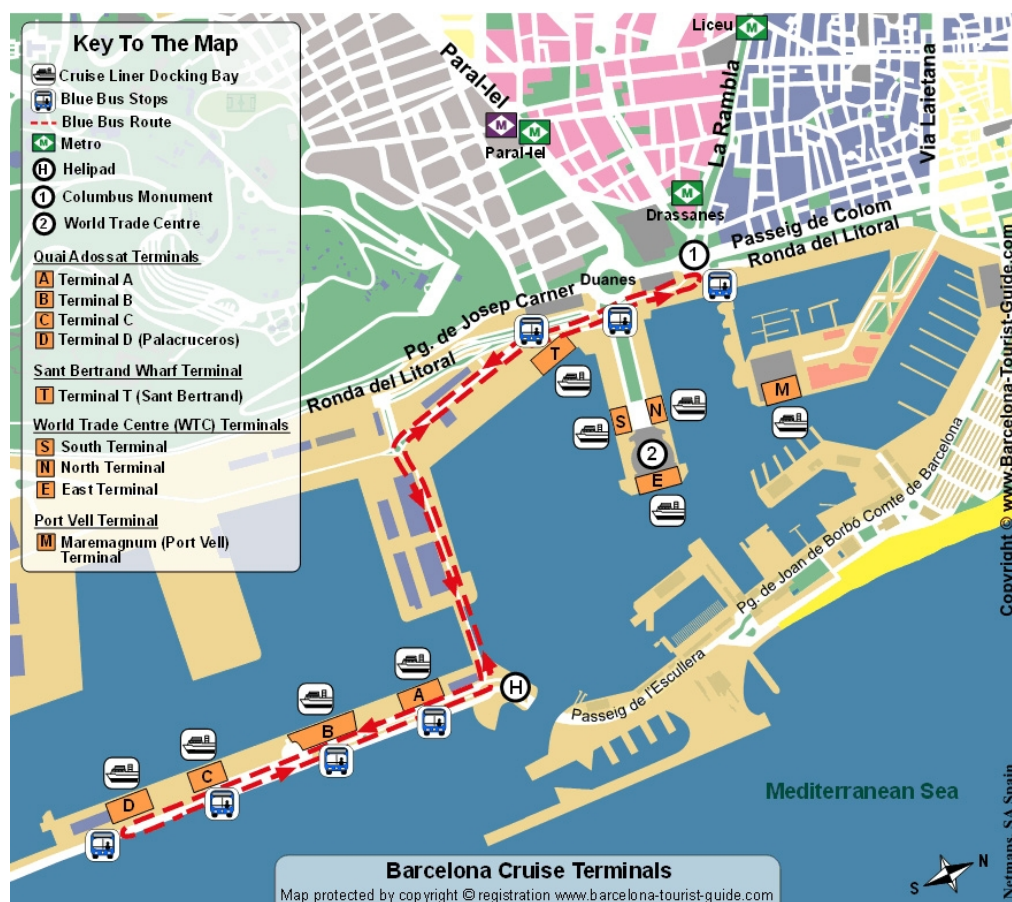
Photographie 3 : Les quais de croisières de Barcelone, 2010, Port de Barcelone