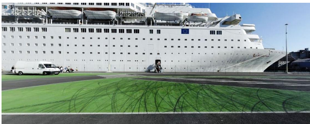
Avec l'aimable autorisation du Port de Barcelone, 2011