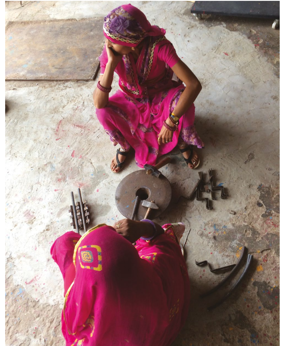
Photo 2 : Femmes travaillant le fer, Barefoot College, Tilonia, Rajasthan, Inde, 2018.

pension de retraite, l'absence de réserve (épargne, biens propres) et l'absence de soutien familial. En Europe, les mêmes éléments peuvent être mentionnés, mais les deux premiers sont beaucoup plus rares. En Afrique, dans des contextes de pauvreté où les deux premiers éléments sont prégnants, c'est le réseau familial qui fait la différence... un élément important pour comprendre les fécondités toujours élevées dans certaines parties du continent.