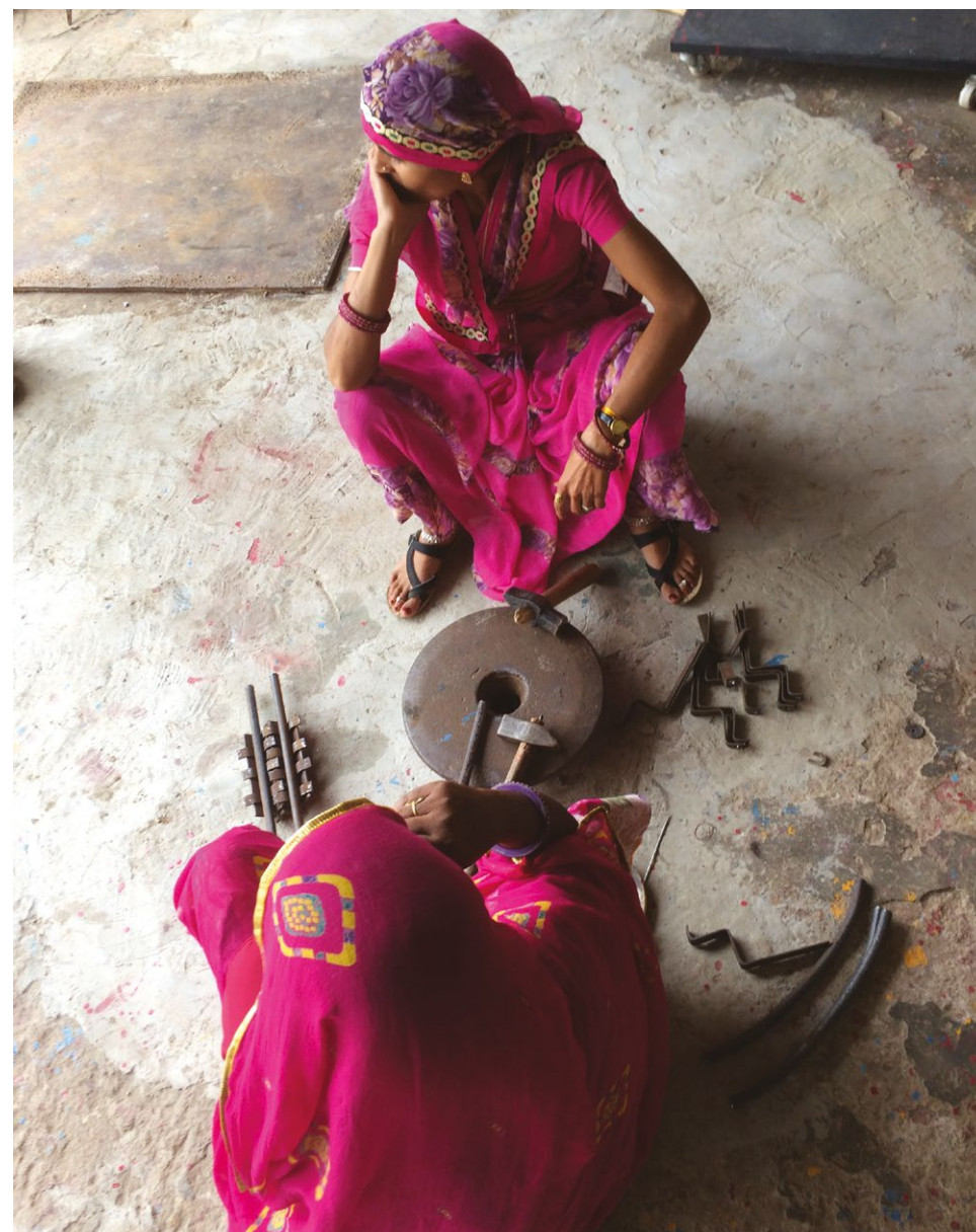
Photo 2 : Femmes travaillant le fer, Barefoot College, Tilonia, Rajasthan, Inde, 2018.

pension de retraite, l'absence de réserve (épargne, biens propres) et l'absence de soutien familial. En Europe, les mêmes éléments peuvent être mentionnés, mais les deux premiers sont beaucoup plus rares. En Afrique, dans des contextes de pauvreté où les deux premiers éléments sont prégnants, c'est le réseau familial qui fait la différence... un élément important pour comprendre les fécondités toujours élevées dans certaines parties du continent.