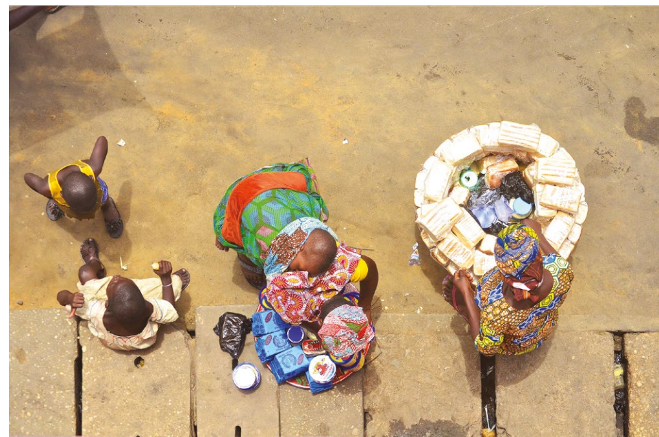
Photo 1 : Les marchandes ambulantes font une pause. Cotonou. (© photo : Stéphane brabant).

limitées à des aides appréciées mais minimales. En l'absence d'aides sociales suffisantes, les solidarités privées sont fondamentales. La vulnérabilité concerne alors les personnes les plus isolées.