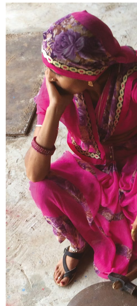
Photo 2 : Femmes travaillant le fer, Barefoot College, Tilonia, Rajasthan, Inde, 2018.

Comme en Europe, il est particulièrement marqué lorsqu'une personne n'a pas de descendance. Mais dans des contextes où la fécondité demeure relativement plus élevée que chez nous, cette situation est plus rare. Une enquête qualitative portant sur les personnes âgées et les membres de leur famille dans cinq lieux répartis dans différents milieux à travers le pays nous a permis d'aborder les systèmes de soutien autour des personnes âgées selon différents points de vue (Golaz, Wandera et Rutaremwa, 2017). Au-delà du manque immédiat de ressources personnelles qui caractérise la grande majorité des personnes âgées, les entretiens menés soulignent l'importance de l'étendue et des lieux d'implantation des systèmes de soutien, comme de la diversité des ressources qu'on y trouve. Ainsi, avoir autour de soi des enfants ou des petits enfants avec des ressources monétaires régulières, ou qui travaillent eux-mêmes la terre, est une sécurité importante en cas de baisse de l'activité. En cas de problème de santé, pouvoir être hébergée ou accompagnée par une personne vivant à proximité d'un centre de soins en est une autre. En cas de problème de logement, ou avec les récoltes ou la production agricole dans un lieu donné, en avoir un autre où la personne âgée puisse être hébergée est une bonne solution.