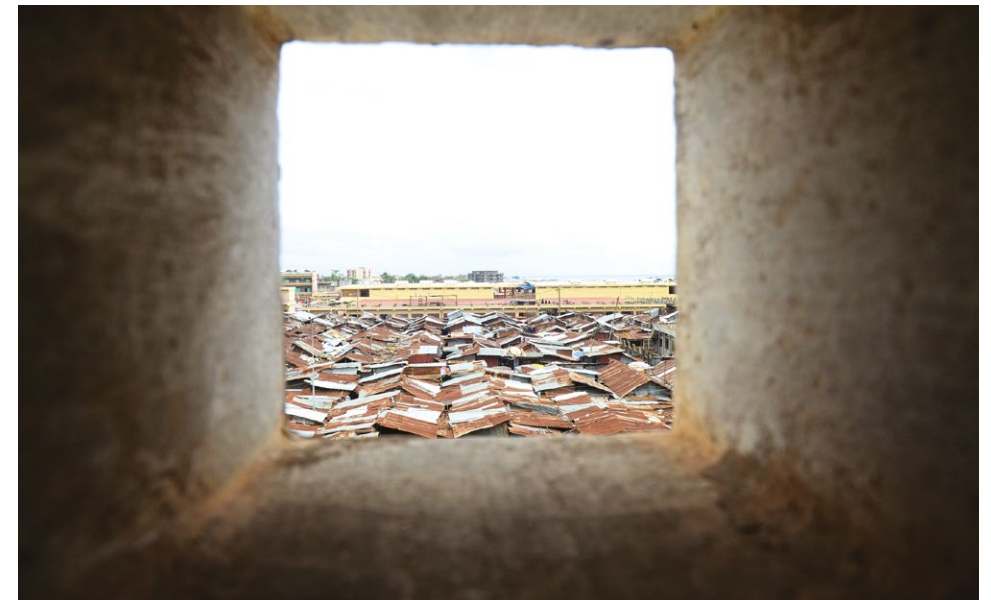
Photo 1 : Marché de Dantokpa, Cotonou, toits de tôle à perte de vue. (© photo : Stéphane Brabant).

Pris dans leur globalité, les chapitres de cet ouvrage esquissent un panorama de différentes approches des vulnérabilités sociales et environnementales. Il s'agit ici, plus que de rentrer dans le détail d'études et de recherches approfondies, de s'appuyer sur un ensemble de travaux récents pour documenter la diversité et la complémentarité des approches dans le domaine de la vulnérabilité, du risque et de la résilience, tout en démontant un certain nombre d'idées reçues communément véhiculées par les media ou les sources non scientifiques.