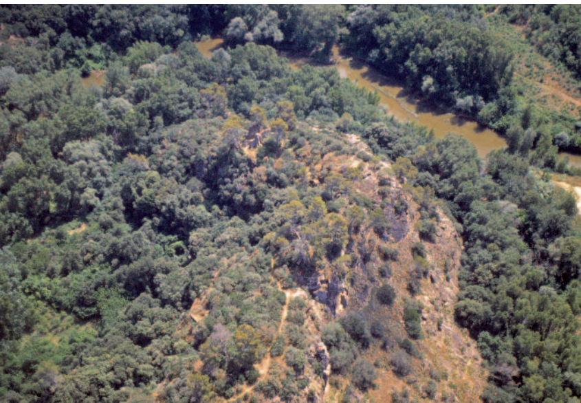
LE MUY. MARSENS : vue aérienne prise du sud-est.

Vestiges du château (voir p. 9 et article p. 27).