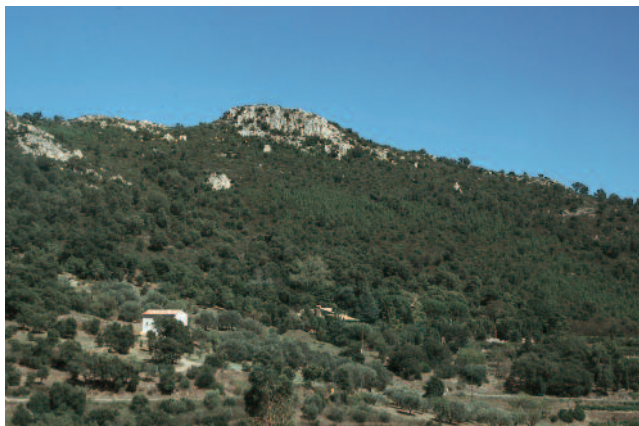
PLAN-DE-LA-TOUR, Pétiache : vue d'ensemble prise du sud-ouest.