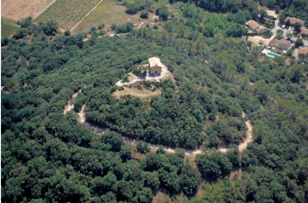
VIDAUBAN : vue aérienne prise du sud-est. Au pied, la bordure du village actuel.