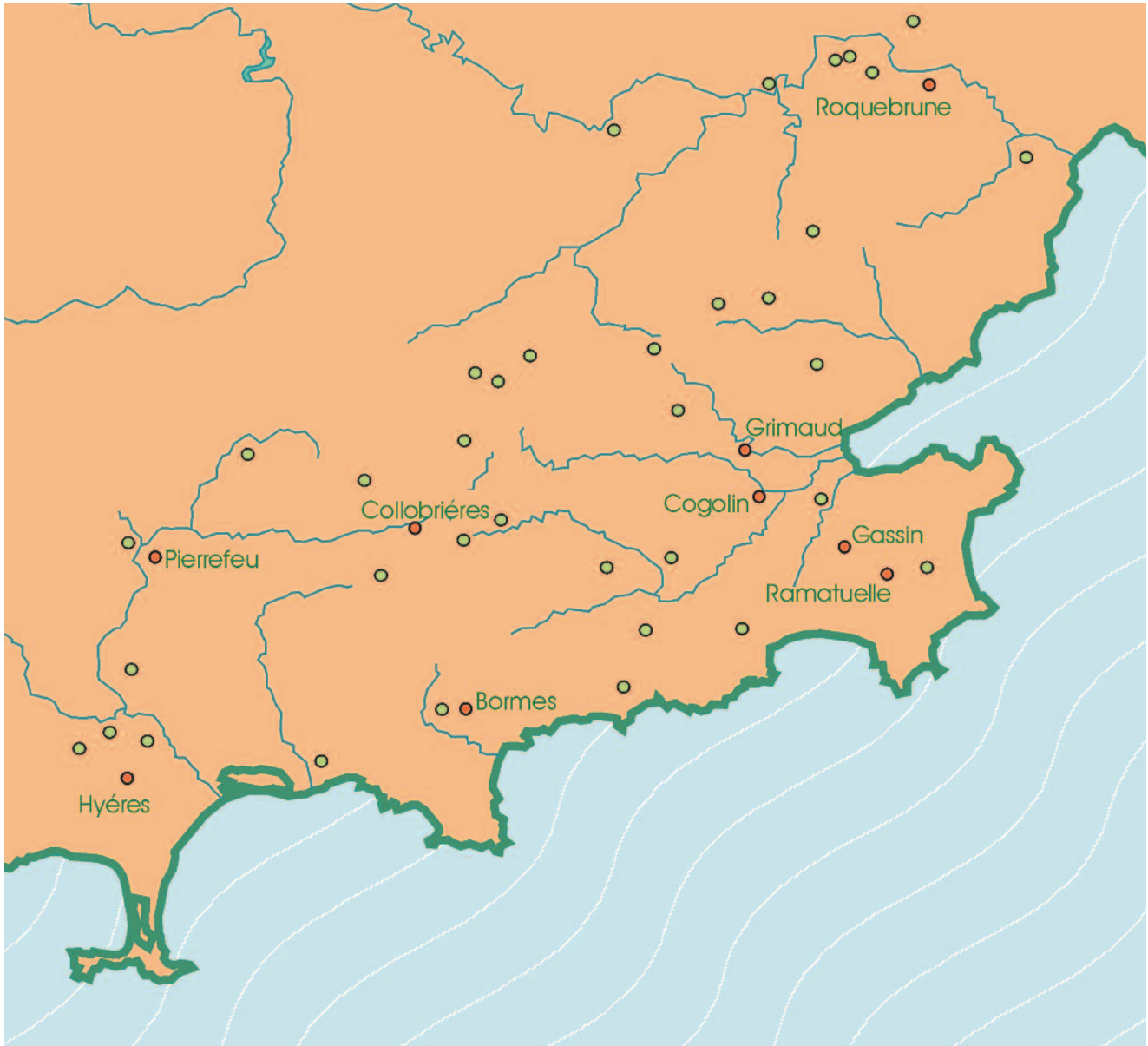
LES CASTRA DU MASSIF DES MAURES : — points verts : castra désertés, — points rouges : castra vivants.