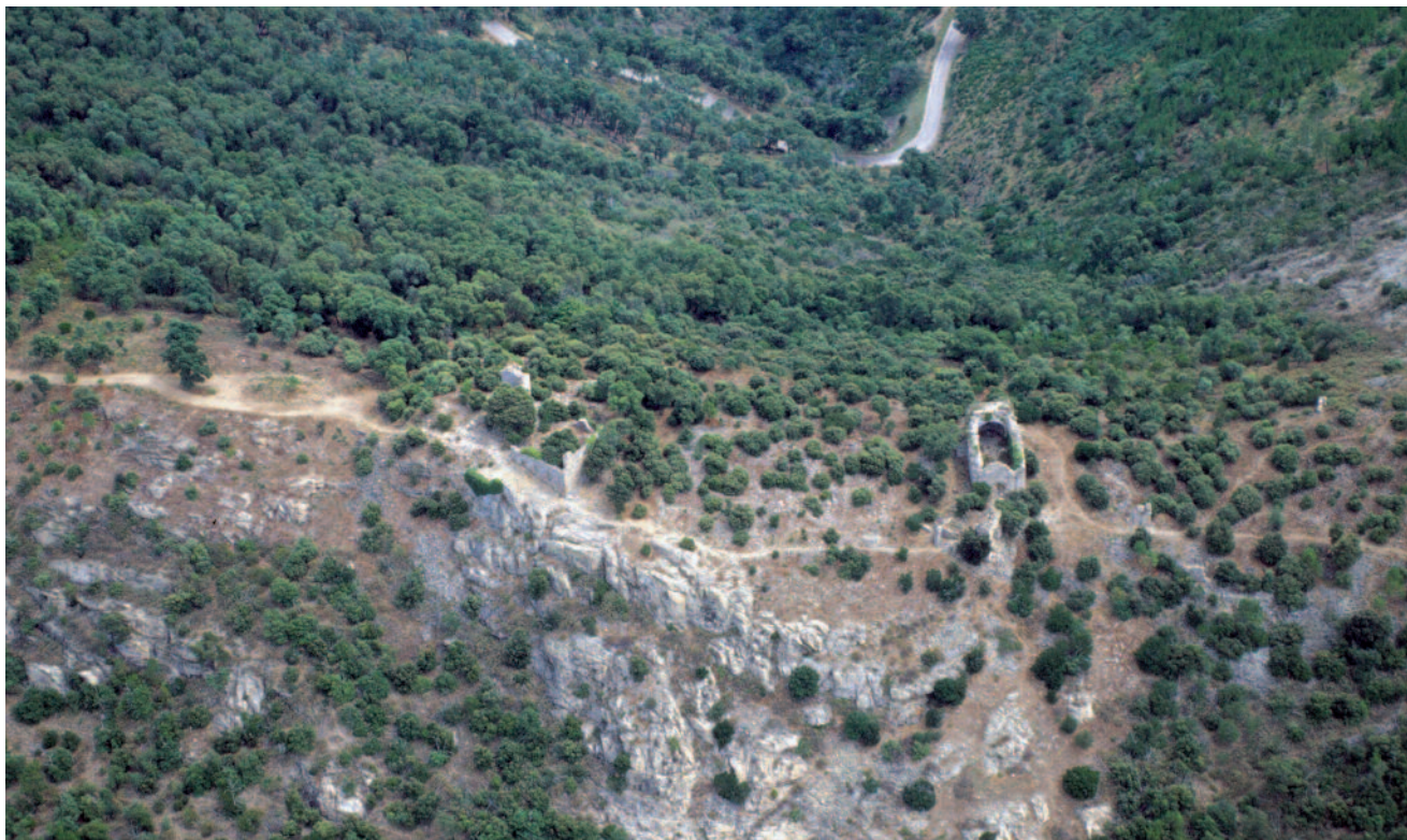
SAINTE-MAXIME, le Revest : vue aérienne prise de l'ouest.