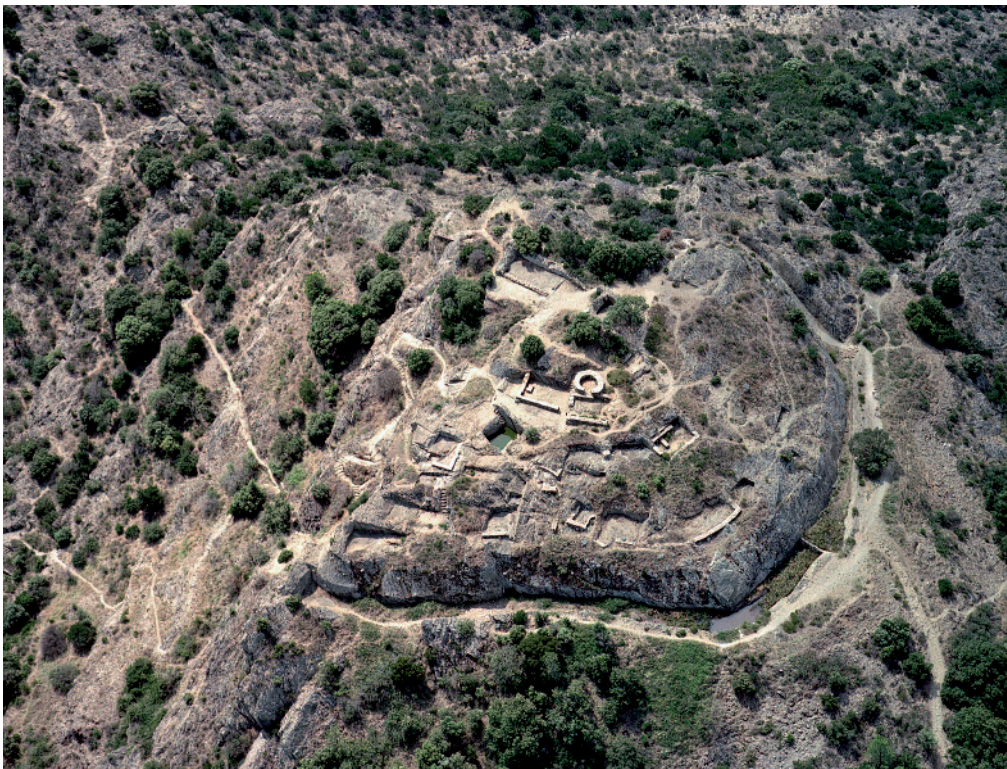
LA GARDE-FREINET : vue aérienne prise du nord-est.