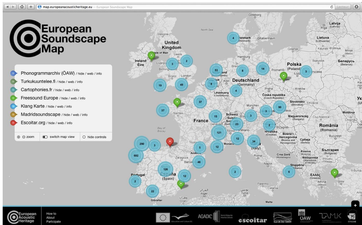
European Soundscape Map ( http://map.europeanacousticheritage.eu )

Une autre façon d’aborder la question a en effet consisté à supposer que le patrimoine sonore repose non seulement sur la matière sonore, mais aussi sur la façon dont nous écoutons et produisons les sons. Au quotidien, nous adoptons différents modes d’écoute pour donner un sens à nos actions. Les sons connotent, signent nos actes et nous engagent avec empathie dans les milieux où nous sommes. Ces modes d’écoute et de production sonore, en lien avec les langages et les différentes formes de communication, forment des cultures d’écoute qui doivent aussi être identifiées et sauvegardées. Pour cela, nous avons travaillé sur la forme même de l’archivage sonore en nous appuyant sur le fait que les environnements sonores actuels et passés sont socialement construits et perçus. Toute documentation doit alors pouvoir refléter ces modalités afin de les archiver et de les rendre accessibles pour le futur. La dimension artistique devient fondamentale dans la forme de restitution proposée : elle reflète les liens esthétiques des hommes avec les sons de leur quotidien.