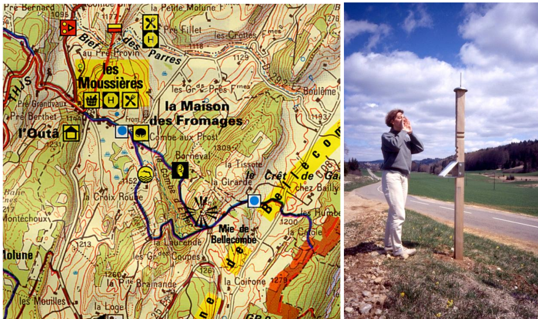
Extrait de la carte Topo Haut Jura / IGN / avec pictogramme mentionnant les points d'ouïe répertoriés – Installation d'un mat avec test vocal

Ces gestes créatifs d'aménagement relèvent d'une démarche d'observatoire sensible dynamique dotant ce PNR d'une reconnaissance de son identité sonore sans doute inégalée à ce jour 10 .