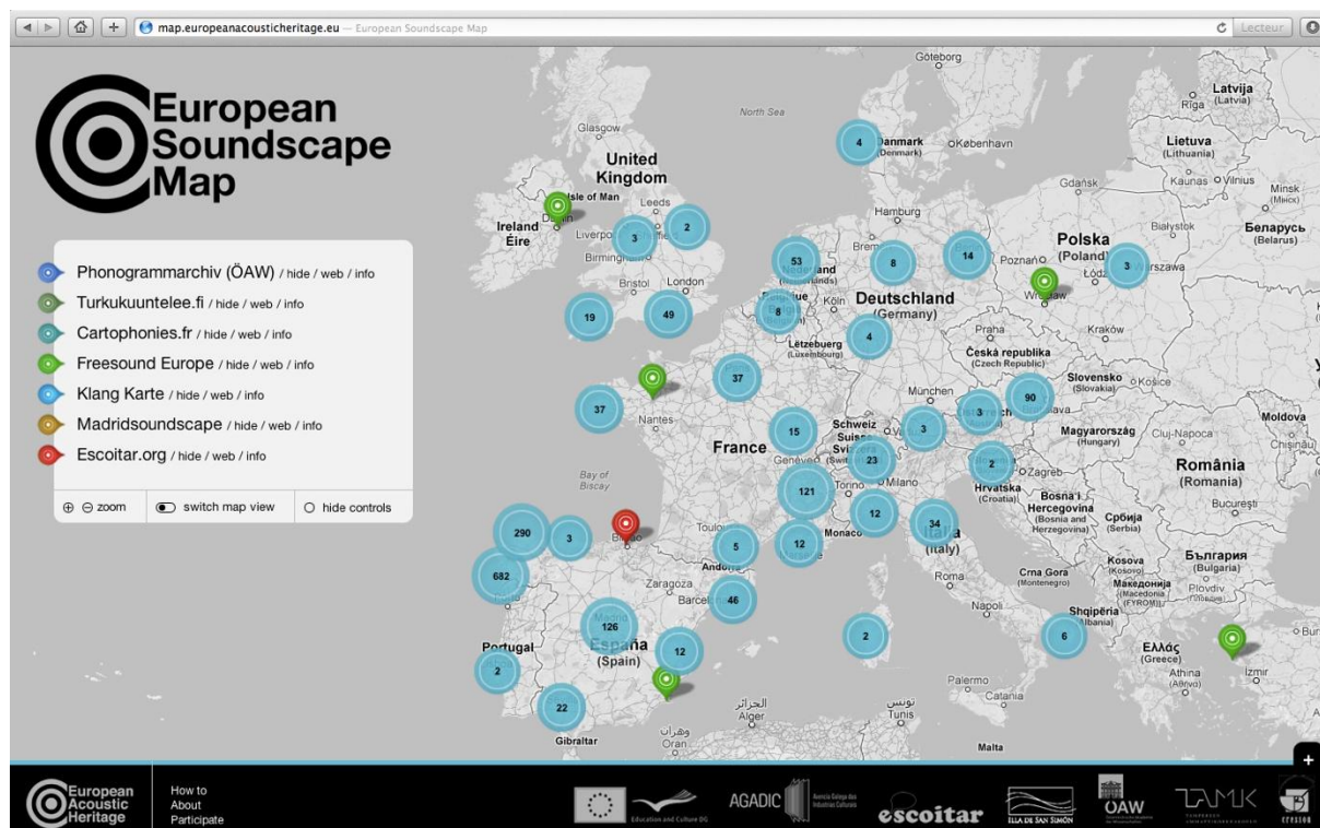
European Soundscape Map ( http://map.europeanacousticheritage.eu )

Une autre façon d’aborder la question a en effet consisté à supposer que le patrimoine sonore repose non seulement sur la matière sonore, mais aussi sur la façon dont nous écoutons et produisons les sons. Au quotidien, nous adoptons différents modes d’écoute pour donner un sens à nos actions. Les sons connotent, signent nos actes et nous engagent avec empathie dans les milieux où nous sommes. Ces modes d’écoute et de production sonore, en lien avec les langages et les différentes formes de communication, forment des cultures d’écoute qui doivent aussi être identifiées et sauvegardées. Pour cela, nous avons travaillé sur la forme même de l’archivage sonore en nous appuyant sur le fait que les environnements sonores actuels et passés sont socialement construits et perçus. Toute documentation doit alors pouvoir refléter ces modalités afin de les archiver et de les rendre accessibles pour le futur. La dimension artistique devient fondamentale dans la forme de restitution proposée : elle reflète les liens esthétiques des hommes avec les sons de leur quotidien.