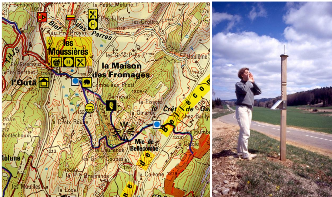
Extrait de la carte Topo Haut Jura / IGN / avec pictogramme mentionnant les points d'ouïe répertoriés – Installation d'un mat avec test vocal

Ces gestes créatifs d'aménagement relèvent d'une démarche d'observatoire sensible dynamique dotant ce PNR d'une reconnaissance de son identité sonore sans doute inégalée à ce jour 10 .