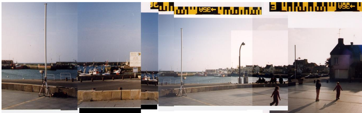
Les 24 heures de Lesconil (à l'écoute sur www.cartophonies.fr )

Mixage de 24 fragments enregistrés sur la place centrale pour en représenter l'ambiance sur 24h.