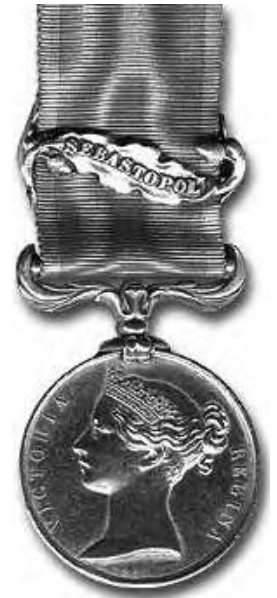
Médaille de Crimée avec agrafe de Sébastopol.