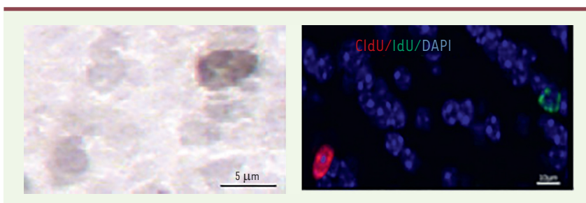
Figure 1. Coupes de bulbes olfactifs de souris adultes, montrant la présence de neurones nés récemment dans la zone sous-ventriculaire des ventricules latéraux. A. Exemple d'un de ces nouveaux neurones, marqué au BrdU. B. Exemple de deux nouveaux neurones issus de deux vagues différentes de neurogenèse et marqués, l'un au ClU (en rouge), et l'autre à l'IdU (en vert). Le marquage au DAPI (en bleu) permet de visualiser le noyau cellulaire.

après leur naissance), et augmente leur taux de survie [8-9]. Pour mieux comprendre le rôle de ces neurones dans la mémoire à long terme, nous avons tout d'abord cherché à savoir si les nouveaux neurones qui survivaient grâce à l'apprentissage étaient présents dans le bulbe olfactif aussi longtemps que les informations apprises étaient gardées en mémoire. Nous avons ainsi testé la mémoire de souris entre une et cinq semaines après un apprentissage de discrimination olfactive, et nous avons analysé la survie des nouveaux neurones dans le bulbe olfactif grâce à la technique de marquage des neurones néo-formés par la bromo-désoxyuridine (BrdU) (Figure 1A). Cette molécule s'intègre dans l'ADN au moment de sa synthèse (quand la cellule est en division), et on peut la visualiser ensuite par immunomarquage et identifier ainsi les neurones formés chez l'adulte. Nous avons montré que tant que l'information est en mémoire, les nouveaux neurones