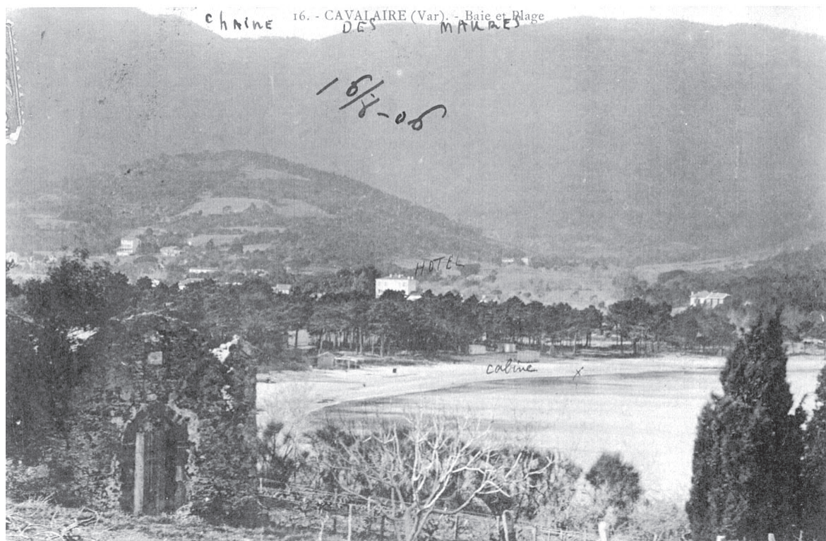
- Carte postale du début du siècle - Ruine de la chapelle, à gauche-